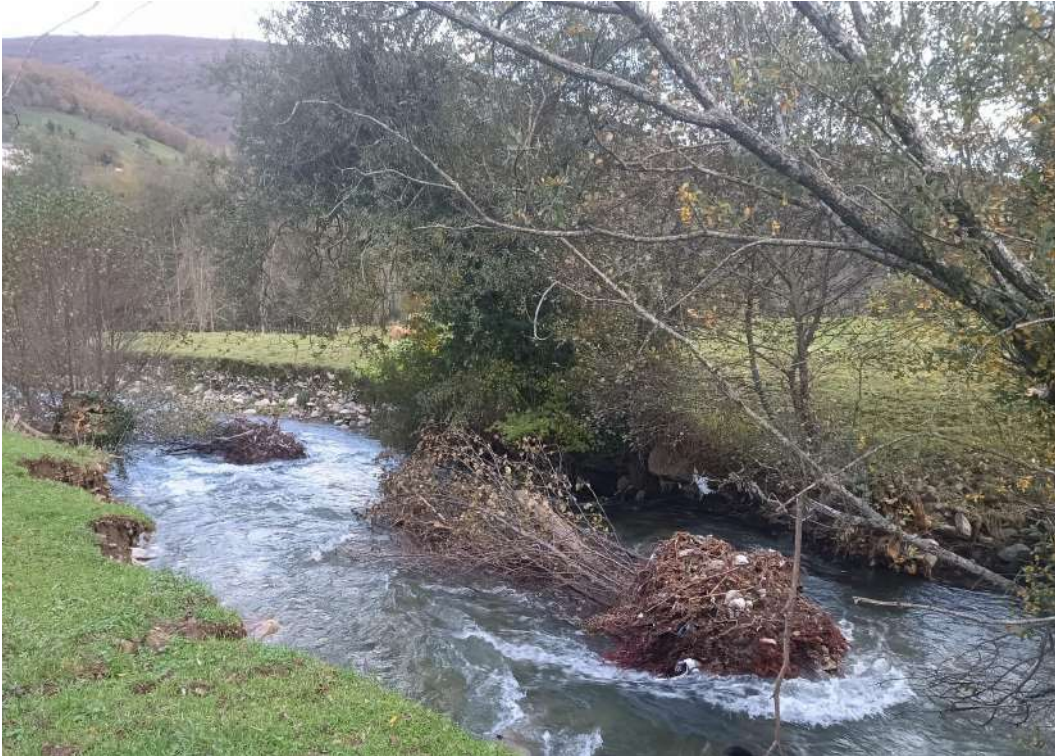
Restos vegetales acumulados en el interior del cauce