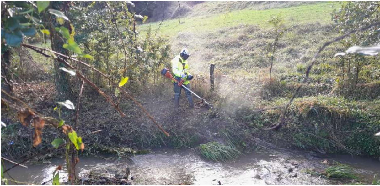
Inicio de los trabajos sobre la vegetación