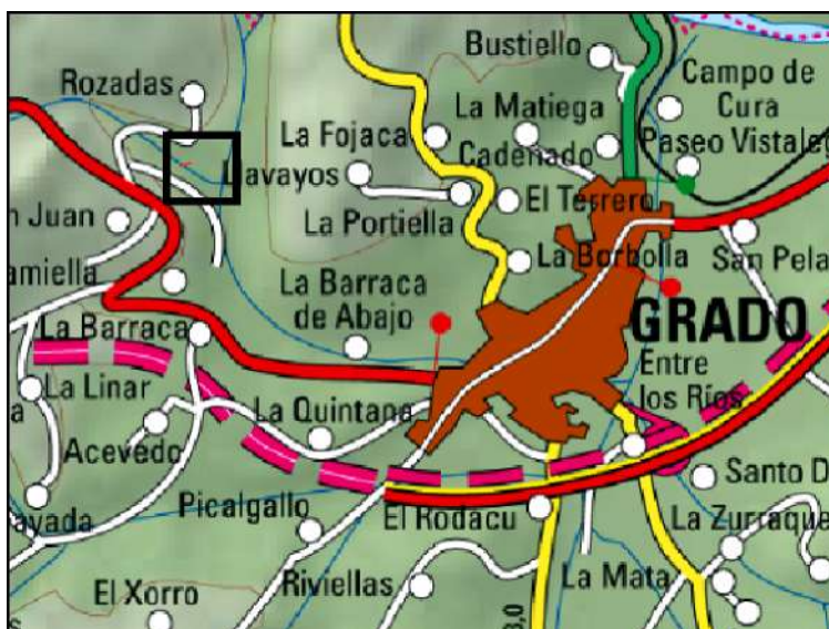
Ubicación de la actuación en el río Ferreira en Rozadas