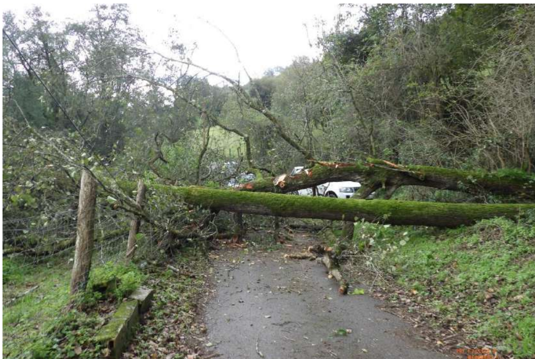
Árboles caídos de grandes dimensiones sobre el camino y la finca particular