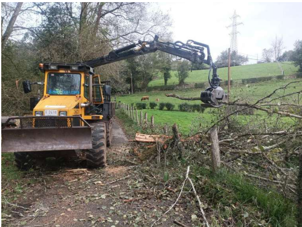
Labores de retirada de los árboles derribados