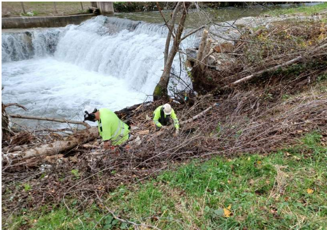
Trabajos de retirada de árboles caídos