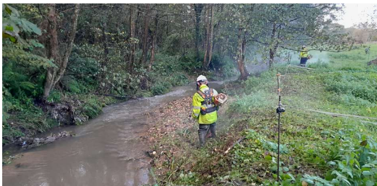
Inicio de los trabajos sobre la vegetación