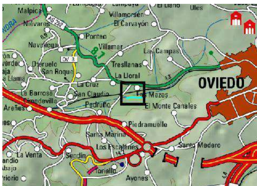
Ubicación de la actuación en el arroyo San Claudio