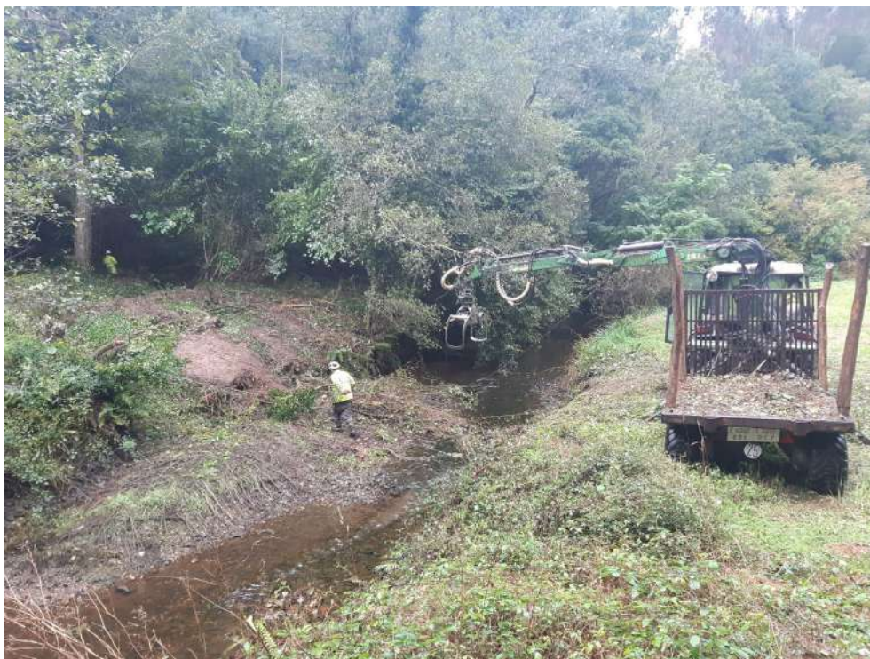
Operario y autocargador retirando restos vegetales de la margen en Santo Tomé.