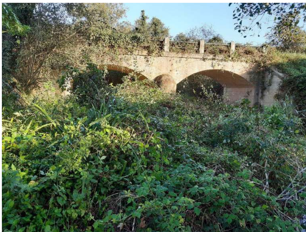
Antes de los trabajos en O Pedregal