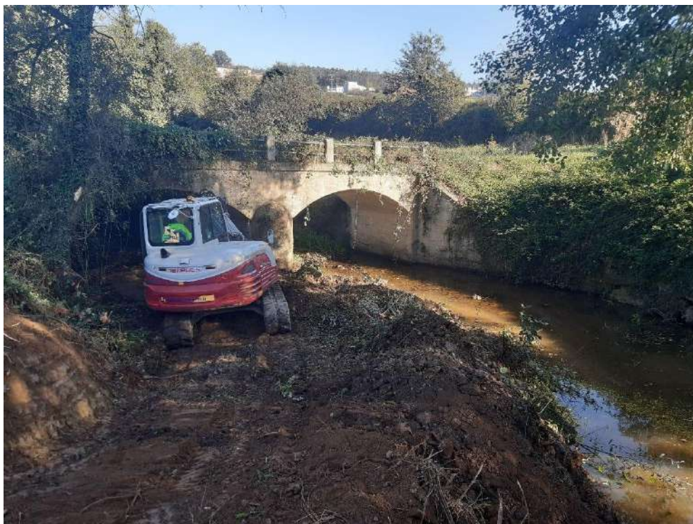
Durante los trabajos en O Pedregal