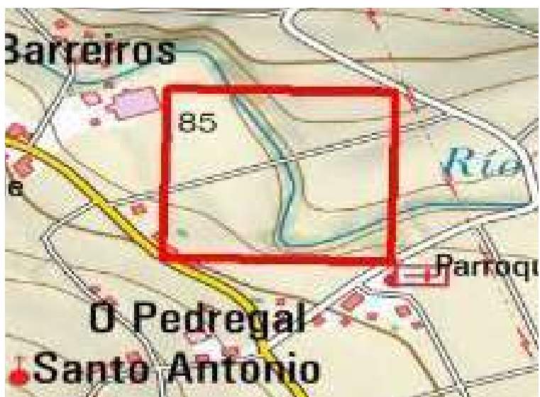
Localización de la actuación en el río Grande en O Pedregal