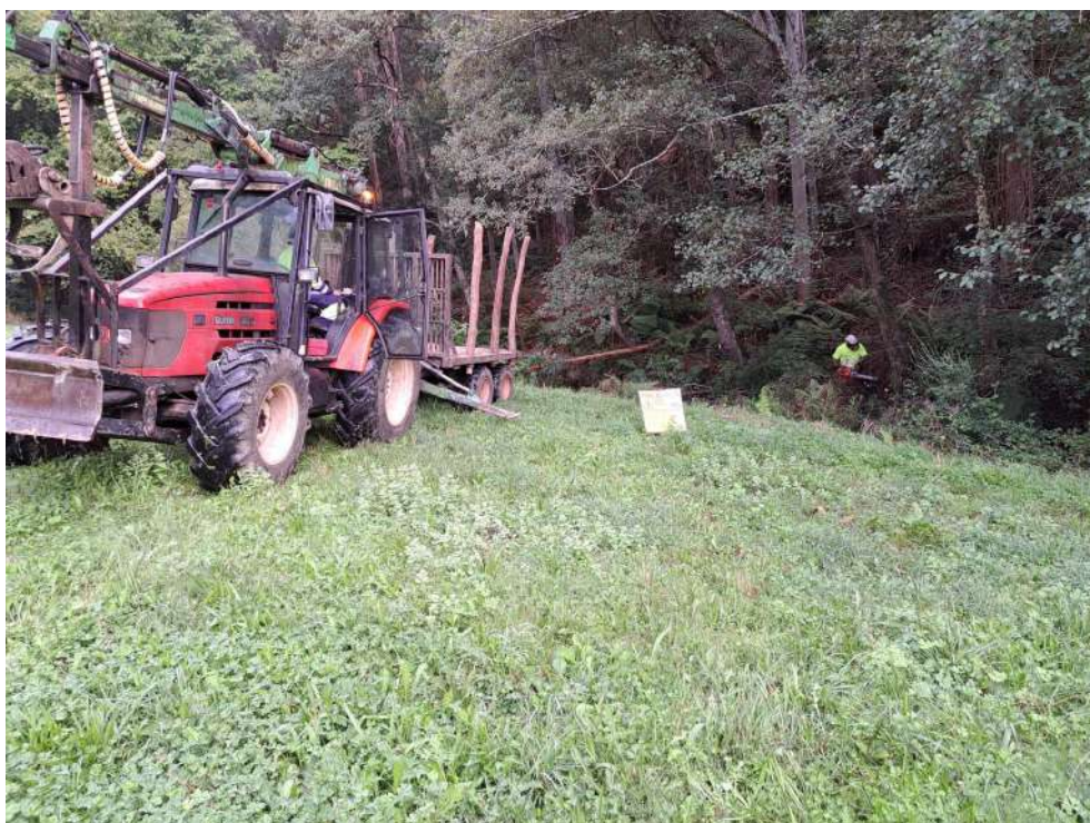
Trabajos de retirada de los restos vegetales acumulados