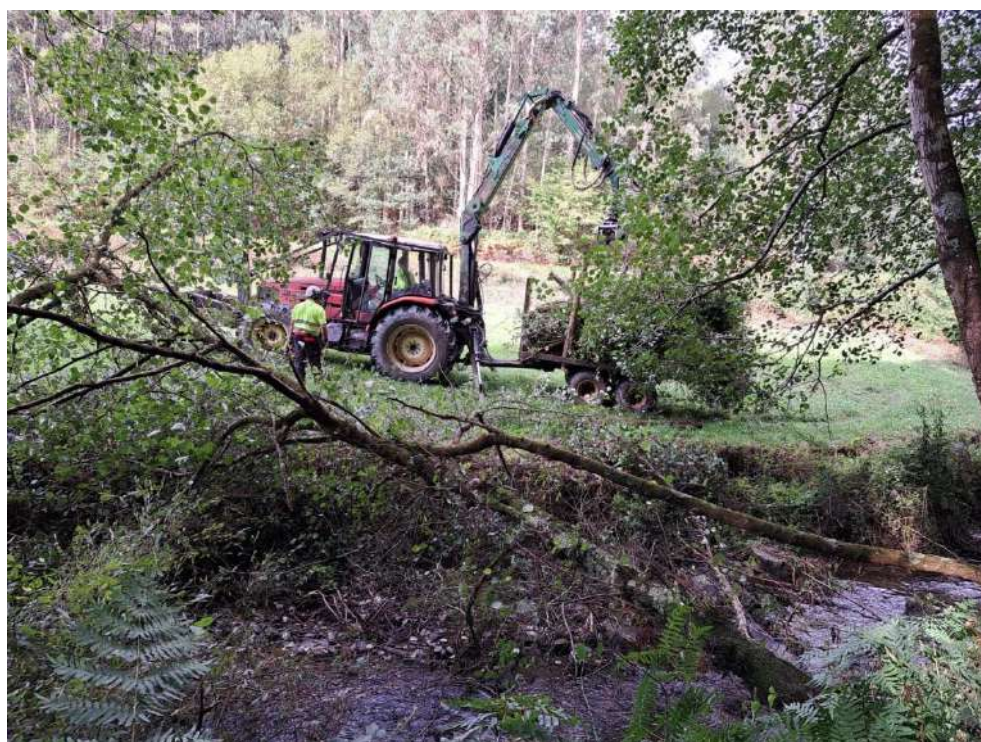
Árboles caídos sobre el cauce