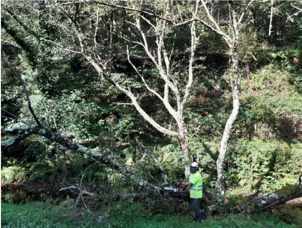
Árbol seco sobre el cauce con riesgo de caída