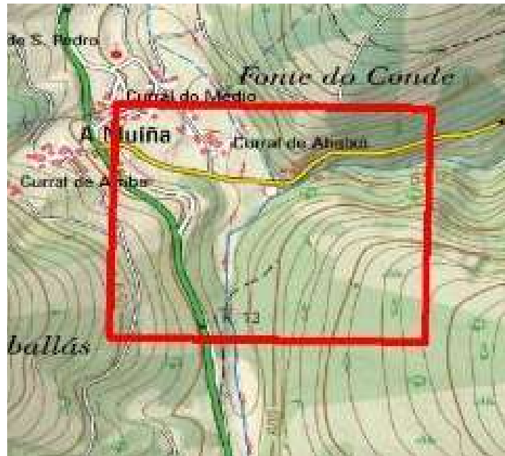
Localización de las actuaciones en el rego de Cabana en Baleira