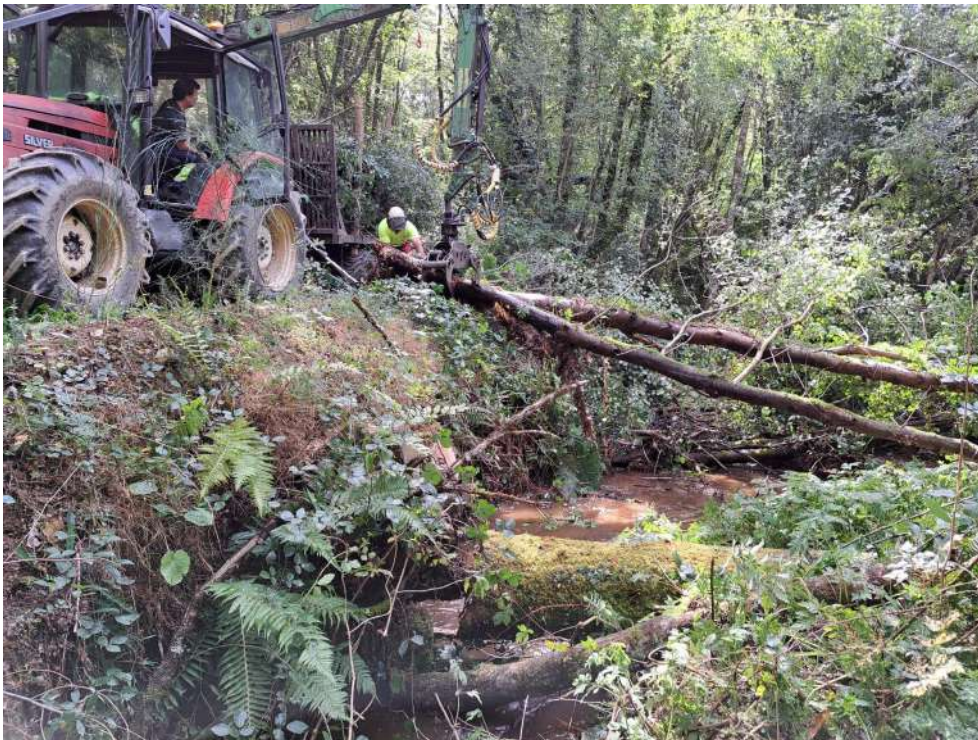
Trabajos de retirada de árboles caídos