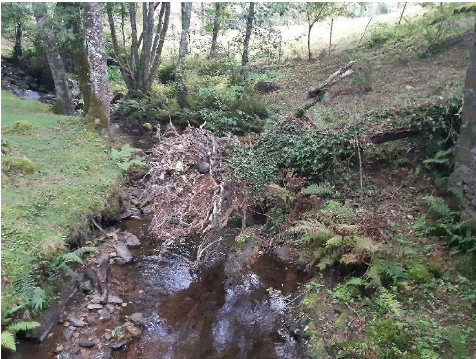
Restos vegetales acumulados en el cauce