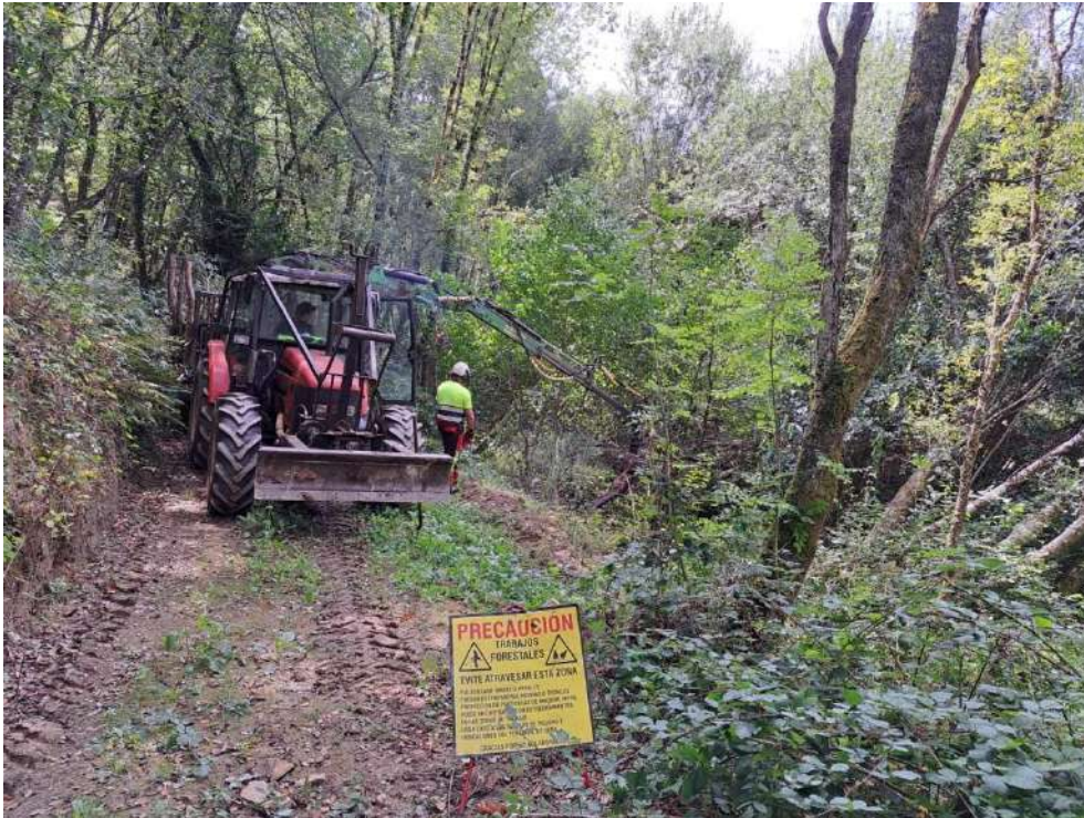
Trabajos de retirada de árboles caídos