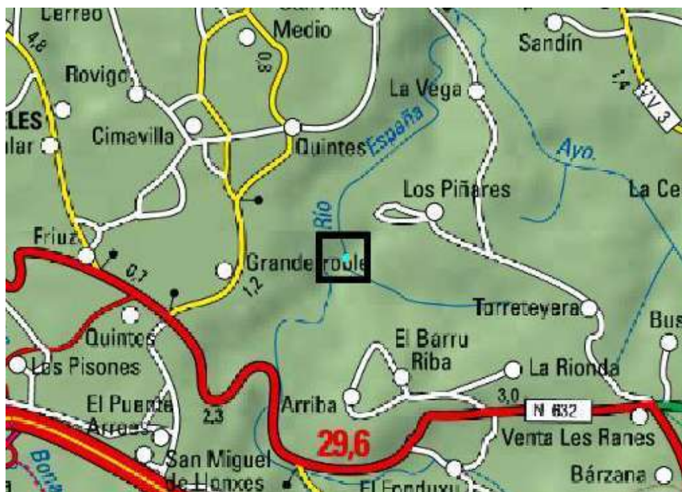
Ubicación de actuación del río España