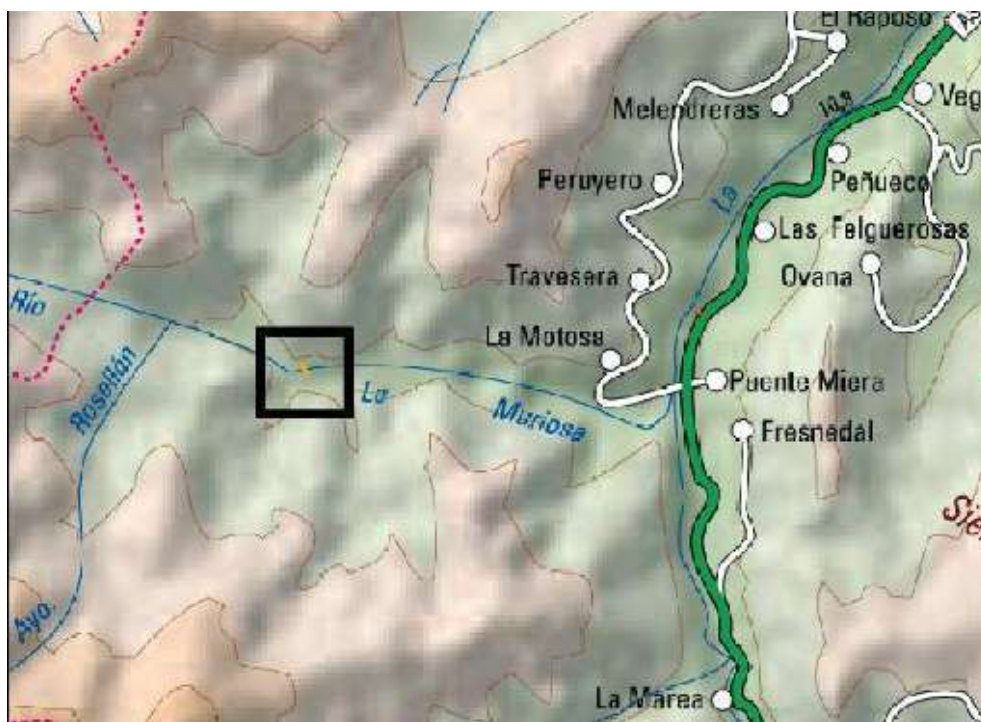
Ubicación de actuación del río La Muriosa