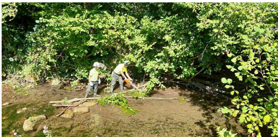
Trabajos de retirada de restos vegetales.