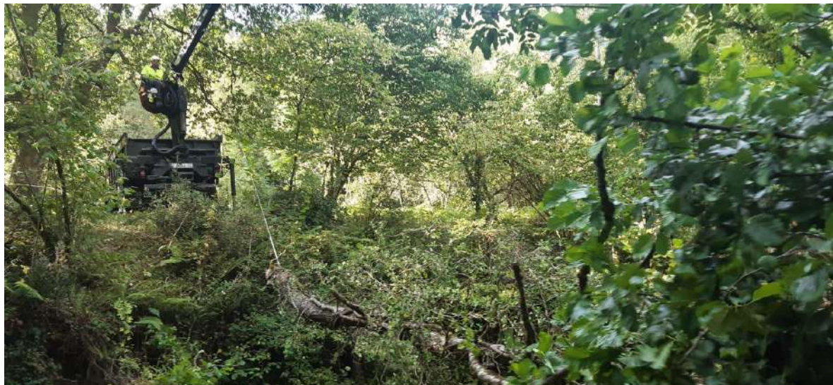
Auxilio mecánico para extraer los troncos