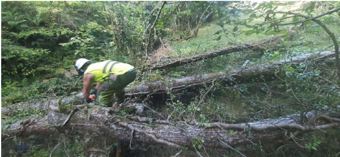
Trabajos de tronzado para facilitar la extracción de los árboles caídos