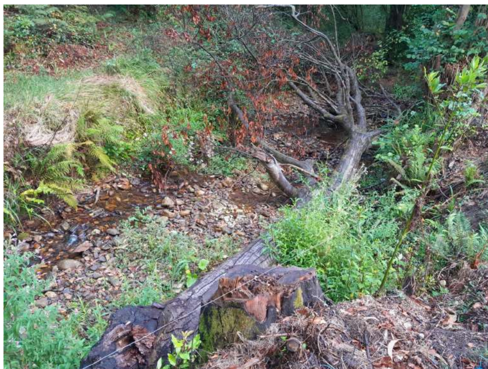
Tronco caído en la zona de actuación de La Machuquera