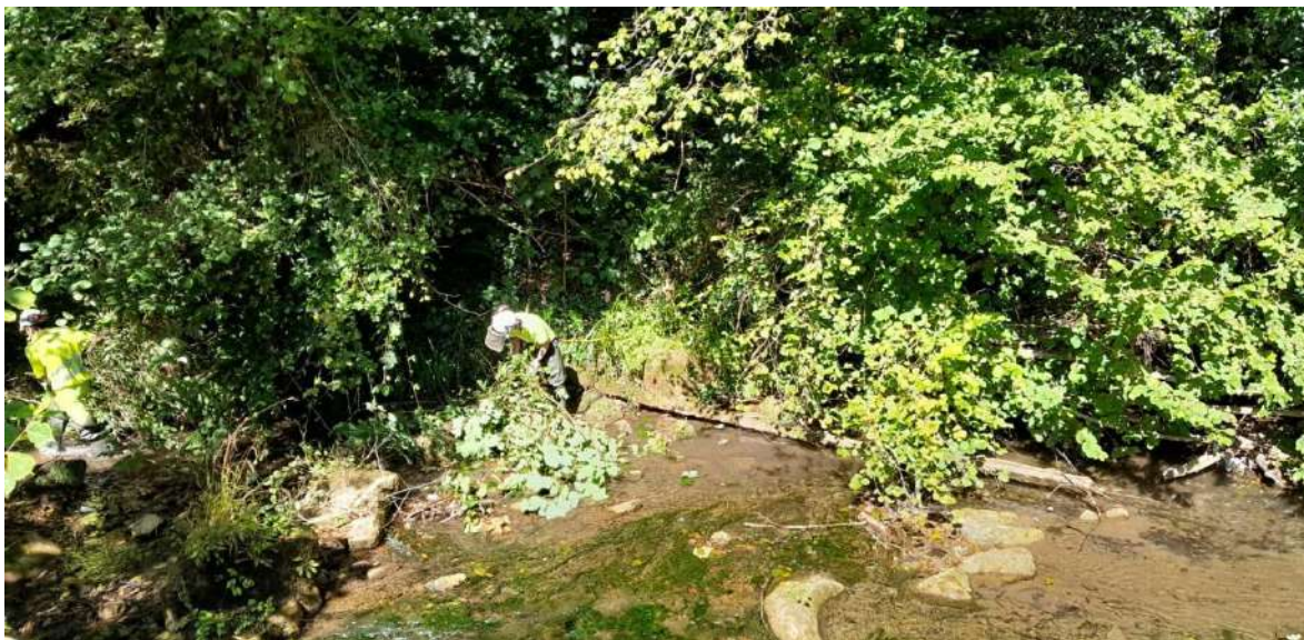
Trabajos de retirada de restos vegetales.