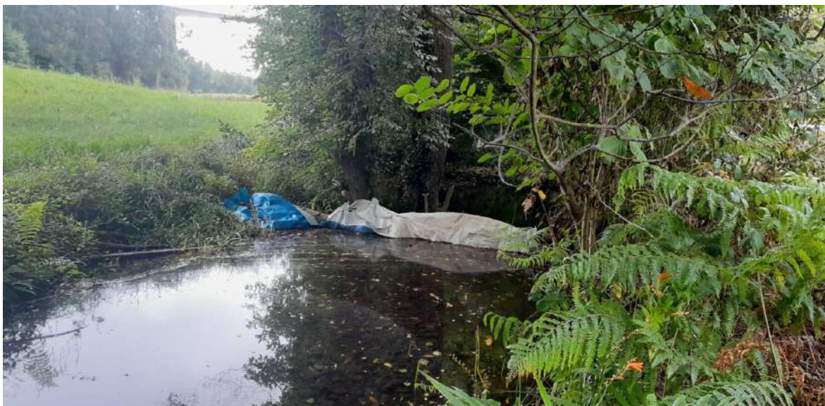
Represa ilegal en el cauce en Samiguel