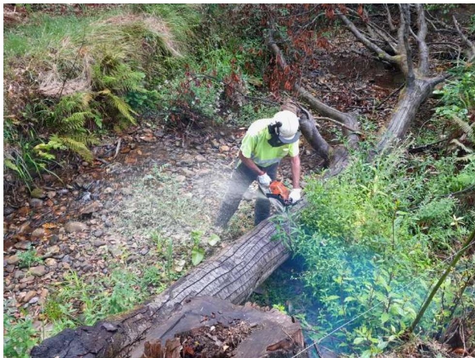
Trabajos de extracción del árbol caído en La Machuquera