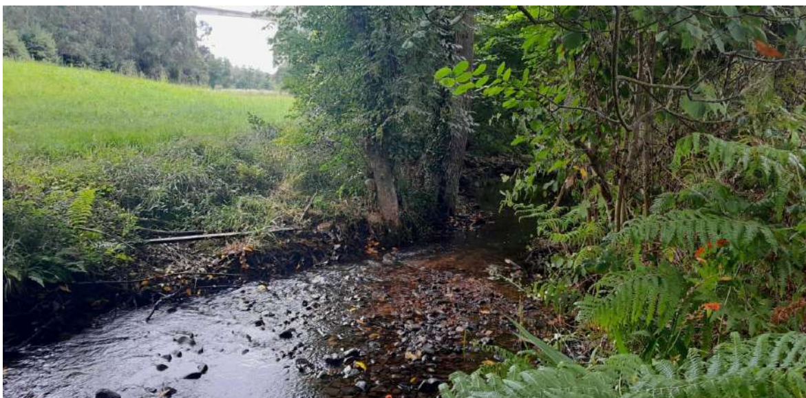
Situación después de la actuación en Samiguel