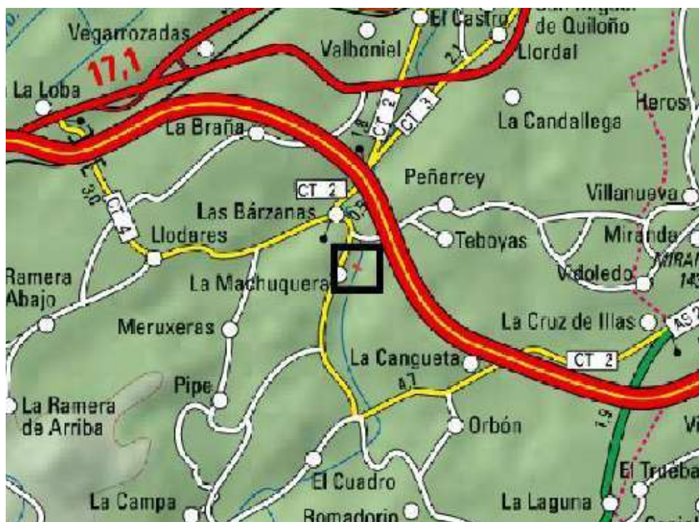
Ubicación de la actuación en el río Raíces en La Machuquera