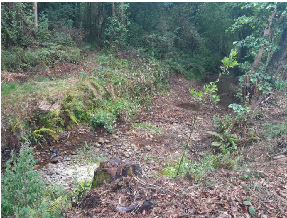
Situación después de los trabajos en La Machuquena