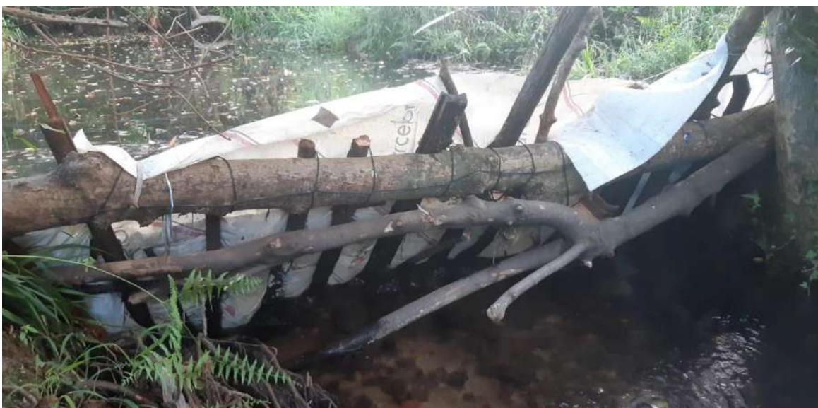
Detalle de la represa ilegal en Samiguel