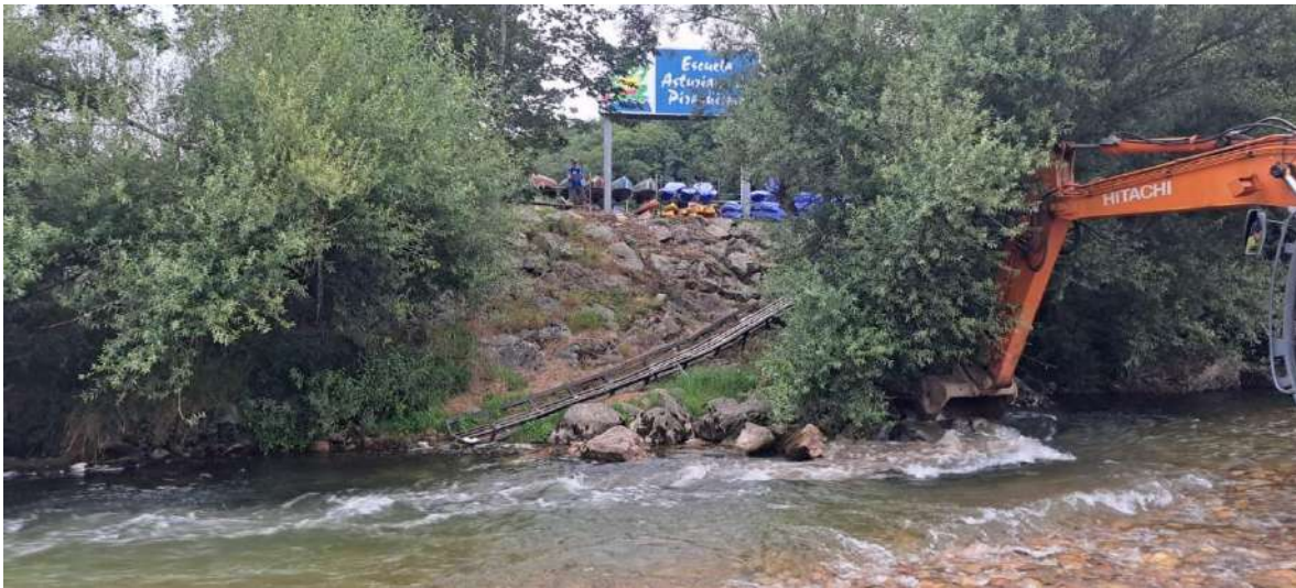
Durante los trabajos