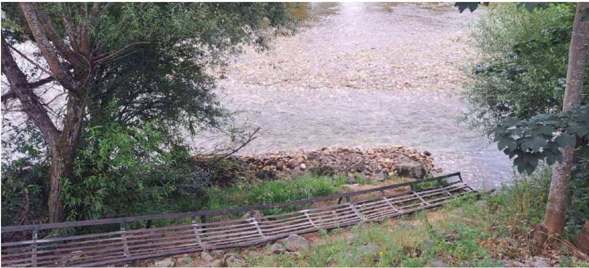
Después de los trabajos