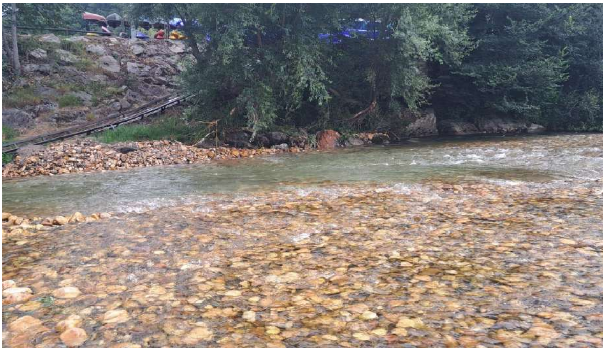
Después de los trabajos