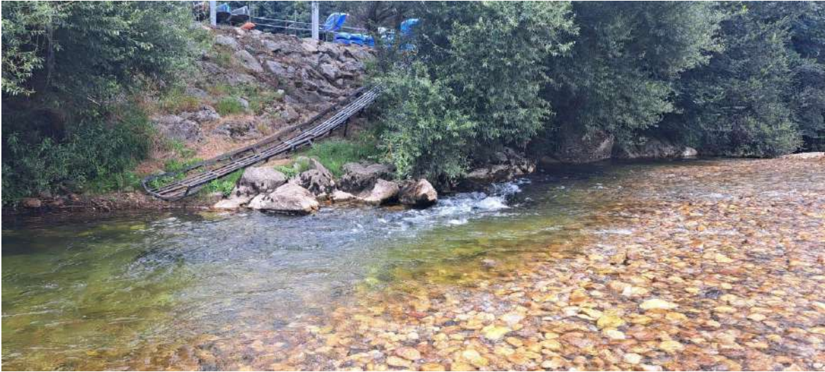
Antes de los trabajos