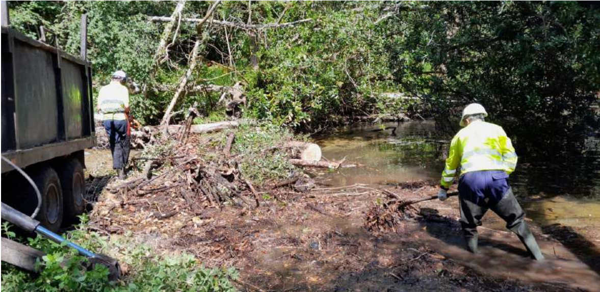
Labores de retirada de restos vegetales arrastrados por la corriente