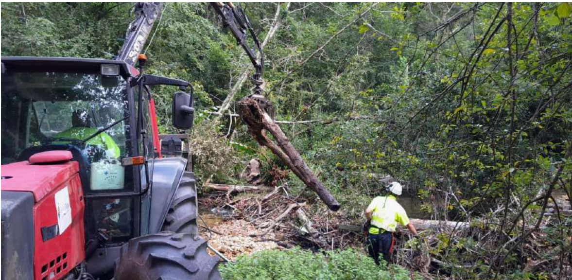
Labores de retirada de restos vegetales arrastrados por la corriente