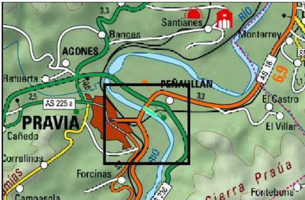
Ubicación de la actuación en el río Nalón en Pravia