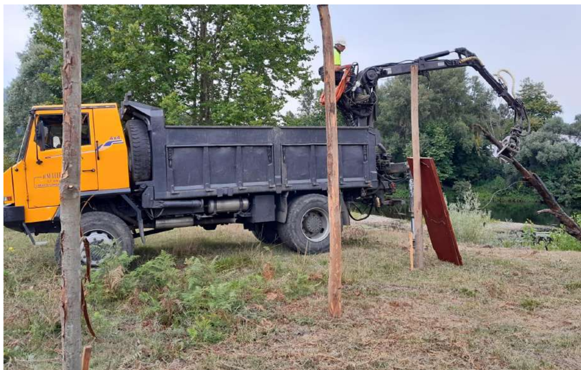
Durante los trabajos