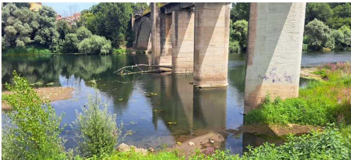
Antes de los trabajos