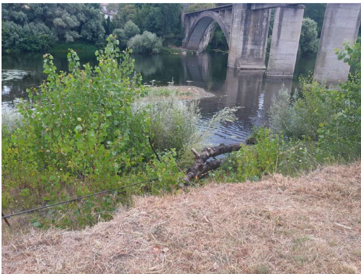
Durante los trabajos