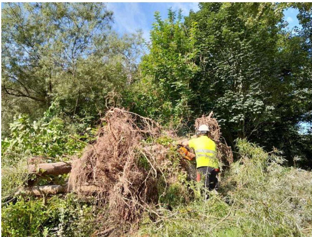
Tronzado de restos vegetales