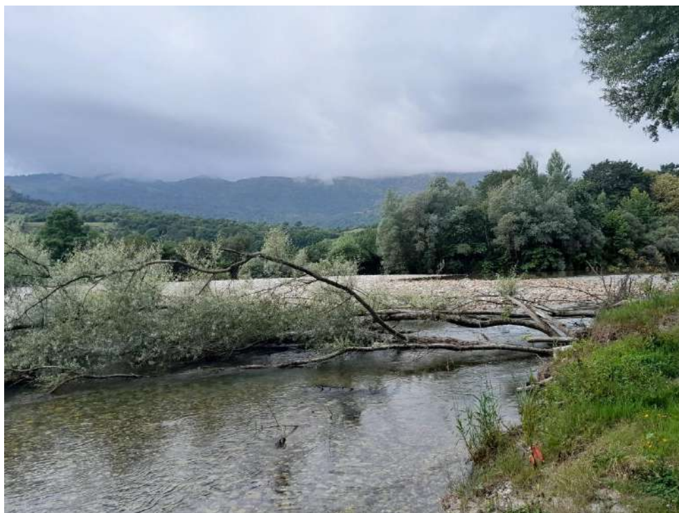
Árboles caídos en el cauce