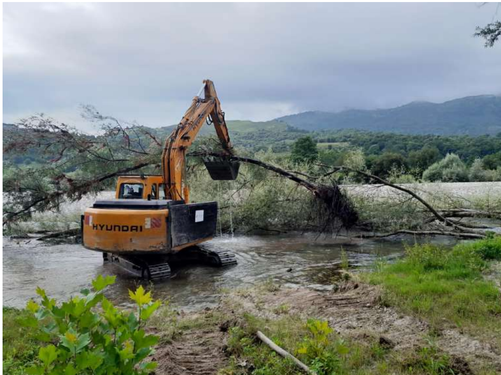
Extracción de árboles caídos con maquinaria