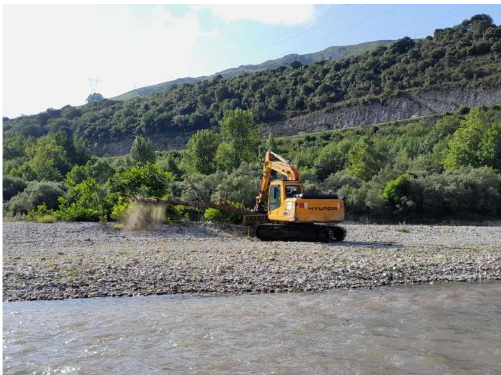
Extracción de árboles caídos con maquinaria