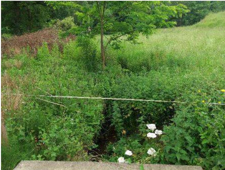
Antes. Vegetación sobre el cauce con presencia de especies exóticas invasoras