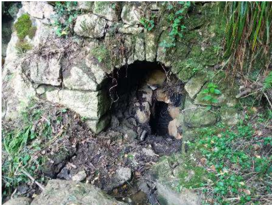
Después: Boca del paso del arroyo sin obstrucción tras la intervención.