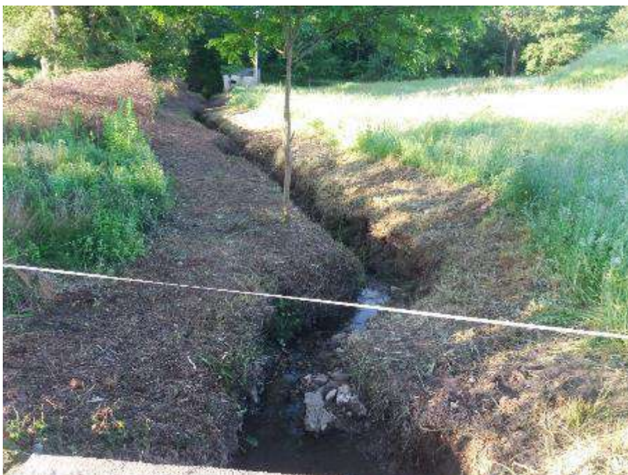
Después: Situación del cauce tras la intervención