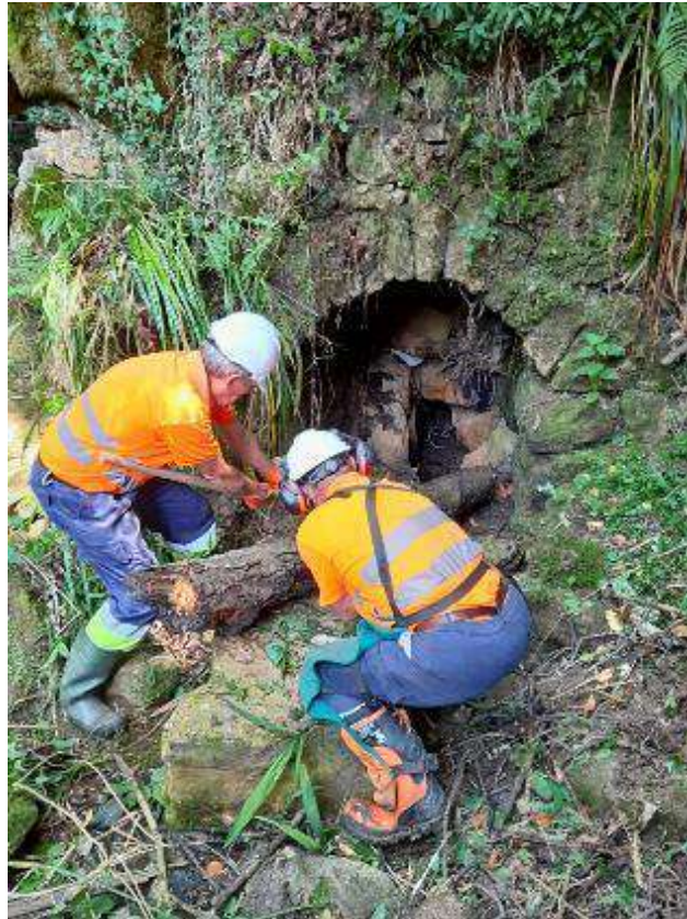
Antes. Retirada de taponamiento de restos vegetales