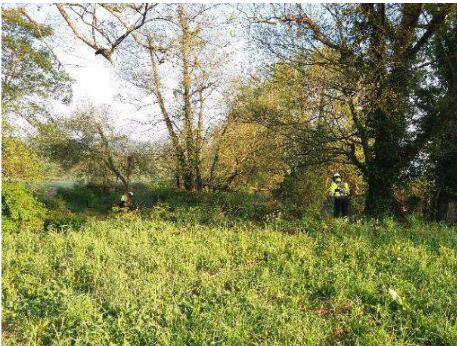
Trabajos de desbroce de la vegetación arbustiva del cauce.