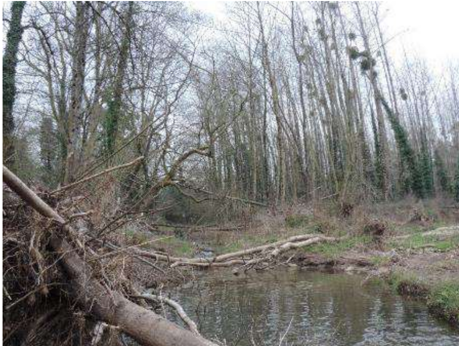
Antes: Taponamientos en el cauce causados por restos vegetales de diverso tamaño