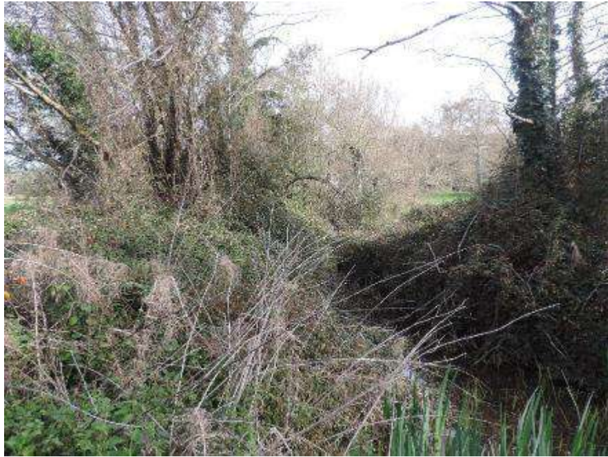
Antes: Vegetación ocupando la sección del cauce.