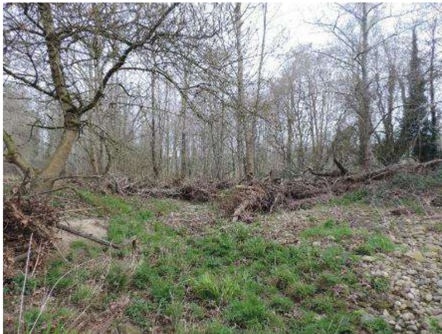
Antes: Restos de vegetales acumulados que afectan al cauce.