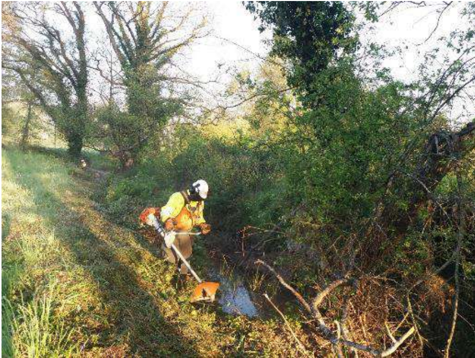
Trabajos de desbroce de la vegetación arbustiva del cauce.