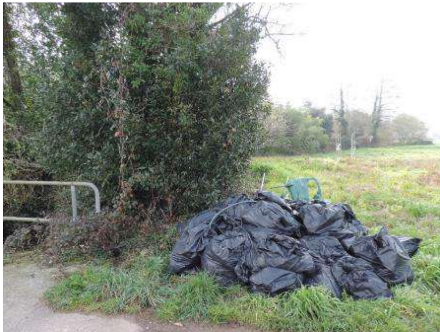
Restos antrópicos extraídos a lo largo del arroyo