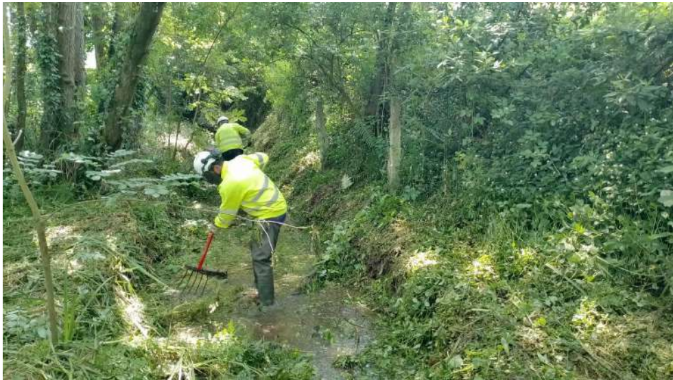
Trabajos sobre la vegetación arbustiva del interior del cauce