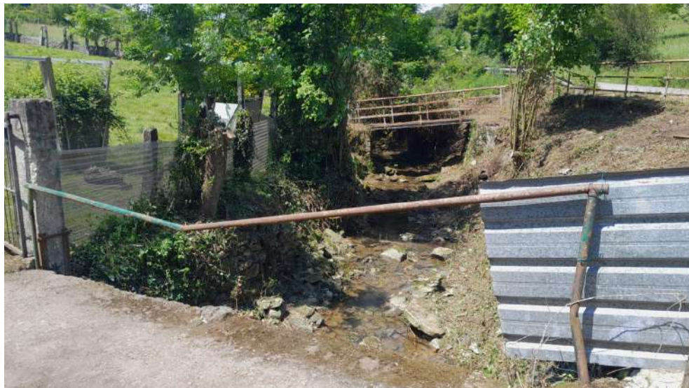
Situación después de los trabajos en el Veranes en Sotiello