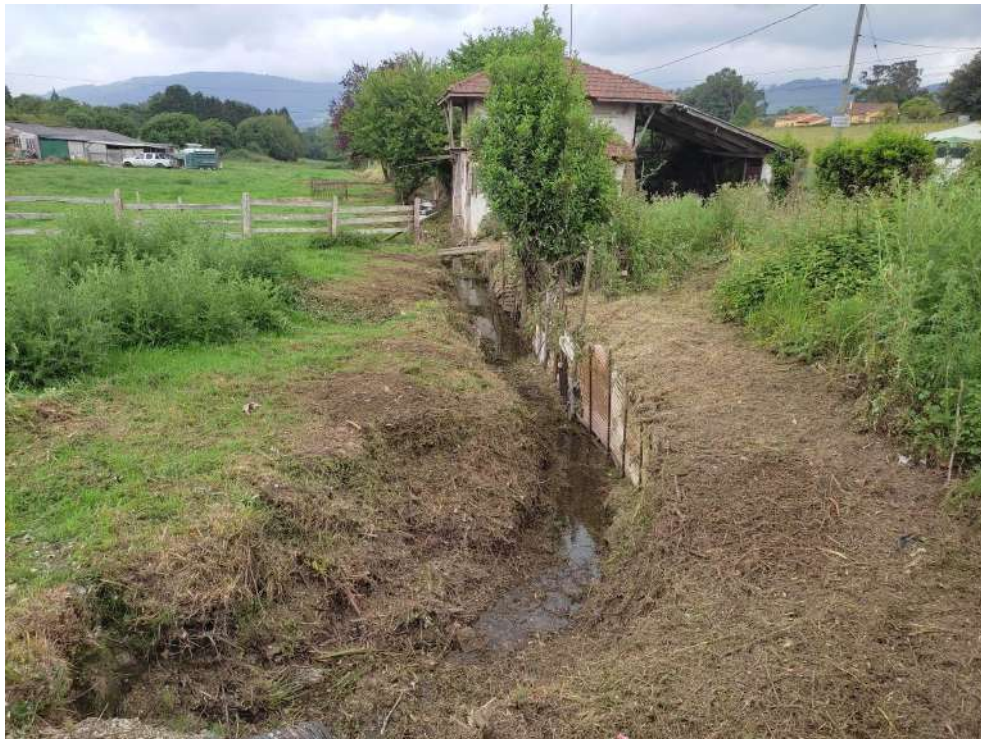
Situación después de los trabajos en el río Foro