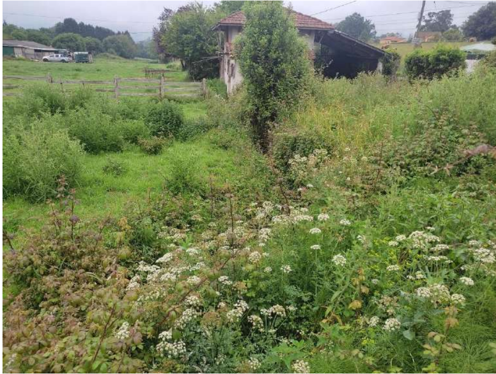
Situación antes de los trabajos en el río Foro