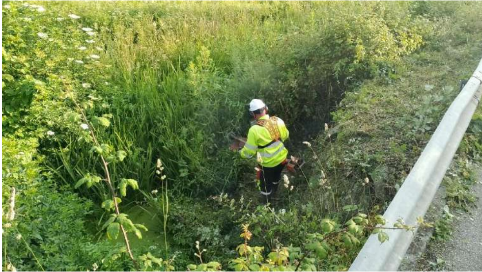
Trabajos sobre la vegetación arbustiva en el interior del cauce