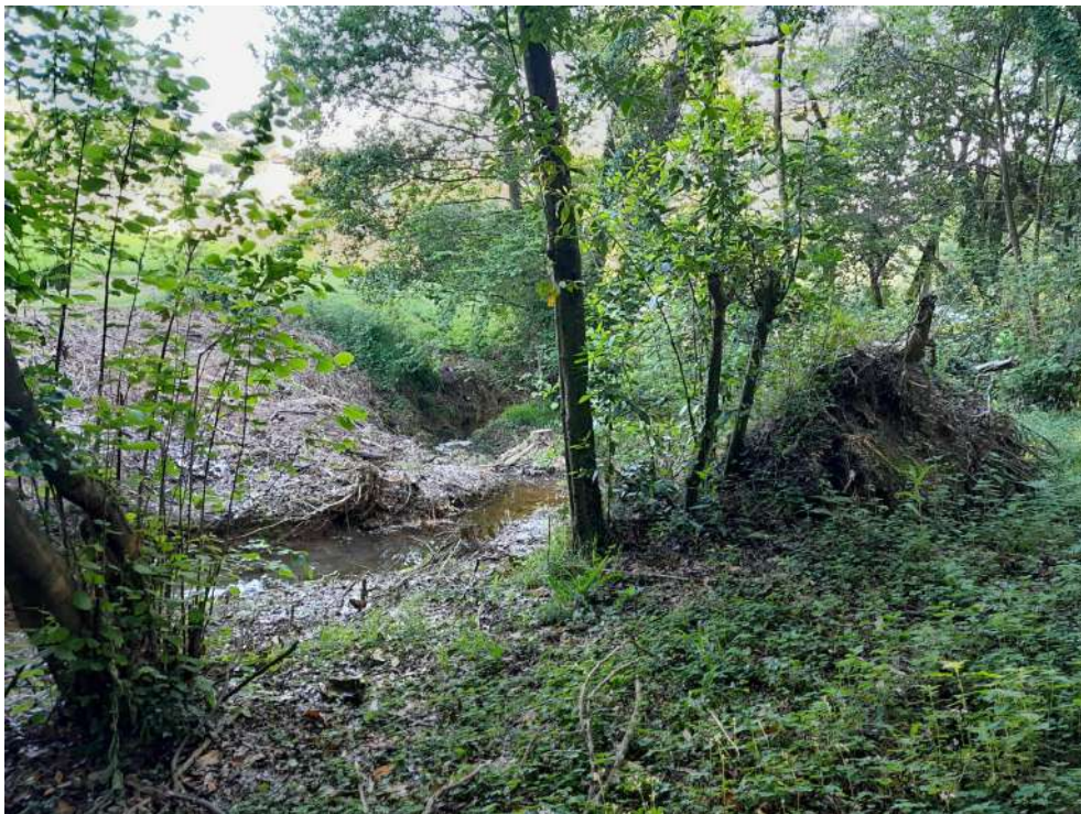
Situación después de los trabajos en Beloño