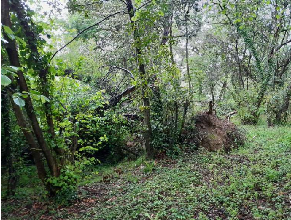
Situación antes de los trabajos en Beloño