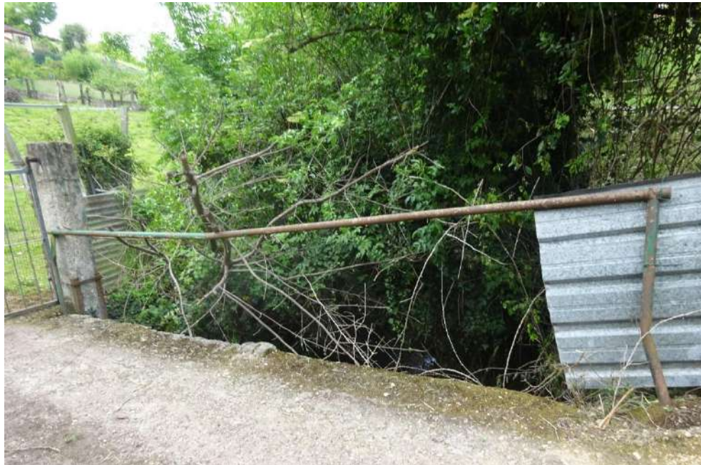
Situación antes los trabajos en el Veranes en Sotiello