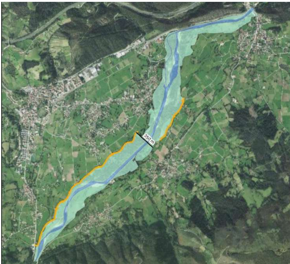
Espacio fluvial público delimitado

Este proyecto, junto con las actuaciones que viene desarrollando el Gobierno de Cantabria en las zonas urbanas, contribuirá a reducir muy significativamente el riesgo de inundación de las zonas habitadas de Cabezón de la Sal y Mazcuerras.