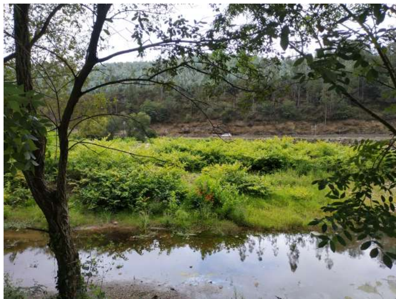
Estado actual del cauce del río Saja