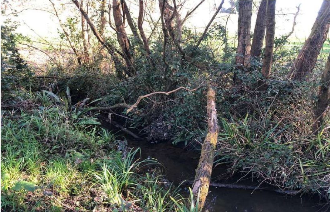
Desarrollo de los trabajos sobre la vegetación de las márgenes