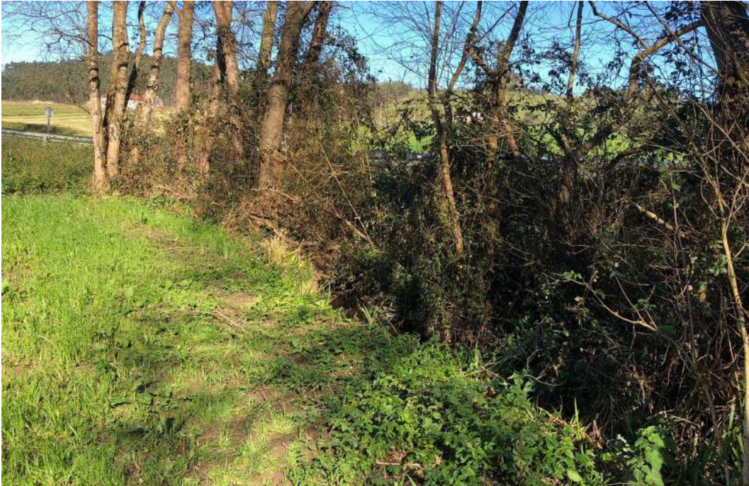
Arroyo de Budores antes de la actuación