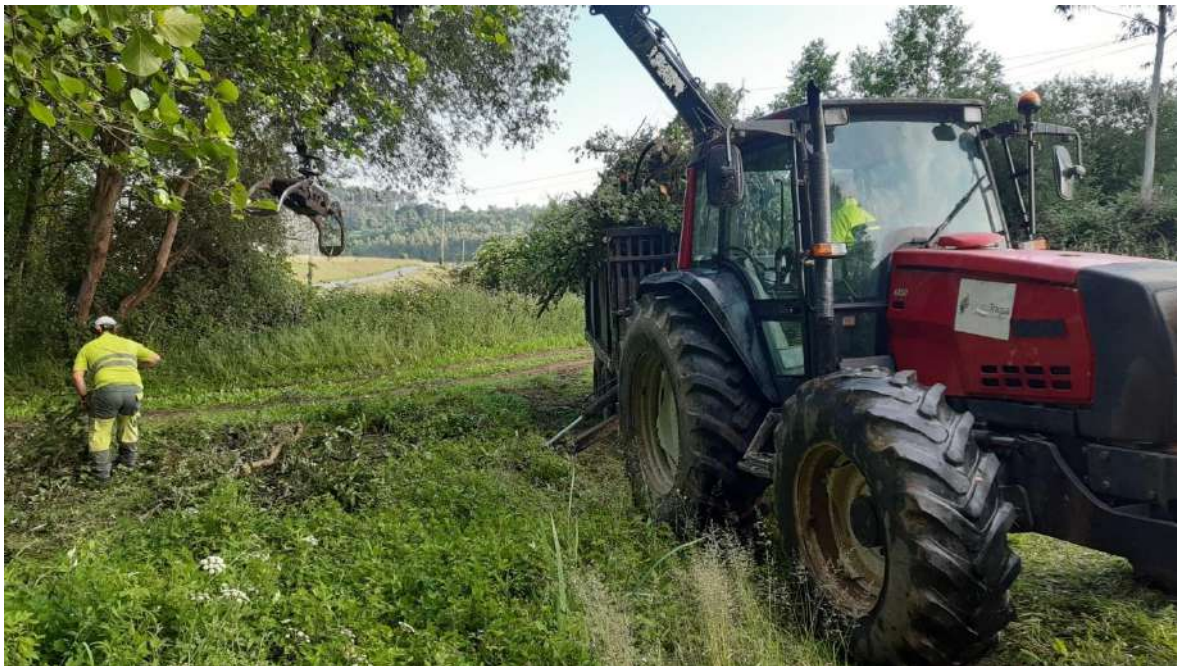
Retirada de los restos vegetales extraídos del cauce