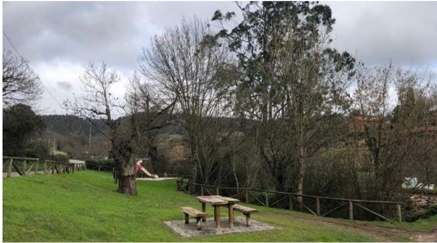
Zona de la actuación del arroyo El Castro