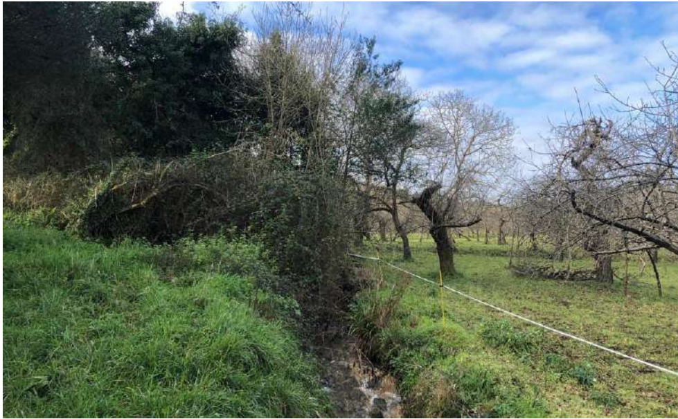
Zona de la Actuación en el arroyo Fuente del Noval