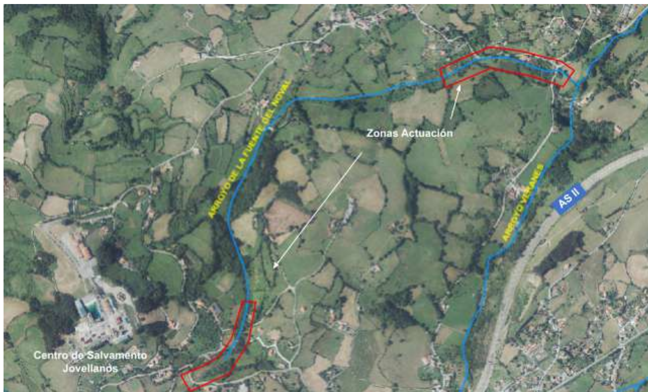
Ubicación de la actuación en el arroyo de la Fuente del Noval