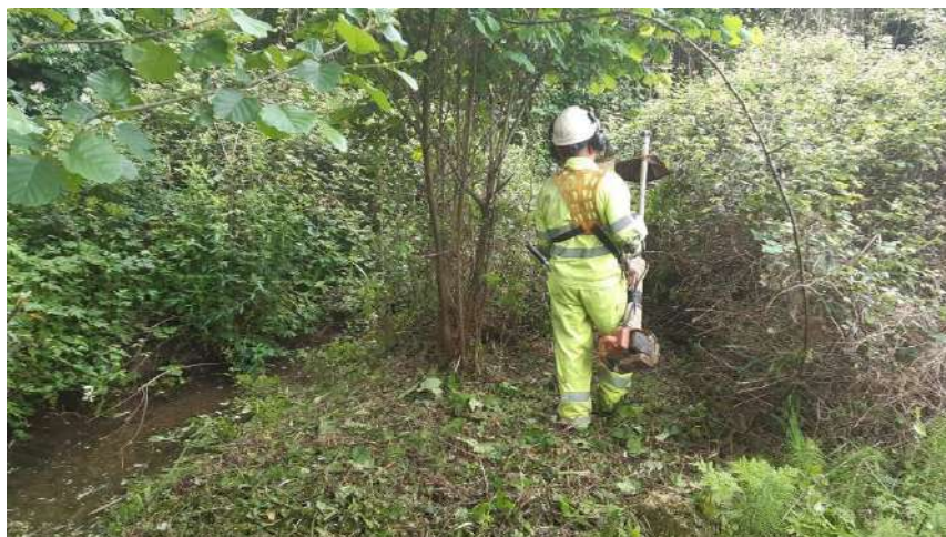
Inicio de los trabajos selvícolas