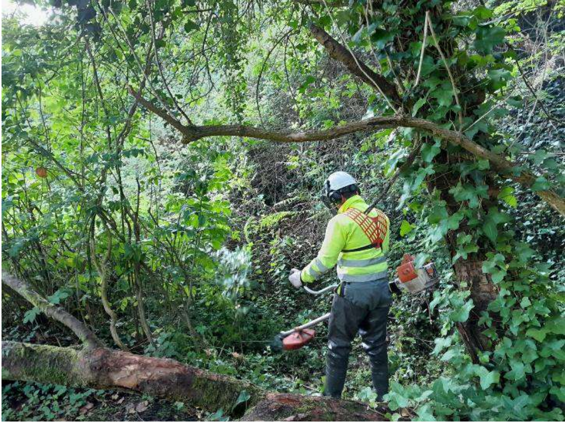
Trabajos de preparación de accesos para la extracción de los árboles caídos