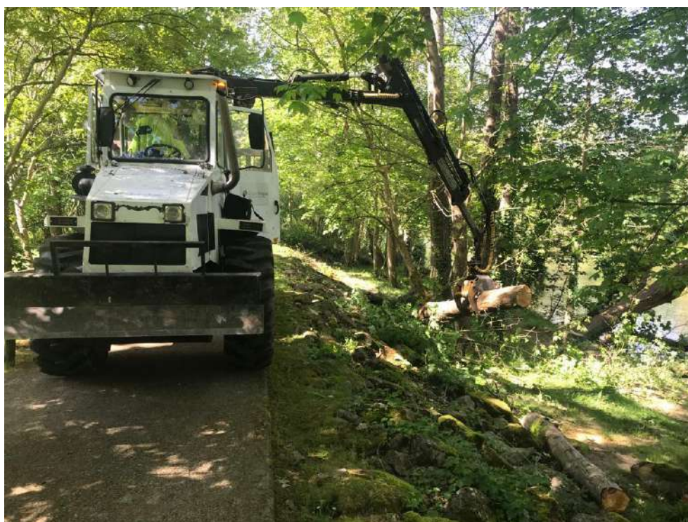
Retirada de restos vegetales