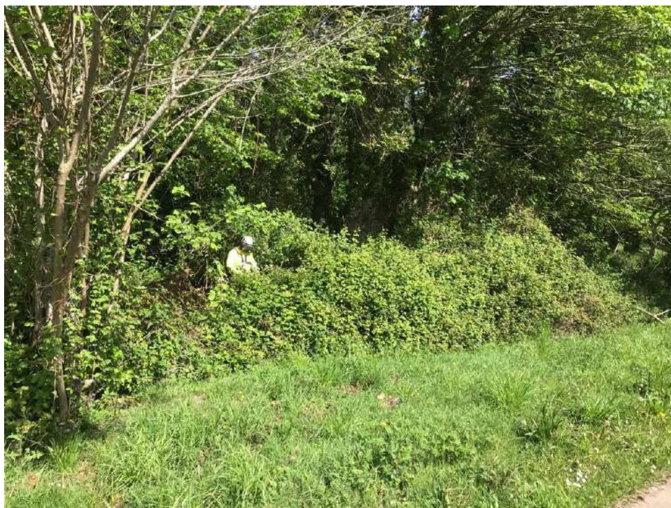
Trabajos de adecuación de la vegetación del cauce