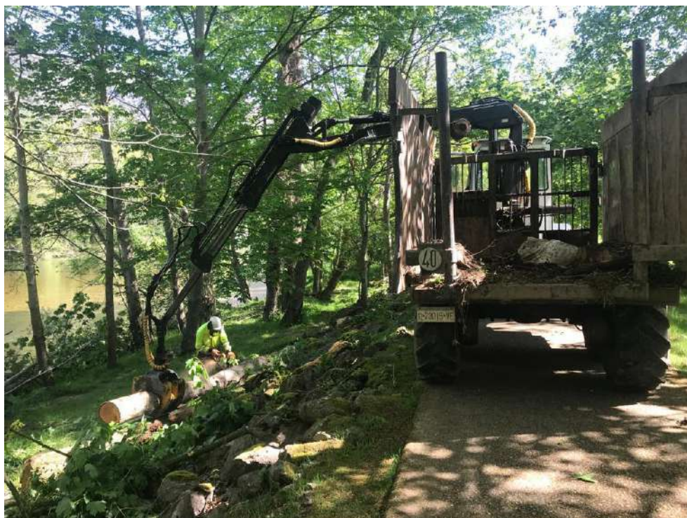
Trabajos de retirada de restos vegetales