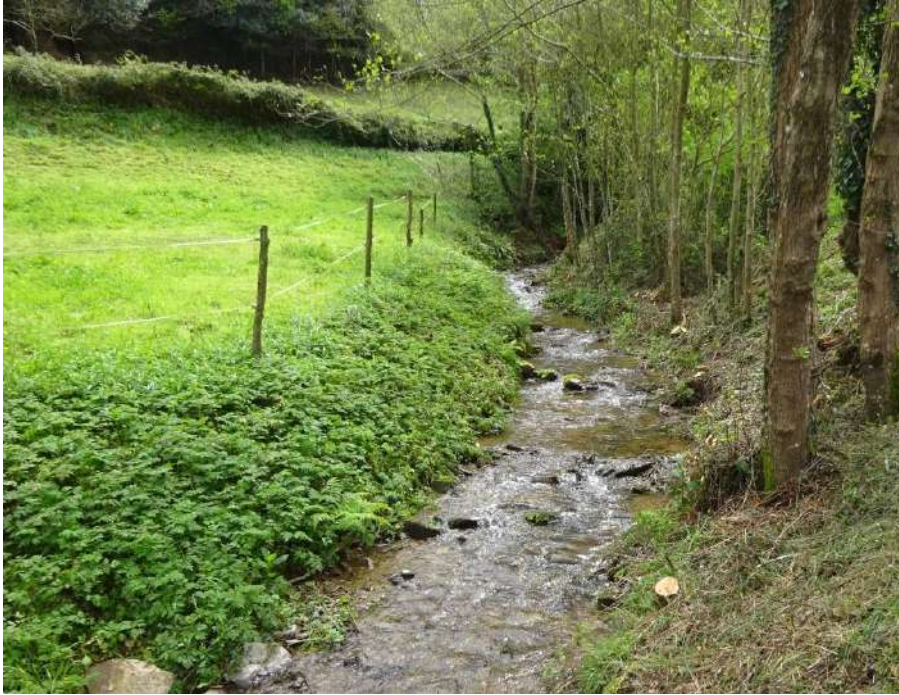
Detalle de situación del río Ouría tras la actuación