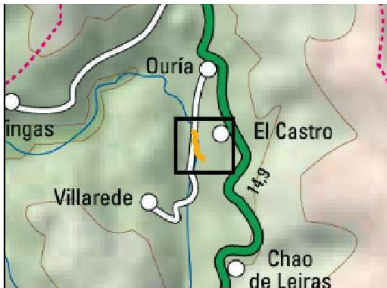
Ubicación de la actuación en el río Ouria en Castro de Ouria