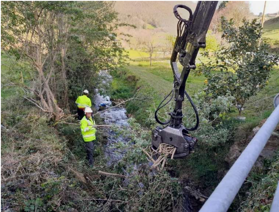
Labores de extracción de restos vegetales del cauce