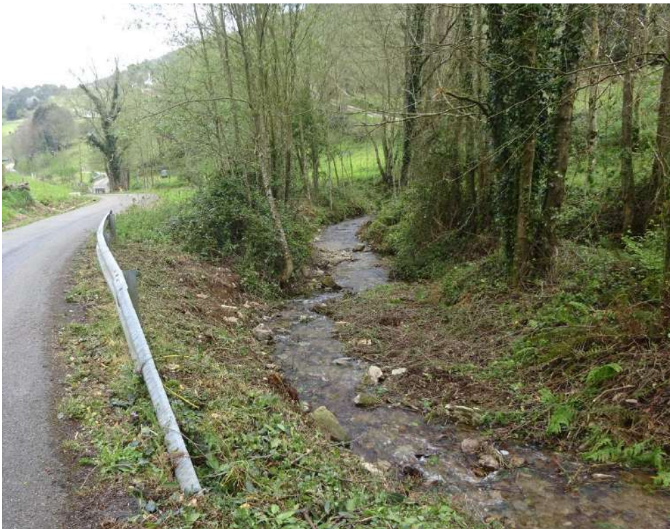
Detalle de situación del río Ouria tras la actuación