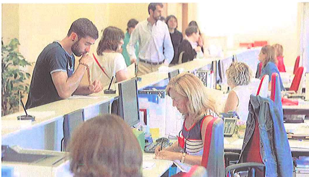
La sección de Alumnos de la Escuela Politécnica de Gijón a tope, con los estudiantes haciendo cola para formalizar la matrícula.