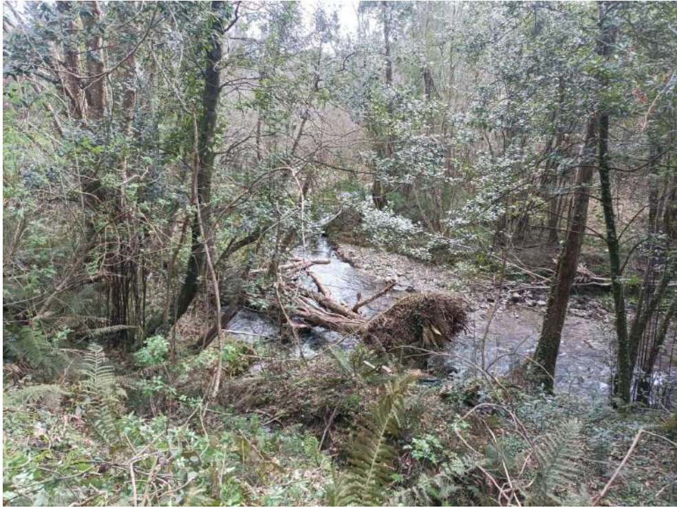
Situación del río Porcia antes de los trabajos