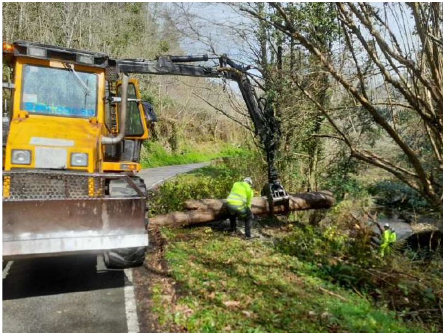
Proceso de extracción de árbol de grandes dimensiones del cauce