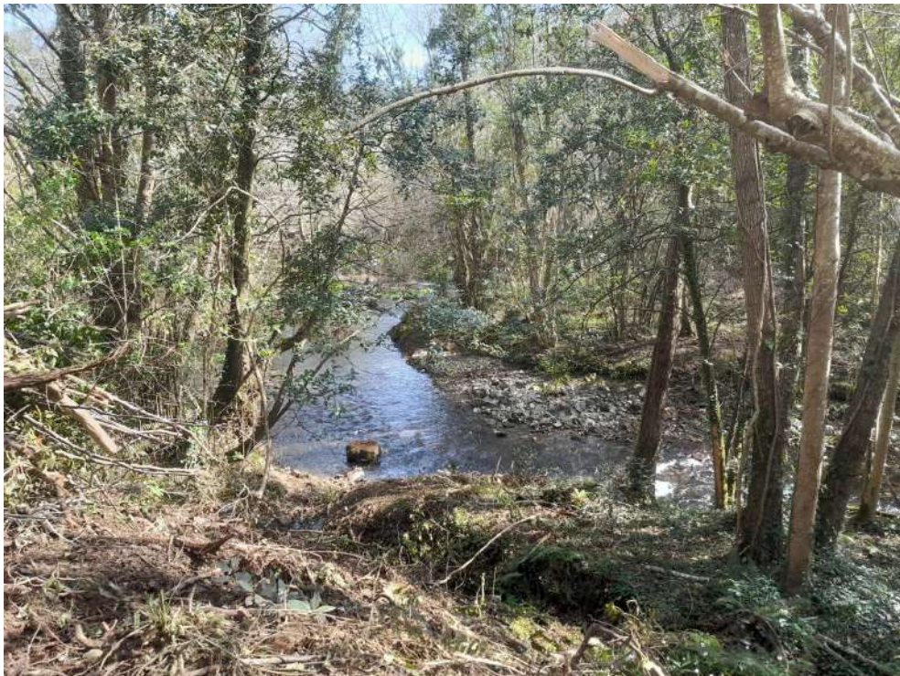
Situación del río Porcia después de los trabajos