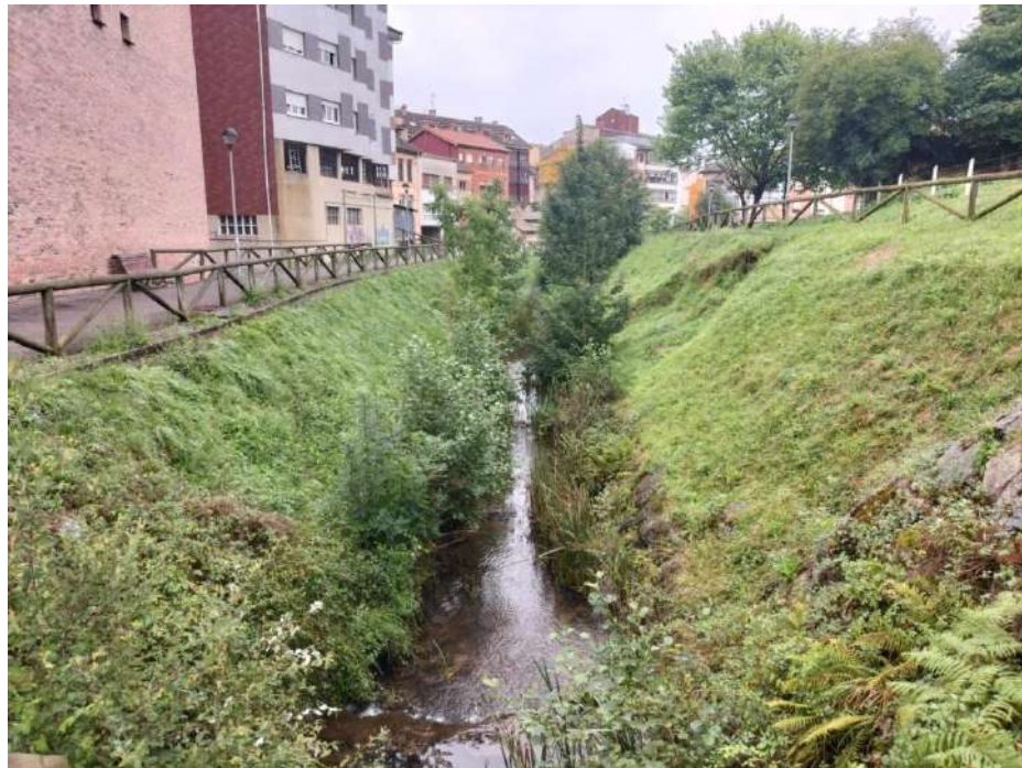
Estado actual del cauce del río Vio