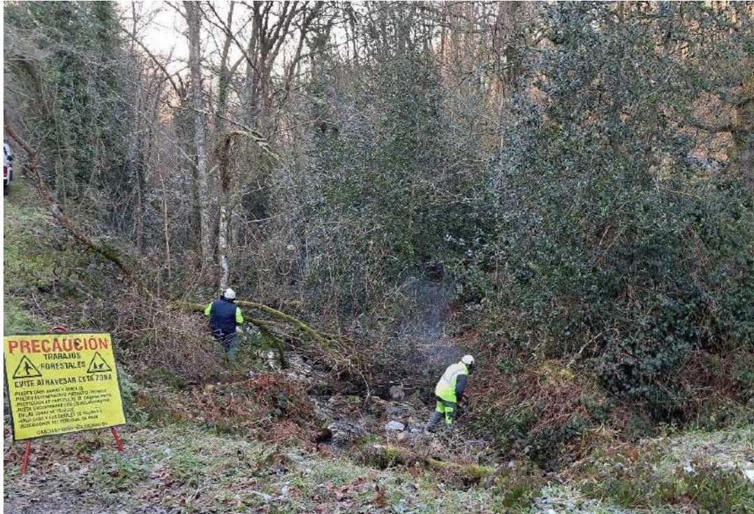
Trabajos en el cauce del rego de Palos