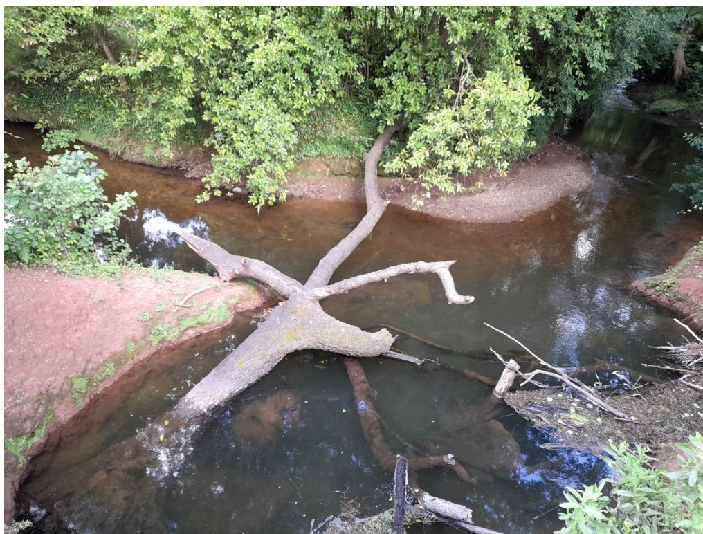
Restos vegetales en el río Piles