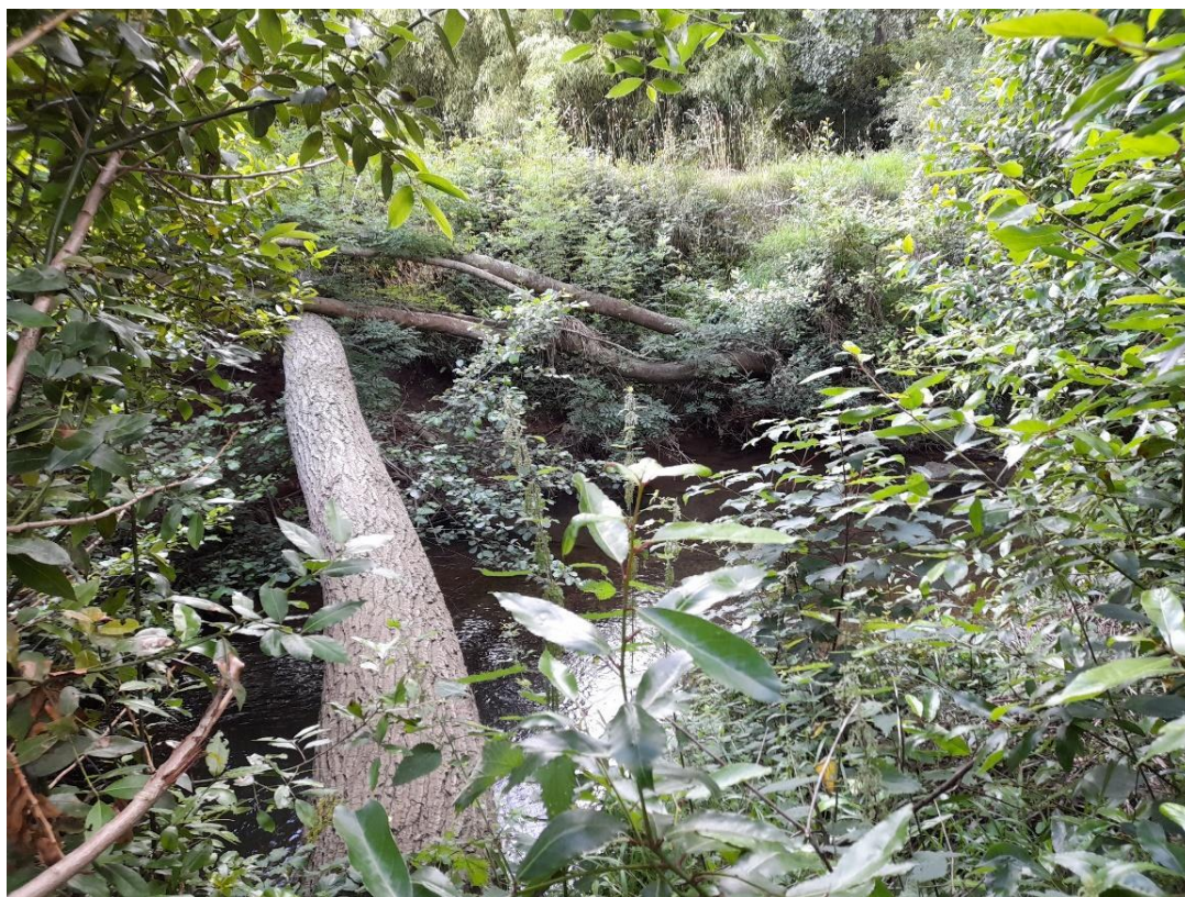
Árbol caído en el río Piles en la zona de la Senda Fluvial