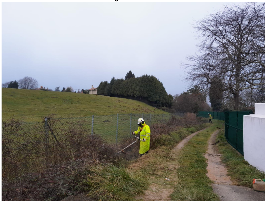
Actuación en el inicio del tramo del arroyo de Lloreda