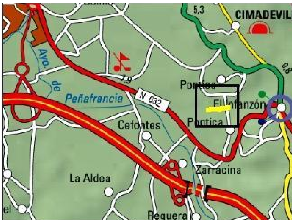
Localización de la actuación del arroyo Lloreda en la Pontica