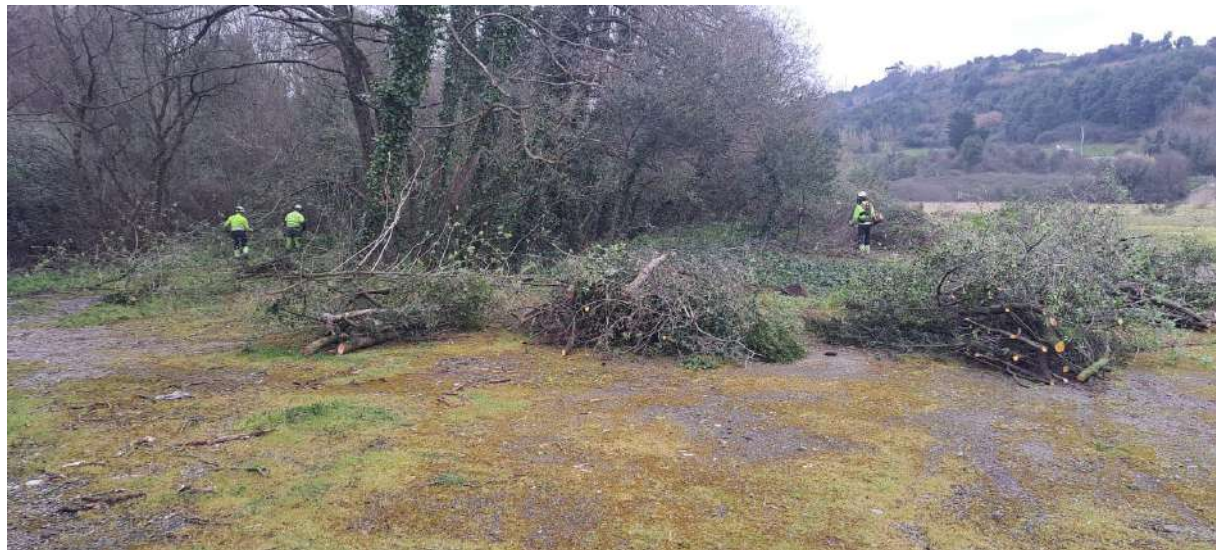
Restos de poda