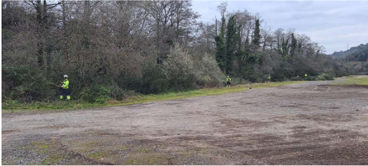
Trabajos sobre sobre la vegetación de ribera