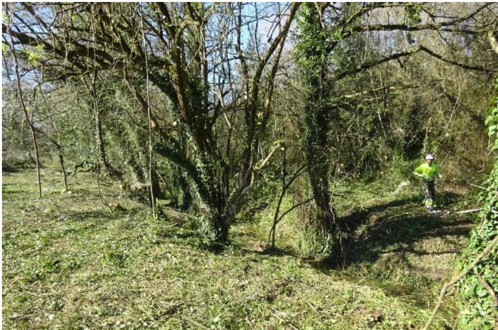
Tratamientos de la vegetación en el cauce