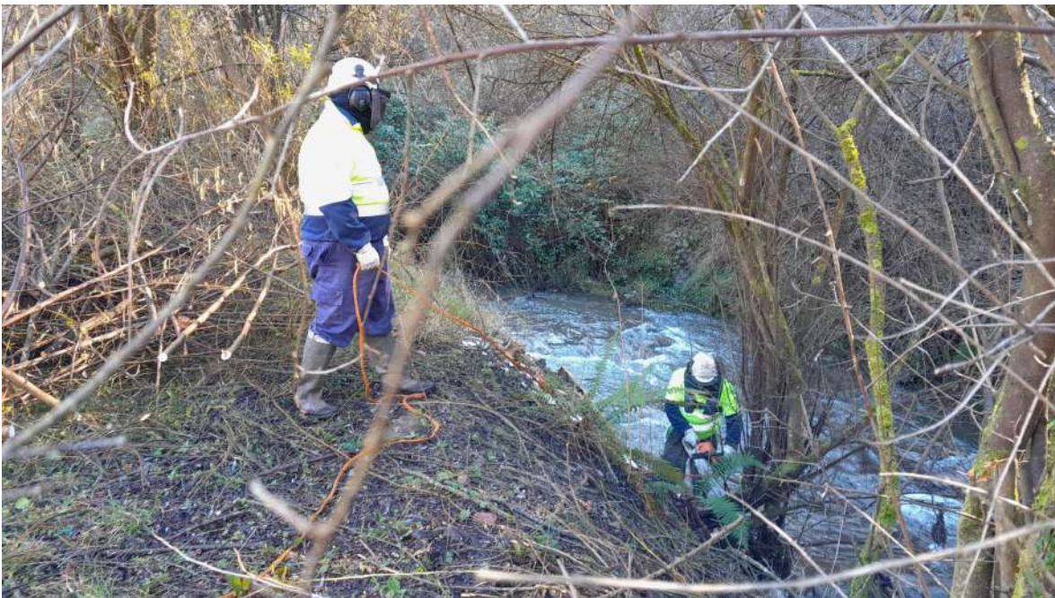
Trabajos sobre la vegetación de ribera del río San Juan