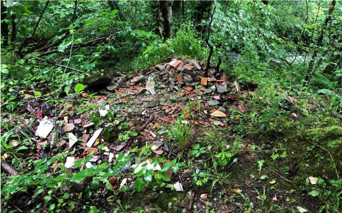
Vertedero ilegal en las inmediaciones del cauce del río San Juan