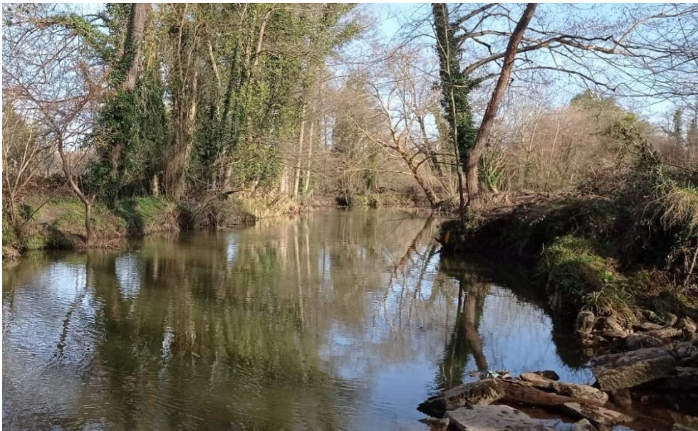
Actuación en el río Nora, Meres (2022). Después de la actuación.