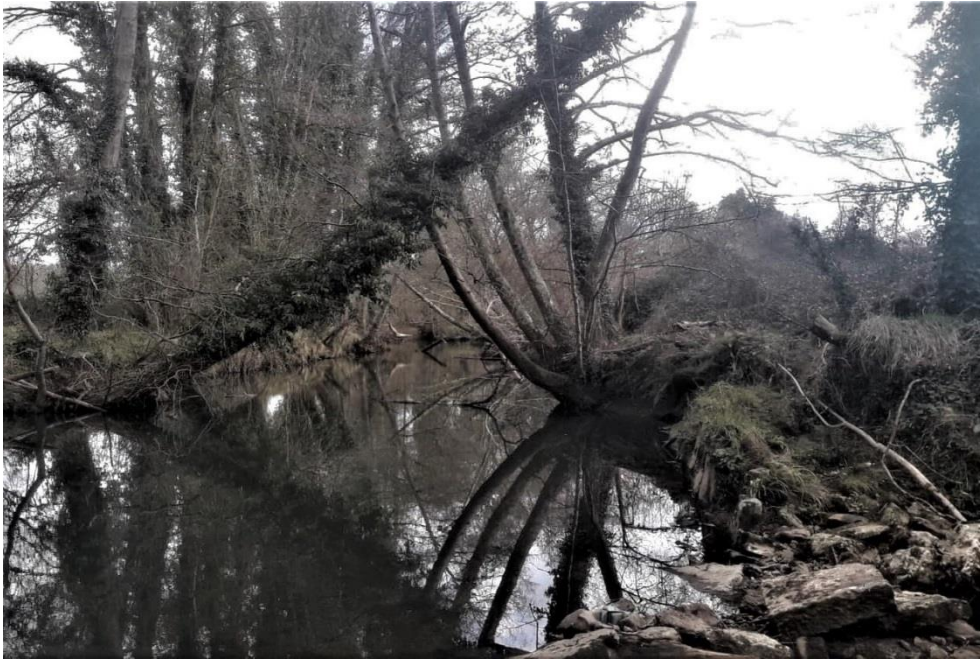
Actuación en el río Nora, Meres (2022). Antes de la actuación.