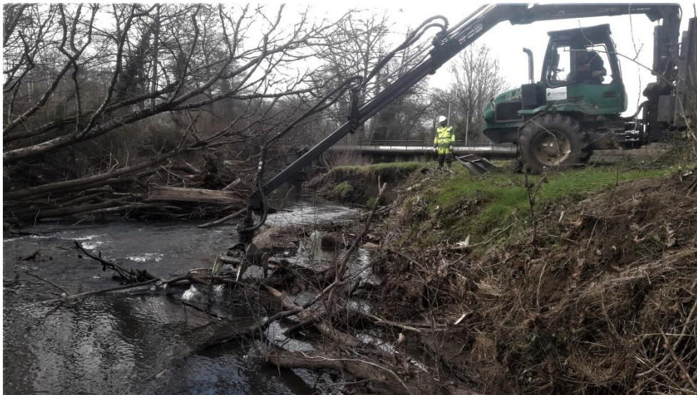
Actuación en el río Nora, Meres (2022). Ejecución de los trabajos.