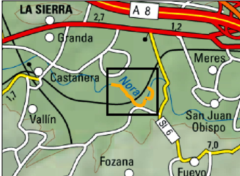
Actuación en el río Nora, Meres (2022). Localización.