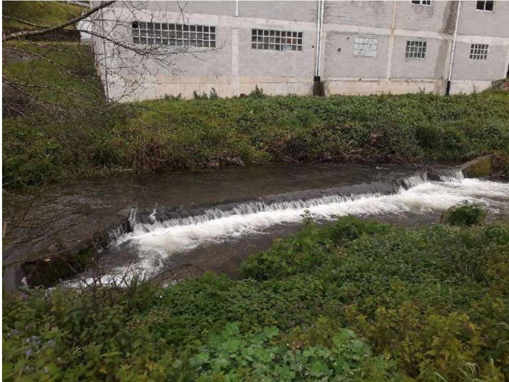
Rego de Riotorto en Vilameá antes de la actuación