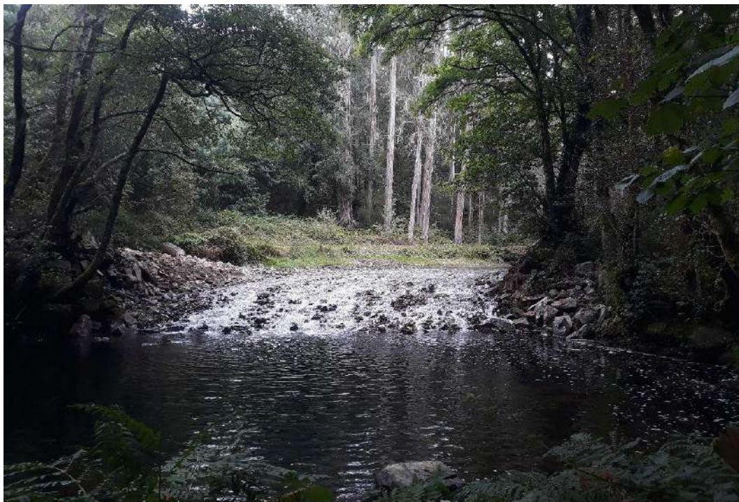
Río Eo en Baleira después de la actuación