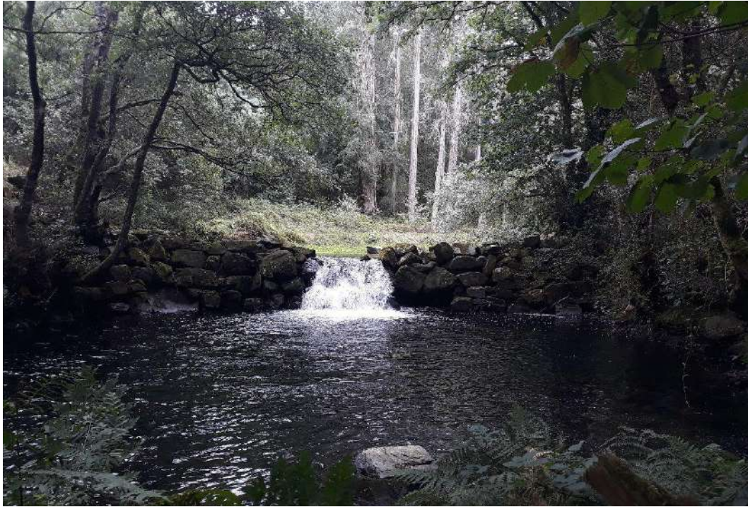
Río Eo en Baleira antes de la actuación