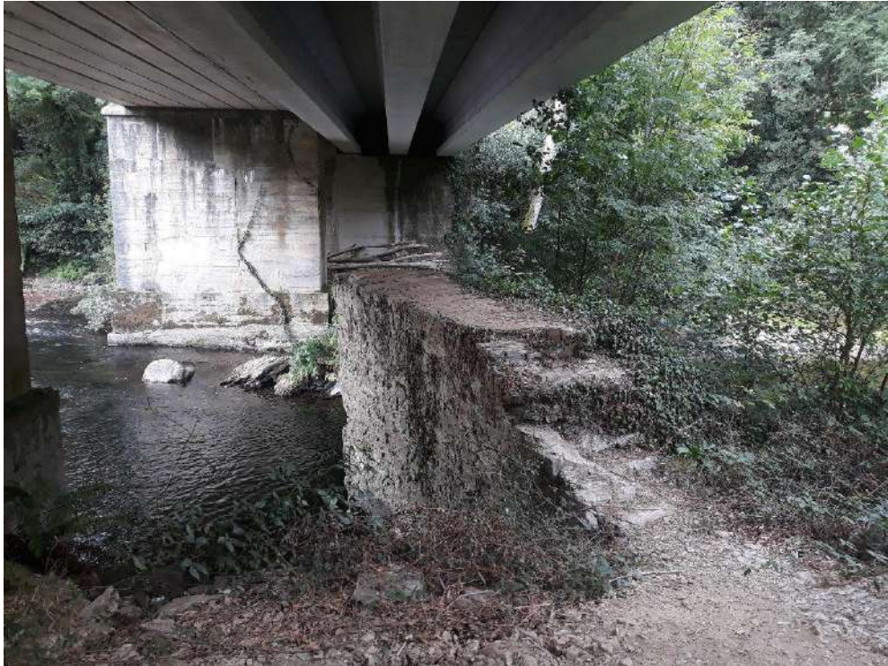
Río Eo en Ribeira de Piquín antes de la actuación