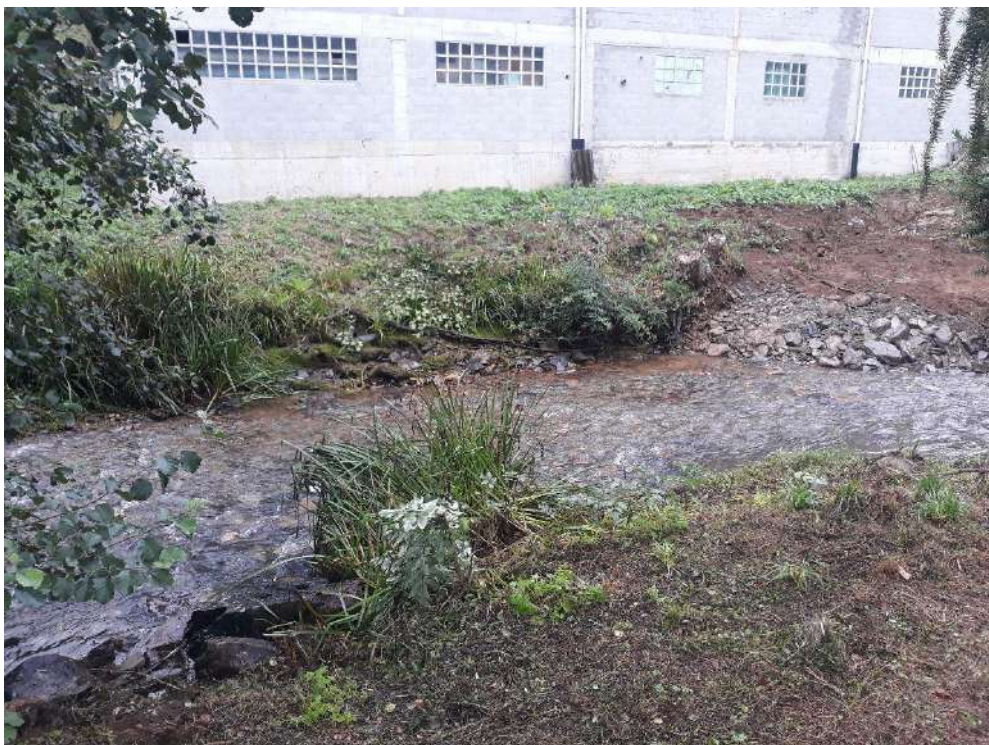
Rego de Riotorto en Vilameá después de la actuación