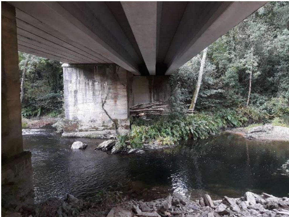
Río Eo en Ribeira de Piquín después de la actuación