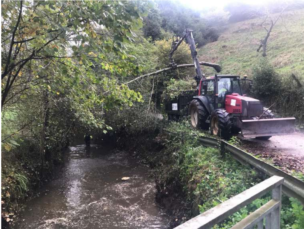
Extracción de restos vegetales del cauce