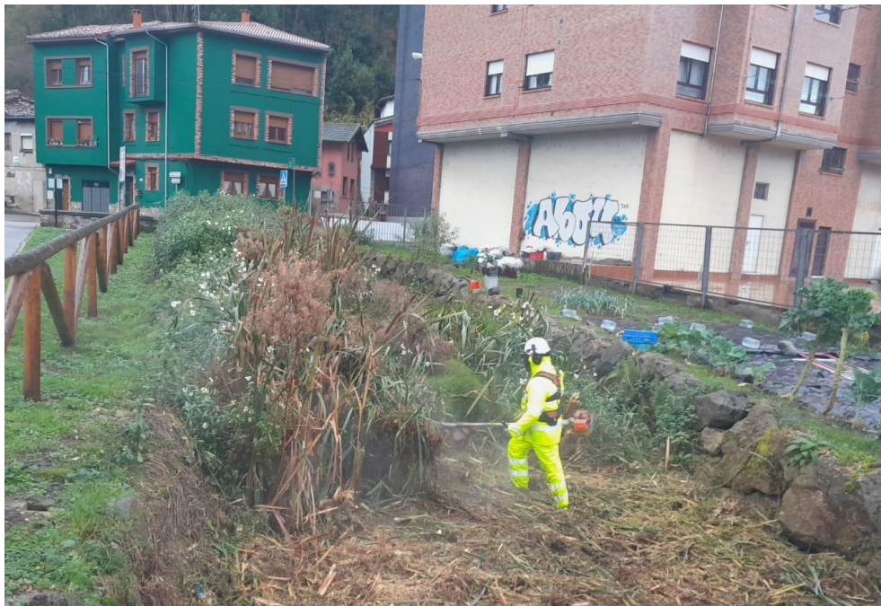
Operarios trabajando en el río San Juan