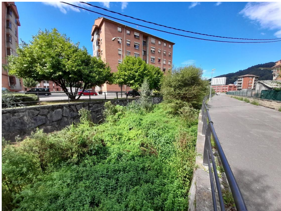
Cauce del río San Juan antes de la actuación