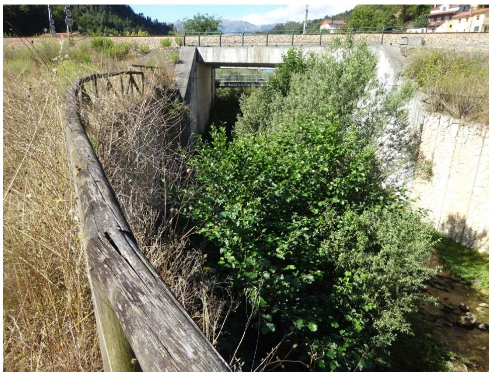
Río Valdecuna antes de la actuación