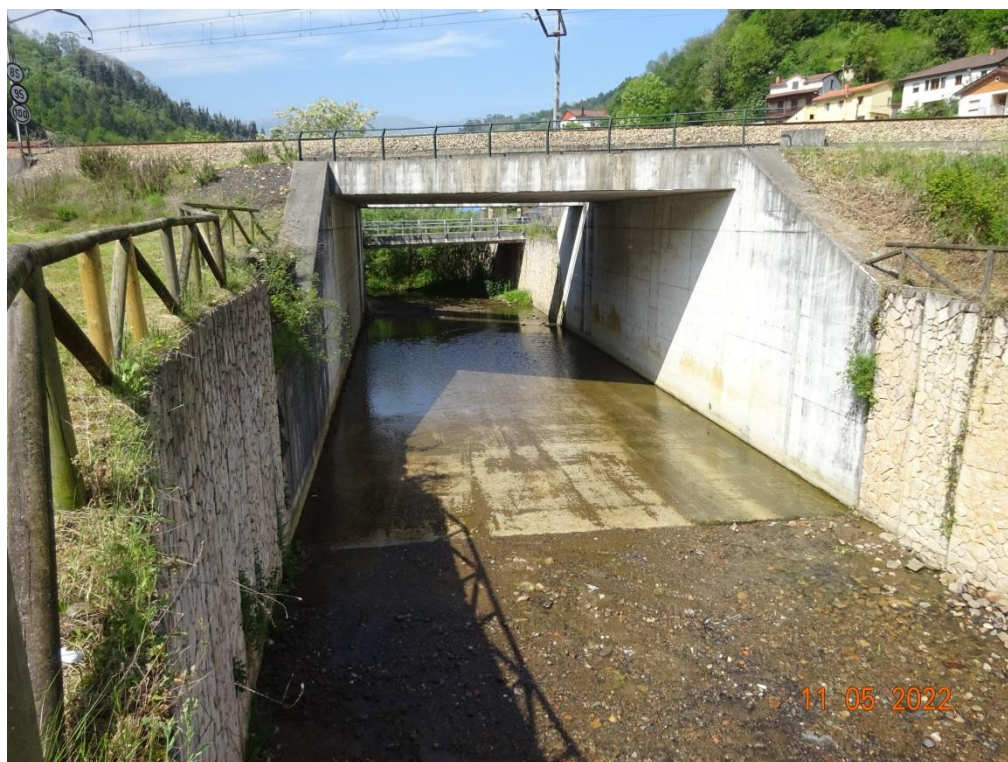
Río Valdecuna después de la actuación