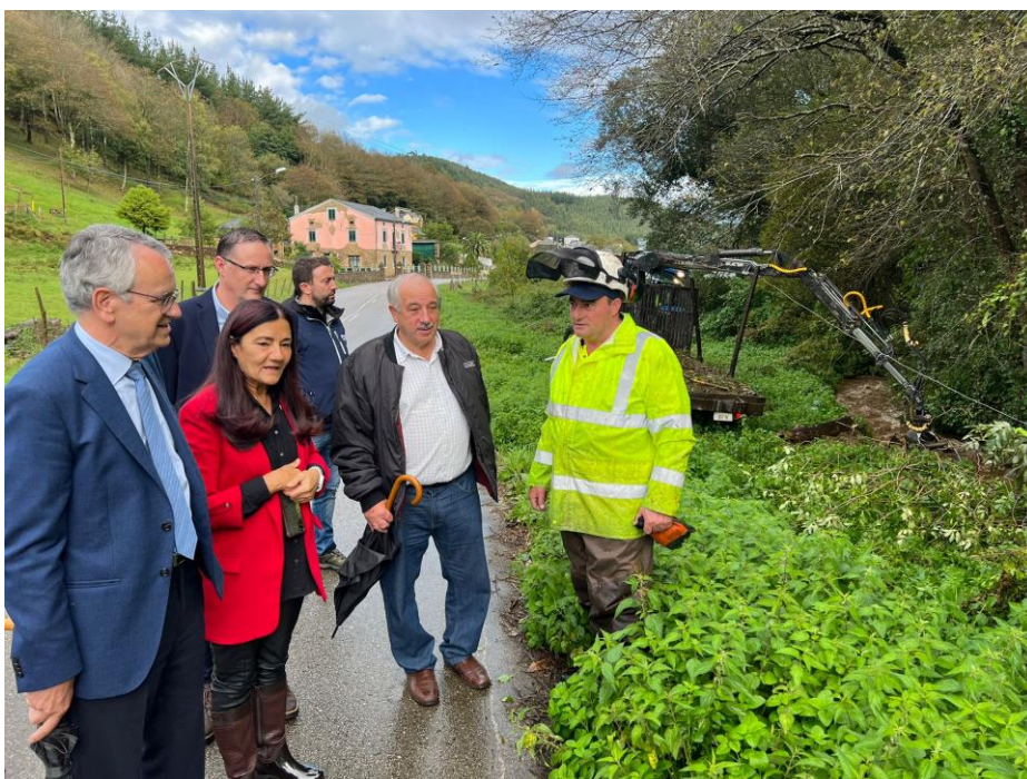
Visita a la zona de actuación