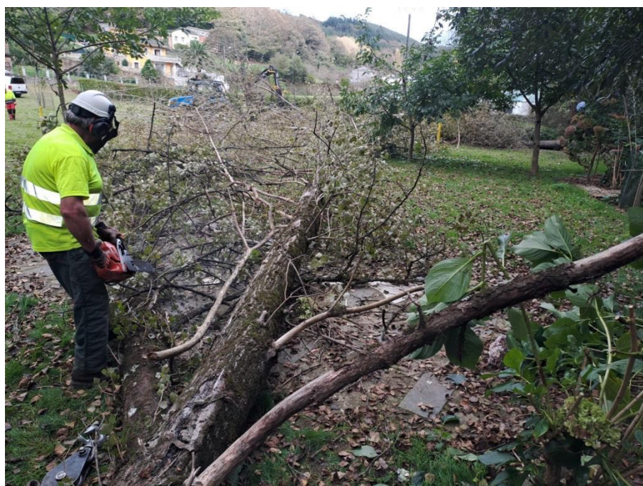
Operario cortando un árbol seco caído