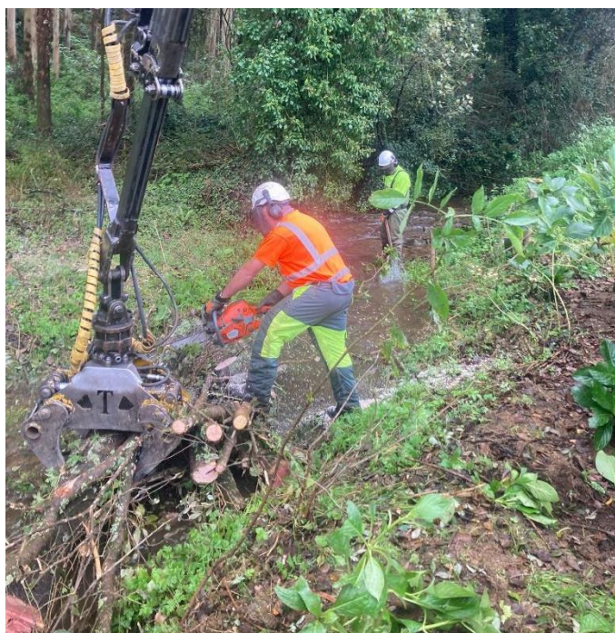
Operario cortando madera para cargarla dentro del autocargador