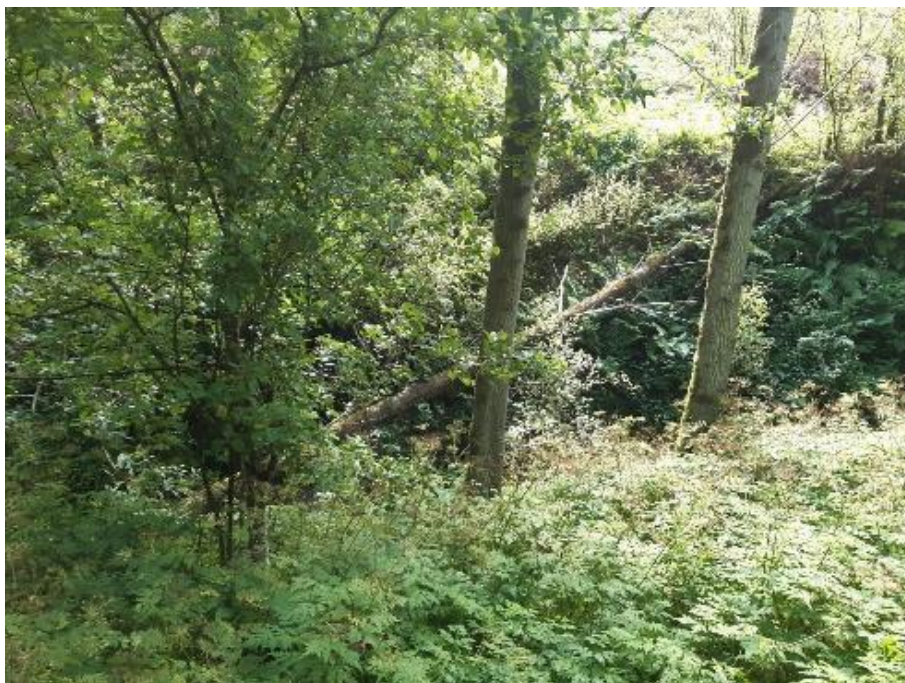
Antes de la actuación