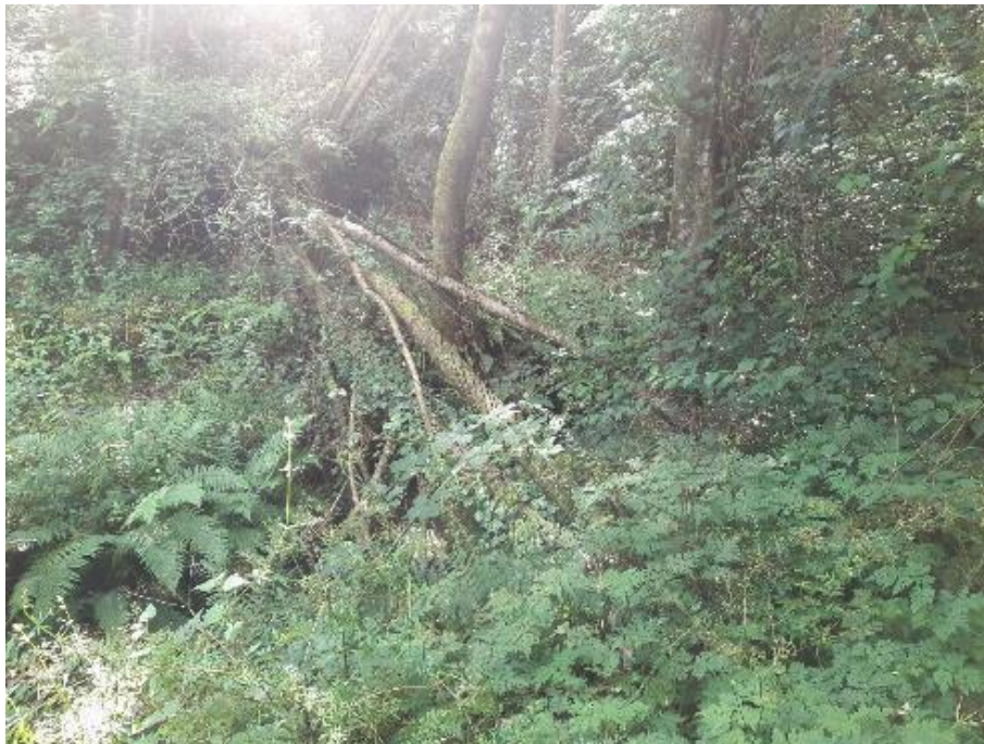
Antes de la actuación