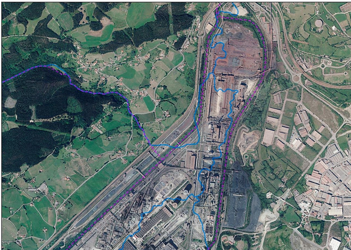
Ortofoto actual de la confluencia de los ríos Aboño y Pinzales, donde se marcan en azul los cauces en 1957 y en rosa la disposición de la traza actual de los cauces