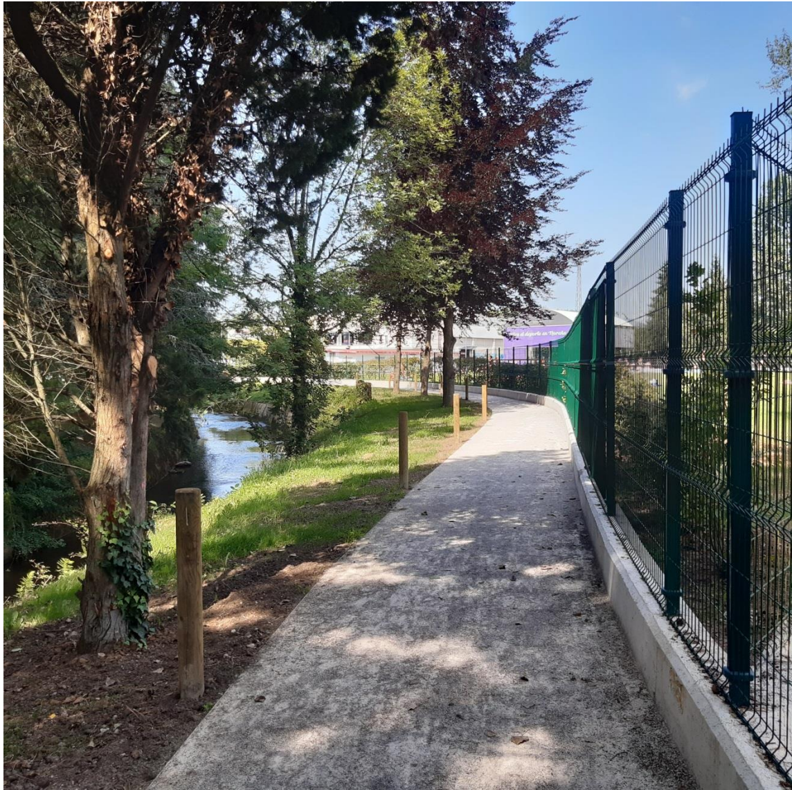
Vista de senda desde aguas abajo