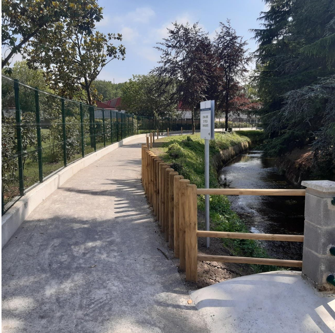
Vista de senda desde aguas arriba