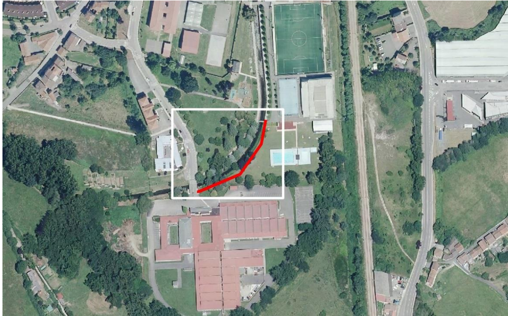
Zona de la actuación