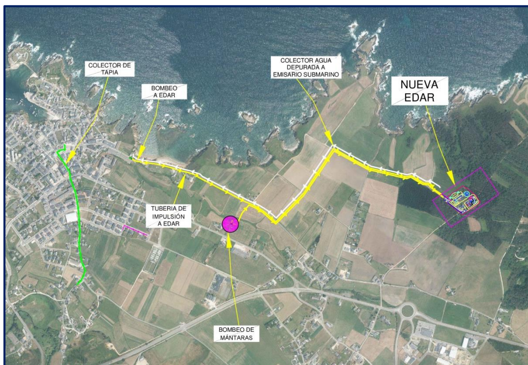
Planta general de la actuación proyectada

El proyecto estará en información pública durante 20 días hábiles desde la publicación del anuncio en el Boletín Oficial del Estado y del Principado de Asturias y podrá consultarse en las oficinas de CHCantábrico en La Fresneda, Siero, en las dependencias del Ayuntamiento de Tapia y en la página web de CHCantábrico: Anuncios y notificaciones - WebCHC (chcantabrico.es)