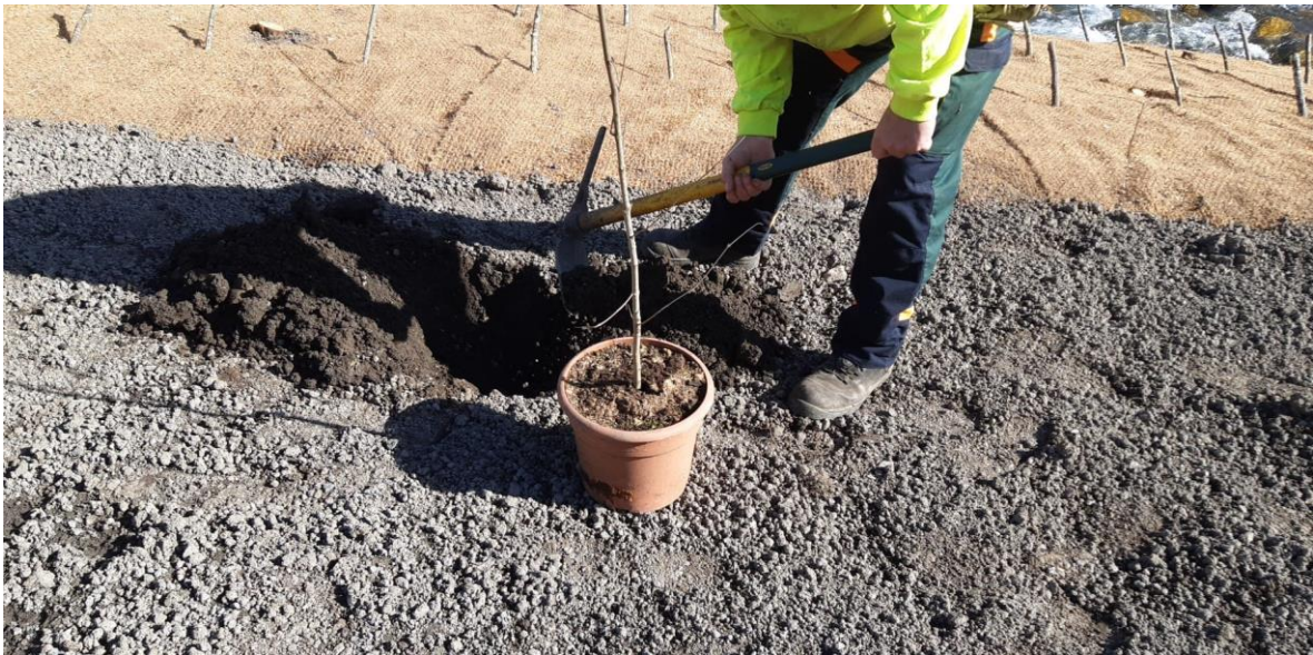
Operarios ejecutando trabajos de plantación