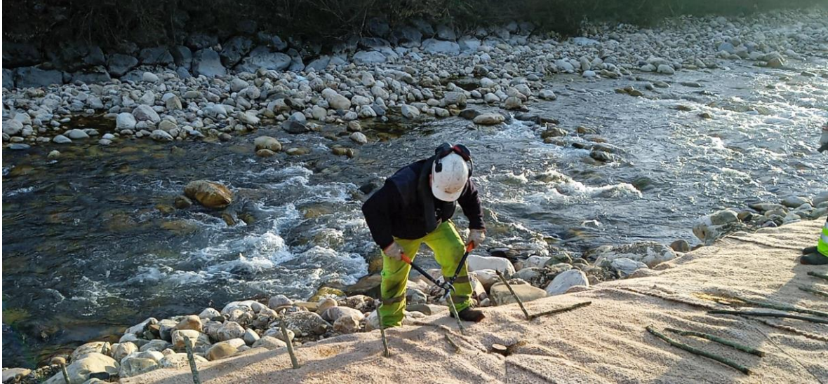
Operario ejecutando trabajos de bioingeniería