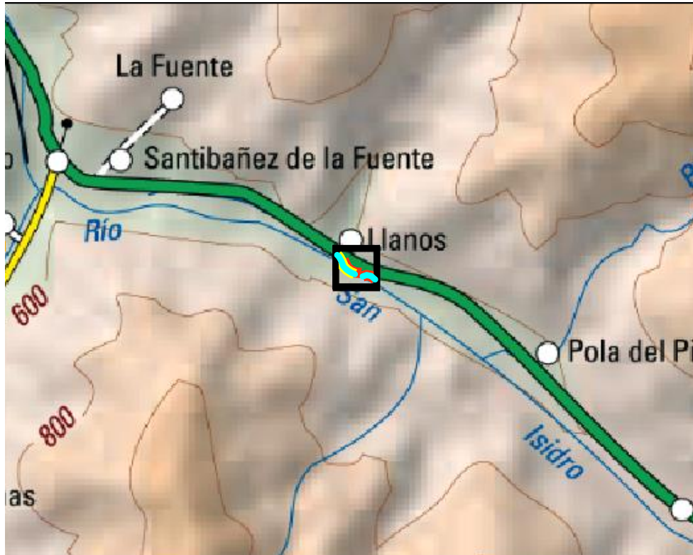
Localización de la actuación en el río San Isidro en Llanos