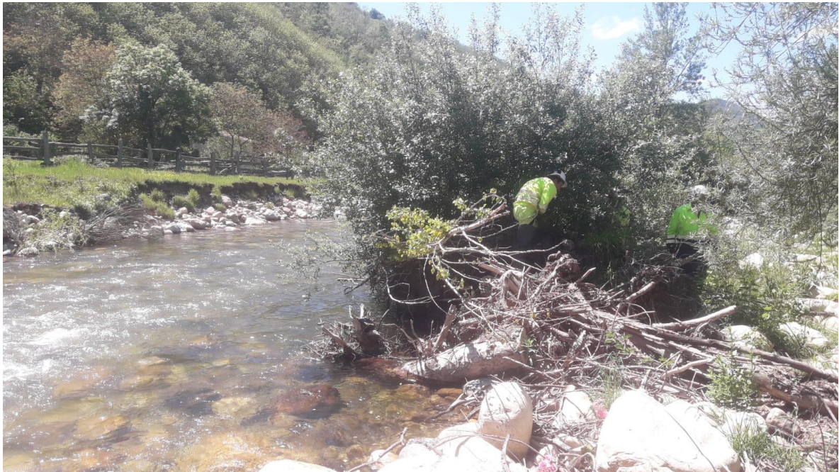
Antes de la actuación en el río San isidro en Llanos