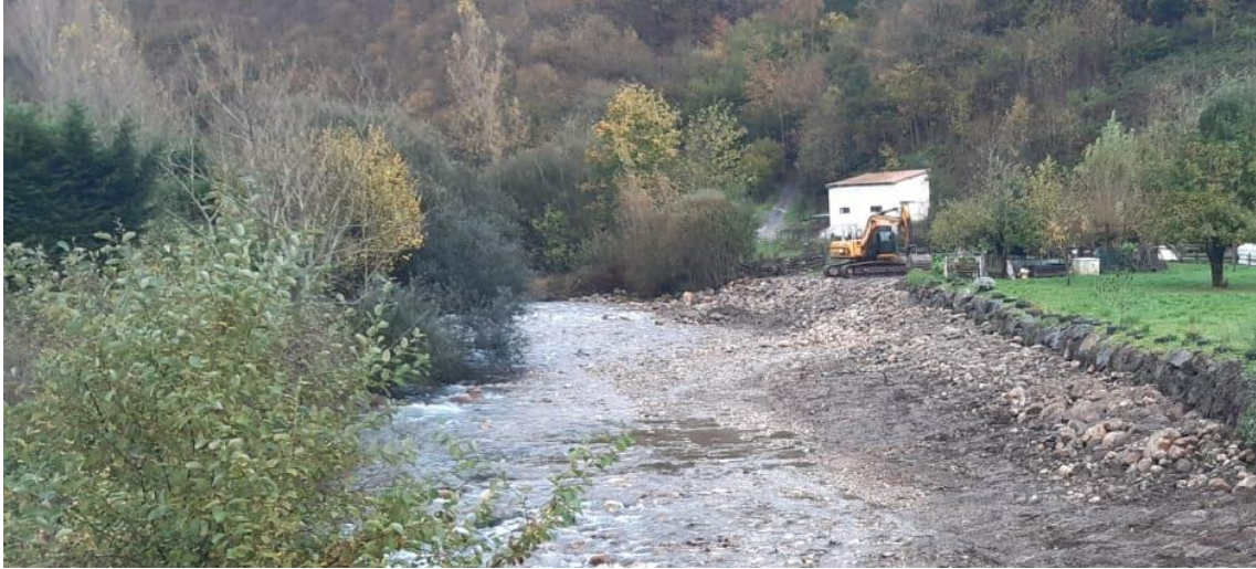
Retro excavadora recolocando acarrees acumulados en margen erosionada