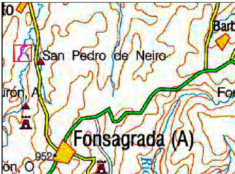
Localización de la actuación en el río Da Proba en San Pedro del Río