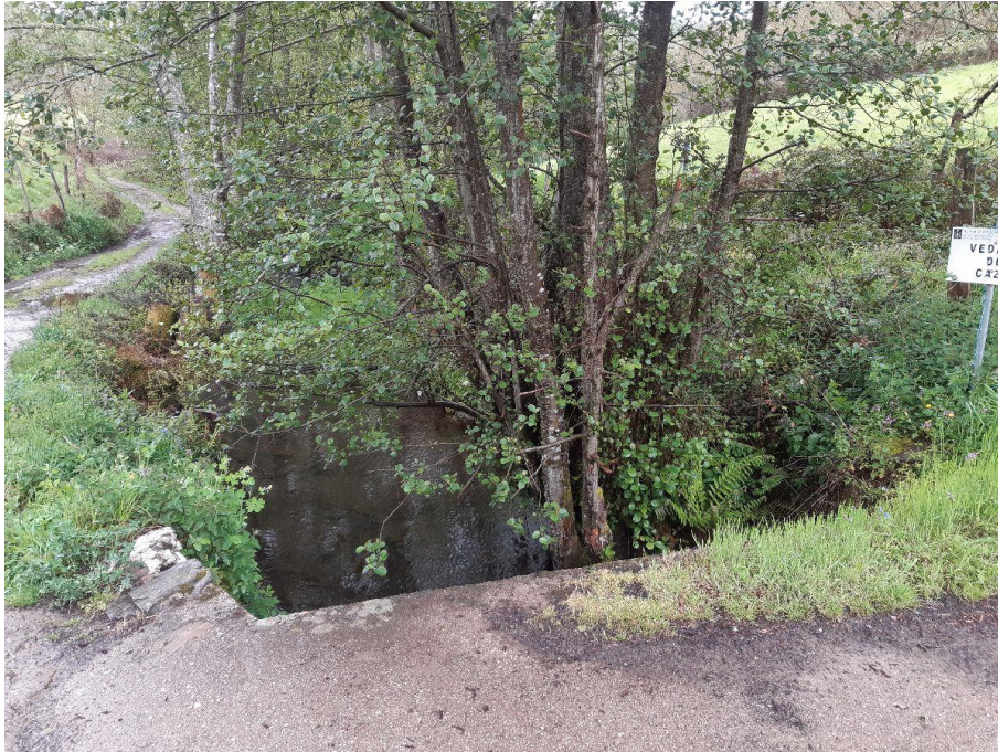
Antes de la actuación en el río Da Proba en San Pedro del Río