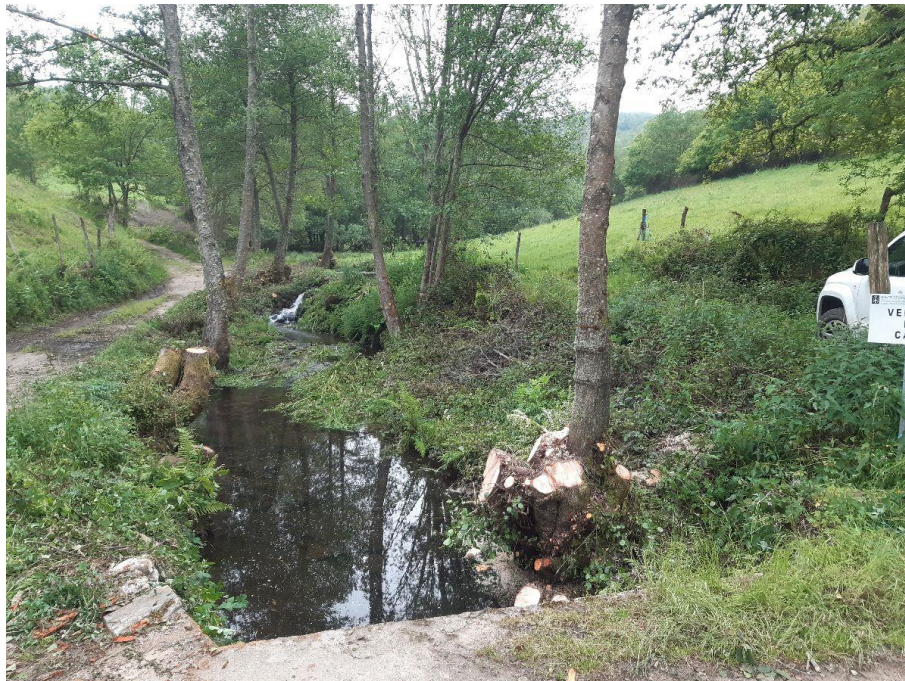
Después de la actuación en el río Da Proba en San Pedro del Río