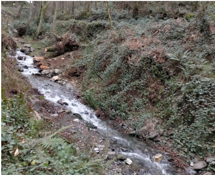
Después de la actuación en rego Acevedo en Barcela