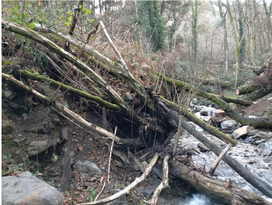
Antes de la actuación en rego Acevedo en Barcela