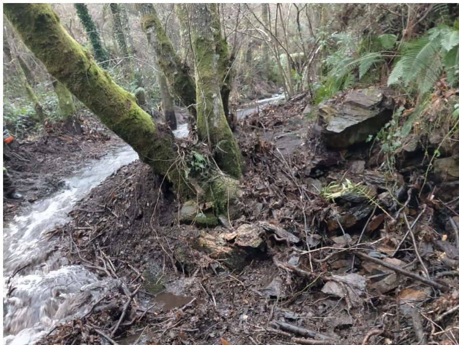
Después de la actuación en el rego de Covas en Santalla