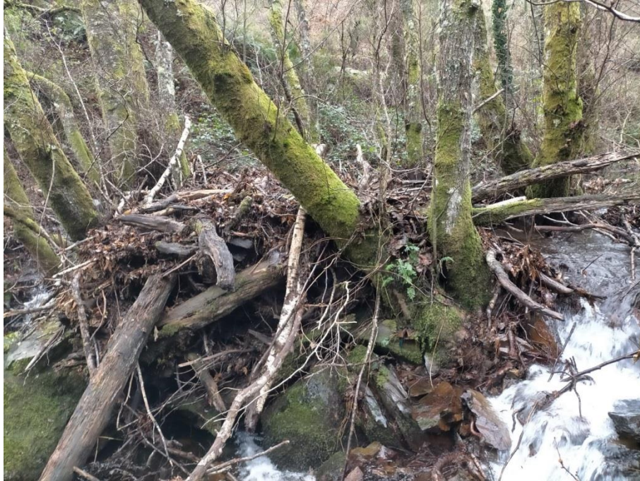
Antes de la actuación en el rego de Covas en Santalla