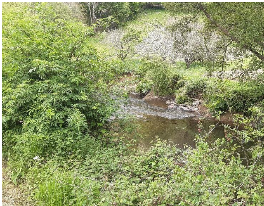
Después de la actuación en el río Eo en Santalla