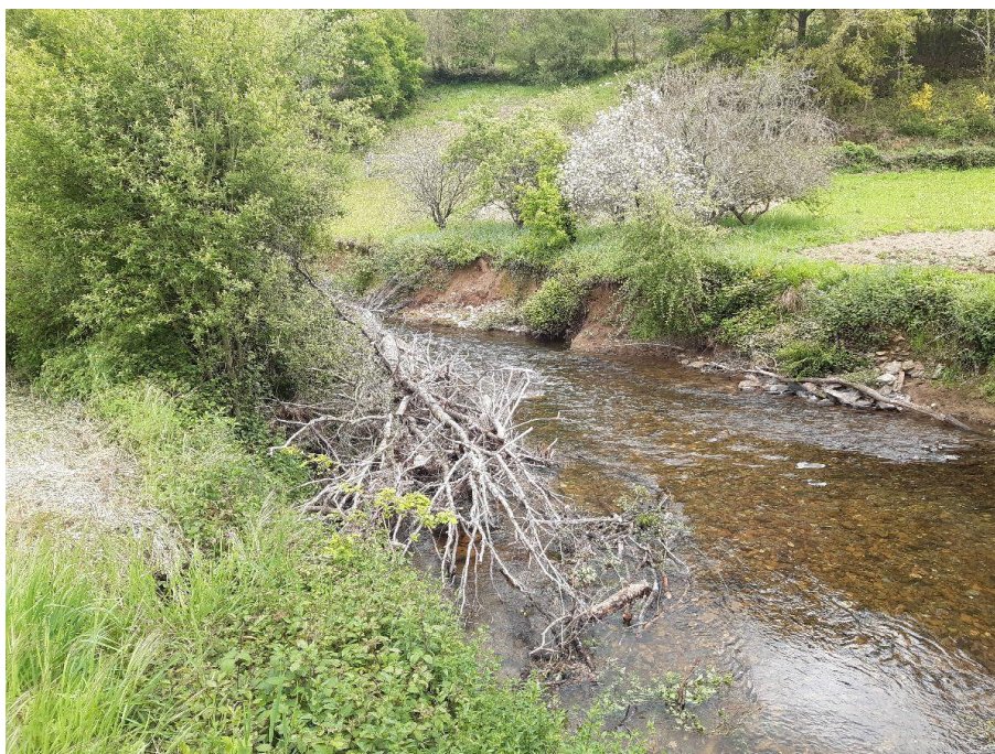
Antes de la actuación en el río Eo en Santalla