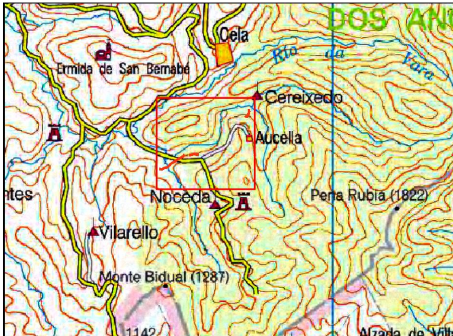
Localización de la actuación en el río Cereixedo en Veiga