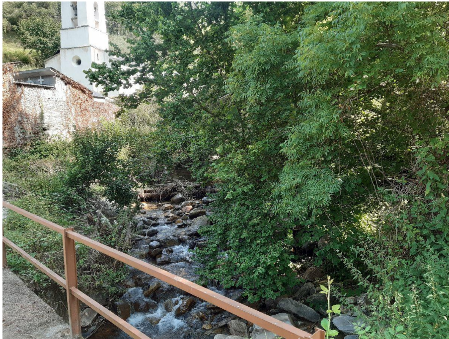
Antes de la actuación en el río Cereixedo en Veiga