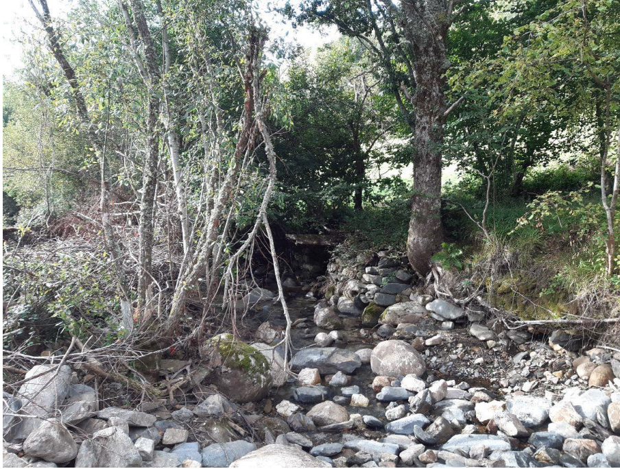
Antes de la actuación en el río Do Mazo en O Mazo