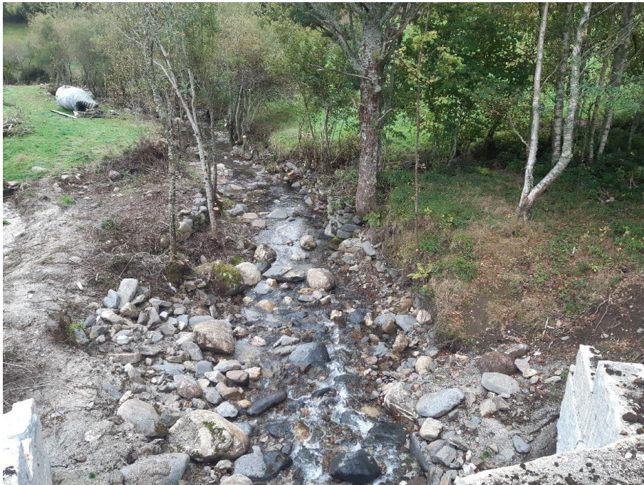
Después de la actuación en el río Do Mazo en O Mazo