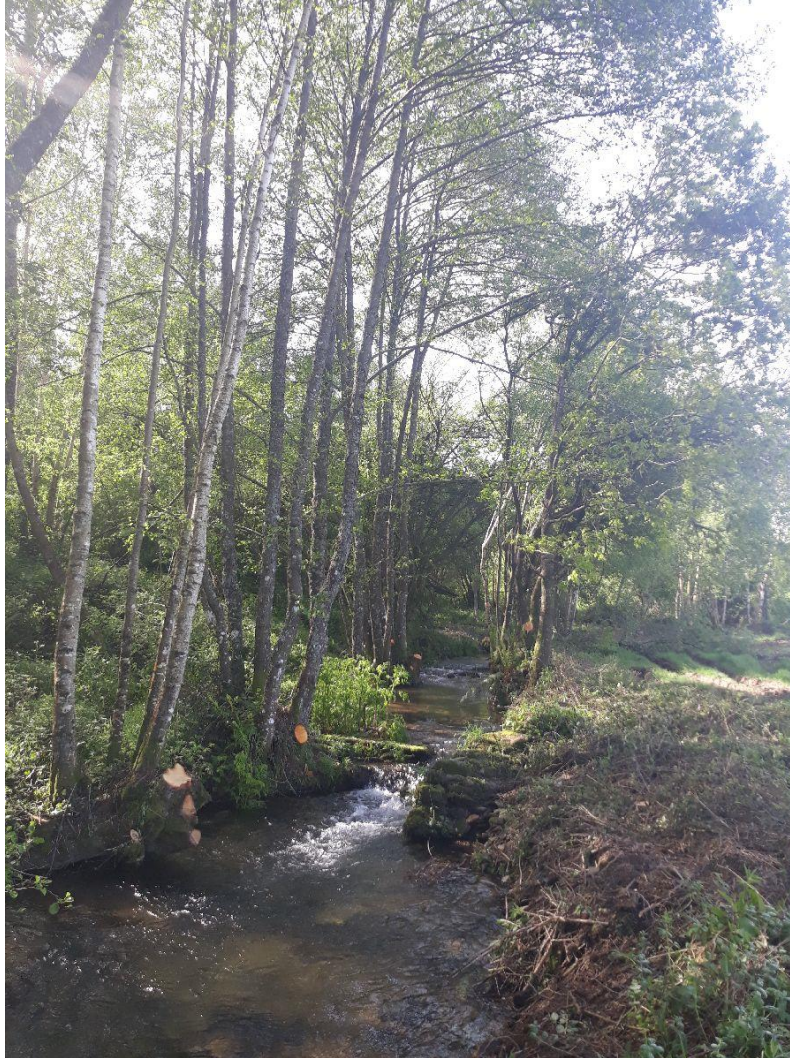
Después de la actuación en el rego de Mosqueiros en Fonteó