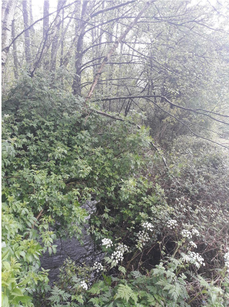
Antes de la actuación en el rego de Mosqueiros en Fonteo