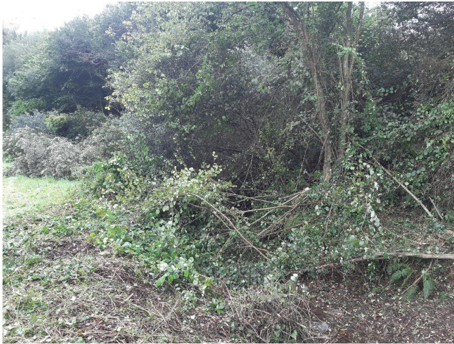
Antes de la actuación en el río Portobragán en Villamartín