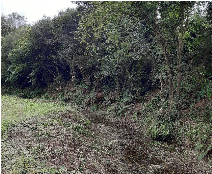
Después de la actuación en el río Portobragán en Villamartín