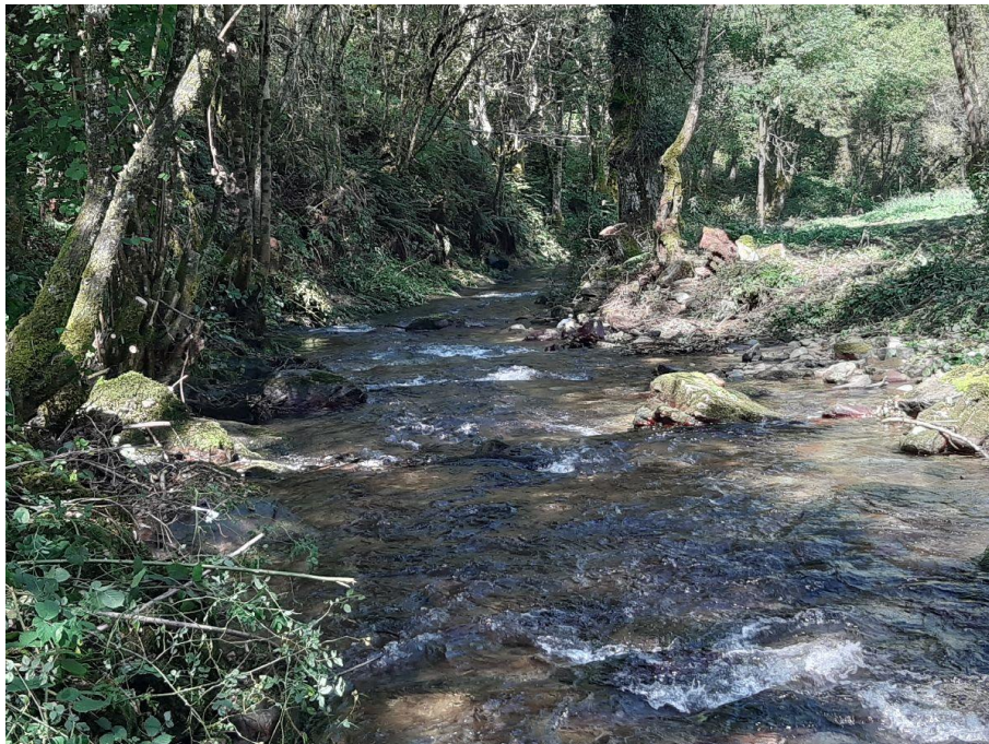
Después de la actuación en el río Navia en Doncos