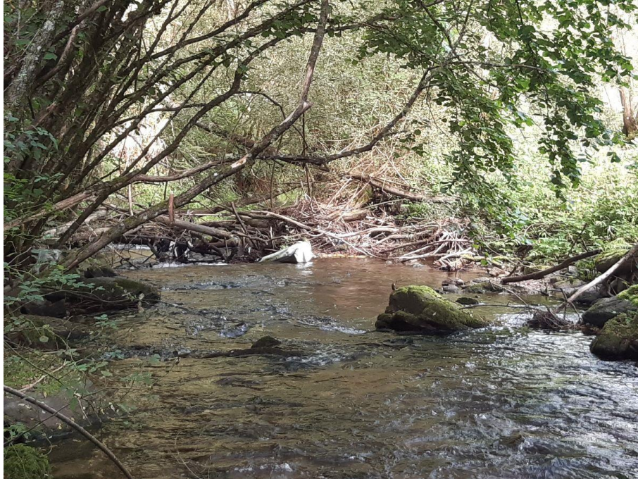
Antes de la actuación en el río Navia en Doncos