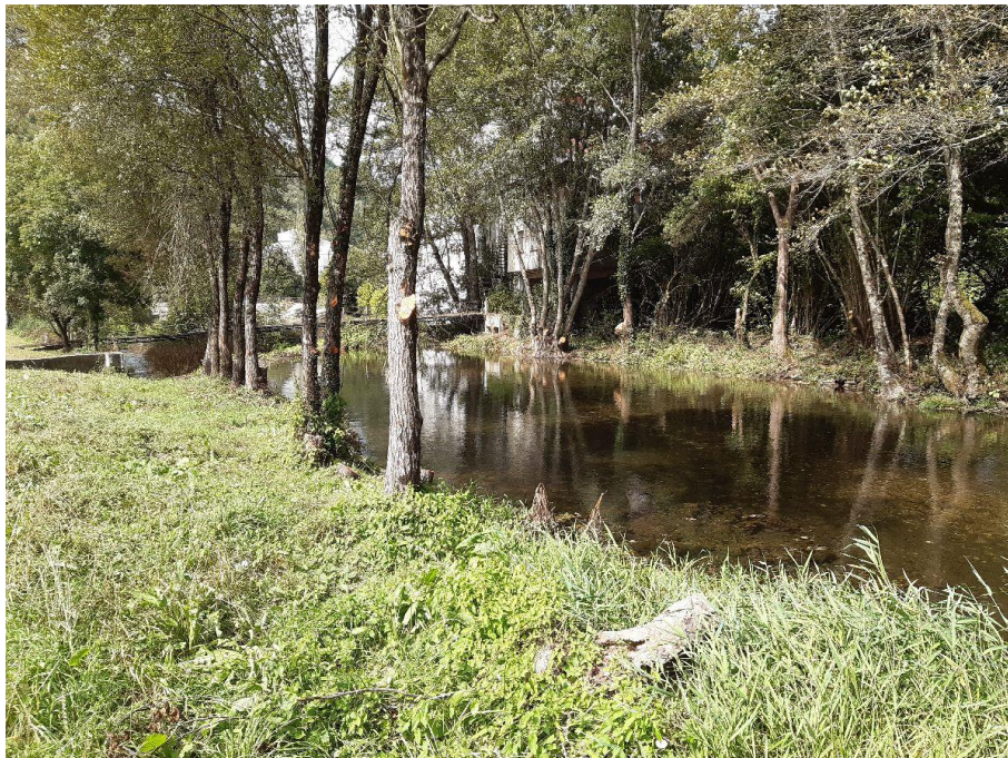
Después de la actuación en el río Navia en As Nogais