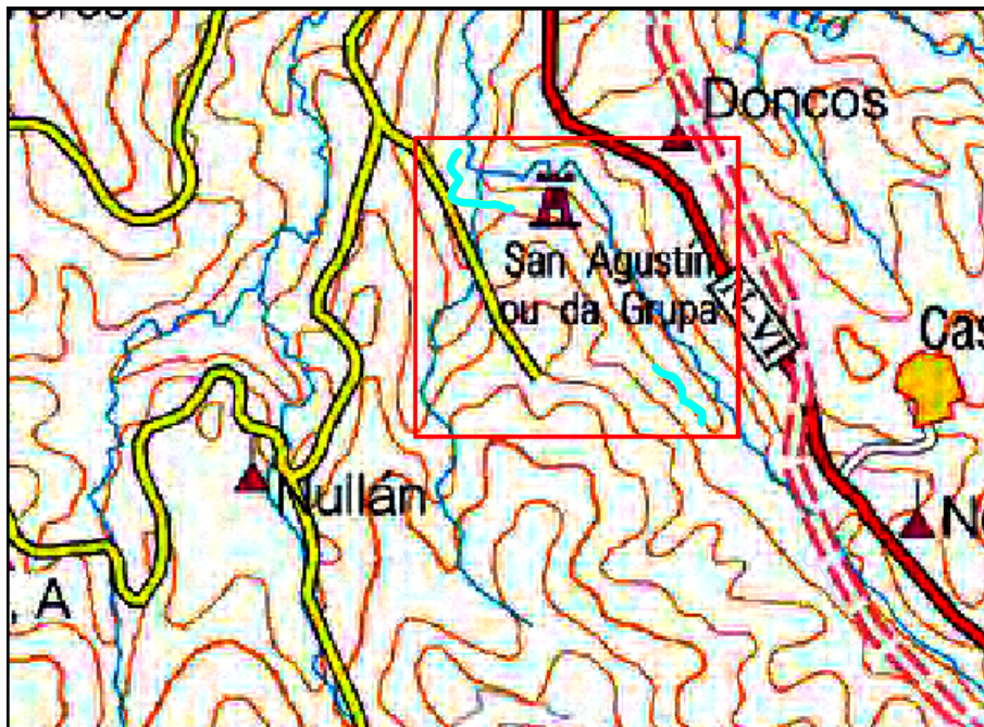
Localización de la actuación en el río Navia en Doncos y Torre de Doncos