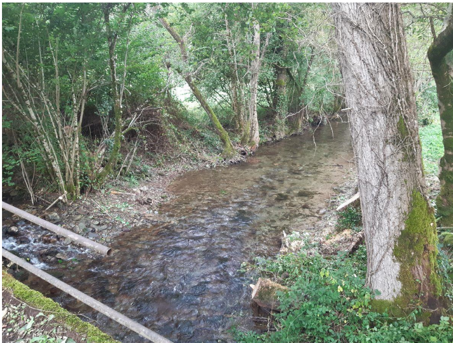
Después de la actuación en el río Navia en Torre de Doncos