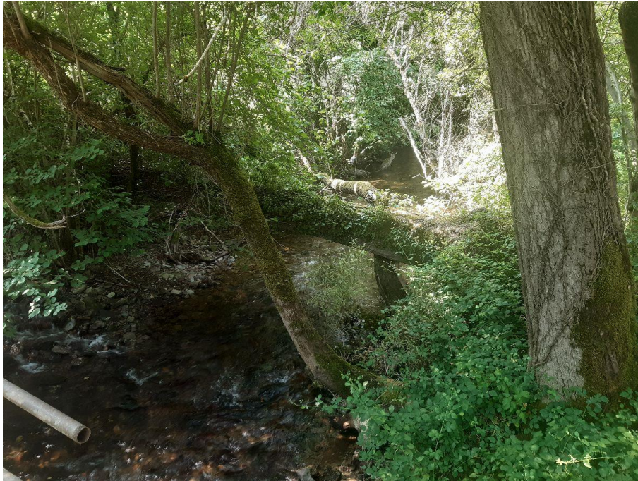
Antes de la actuación en el río Navia en Torre de Doncos