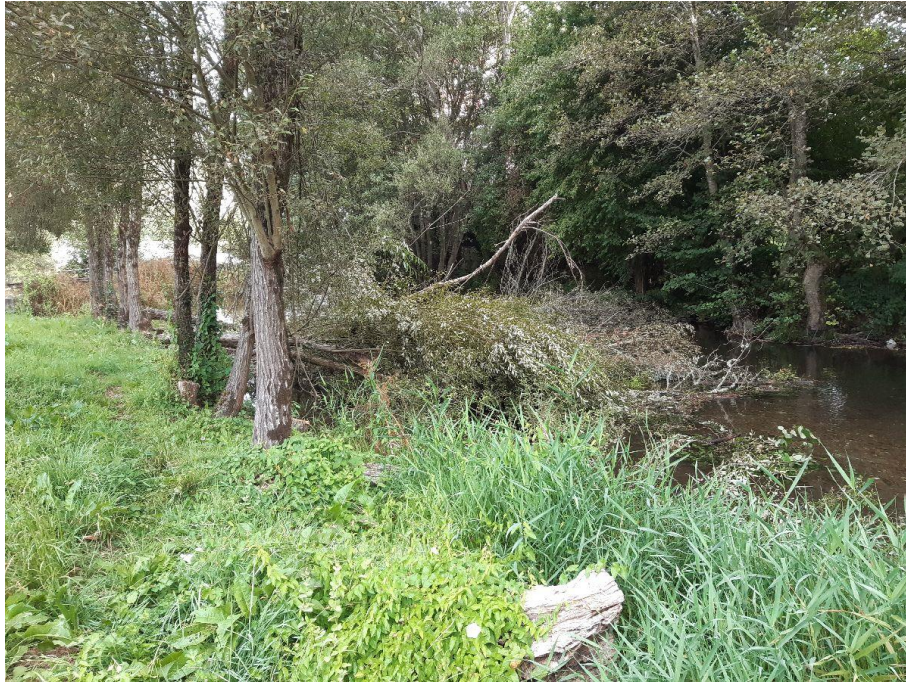
Antes de la actuación en el río Navia en As Nogais