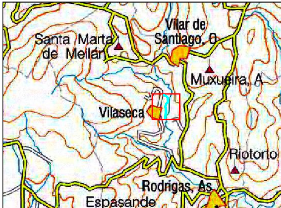
Localización de la actuación en el río Machín en O Machín