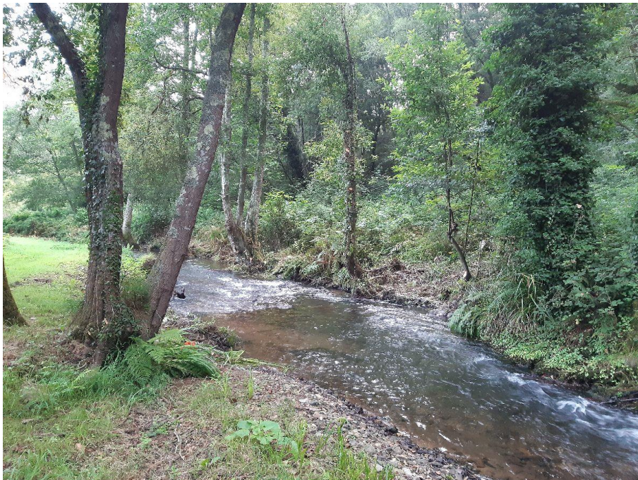
Después de la actuación en el río Torto en As Rodrigas