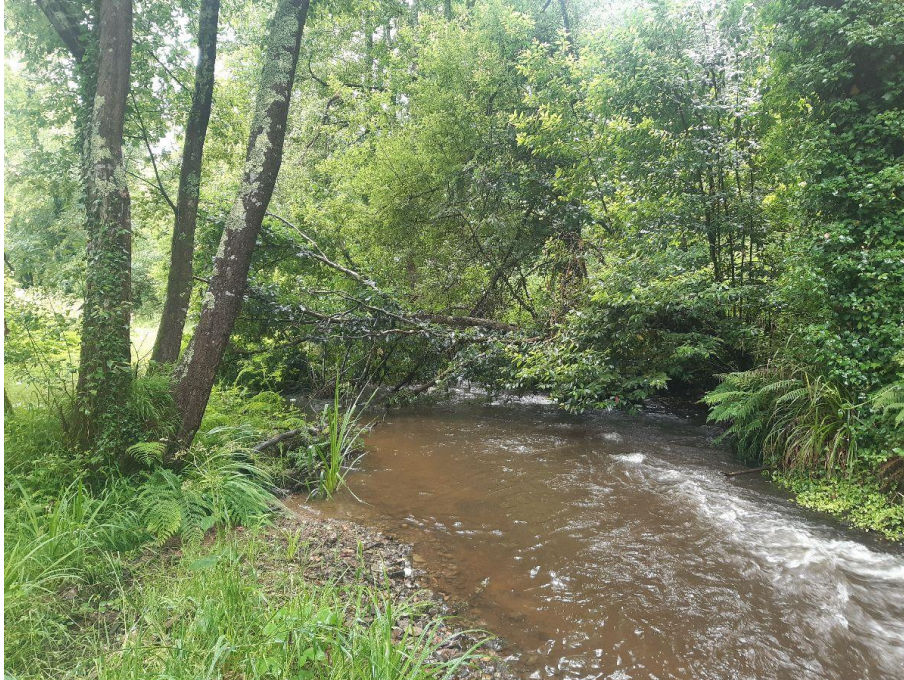
Antes de la actuación en el río Torto en As Rodrigas