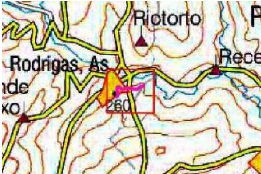
Localización de la actuación en el río Torto en As Rodrigues