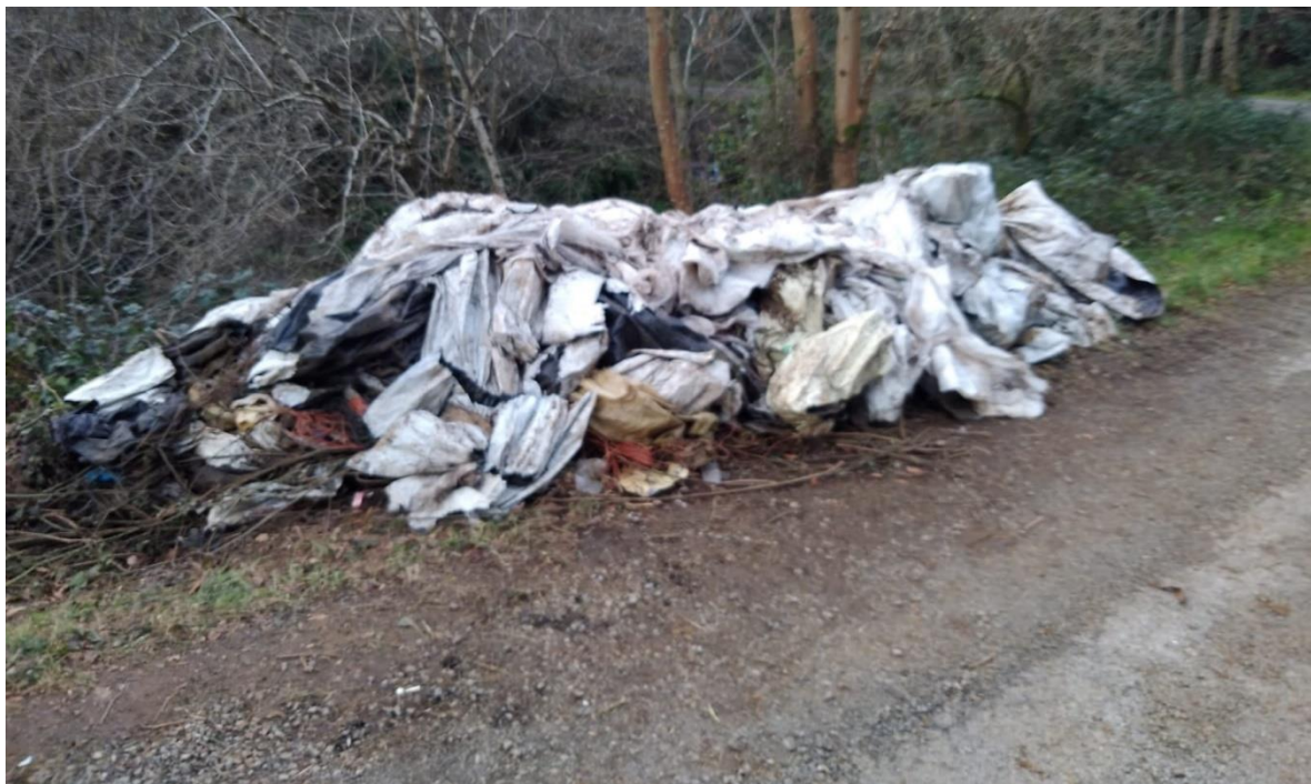
Restos extraídos de vertedero