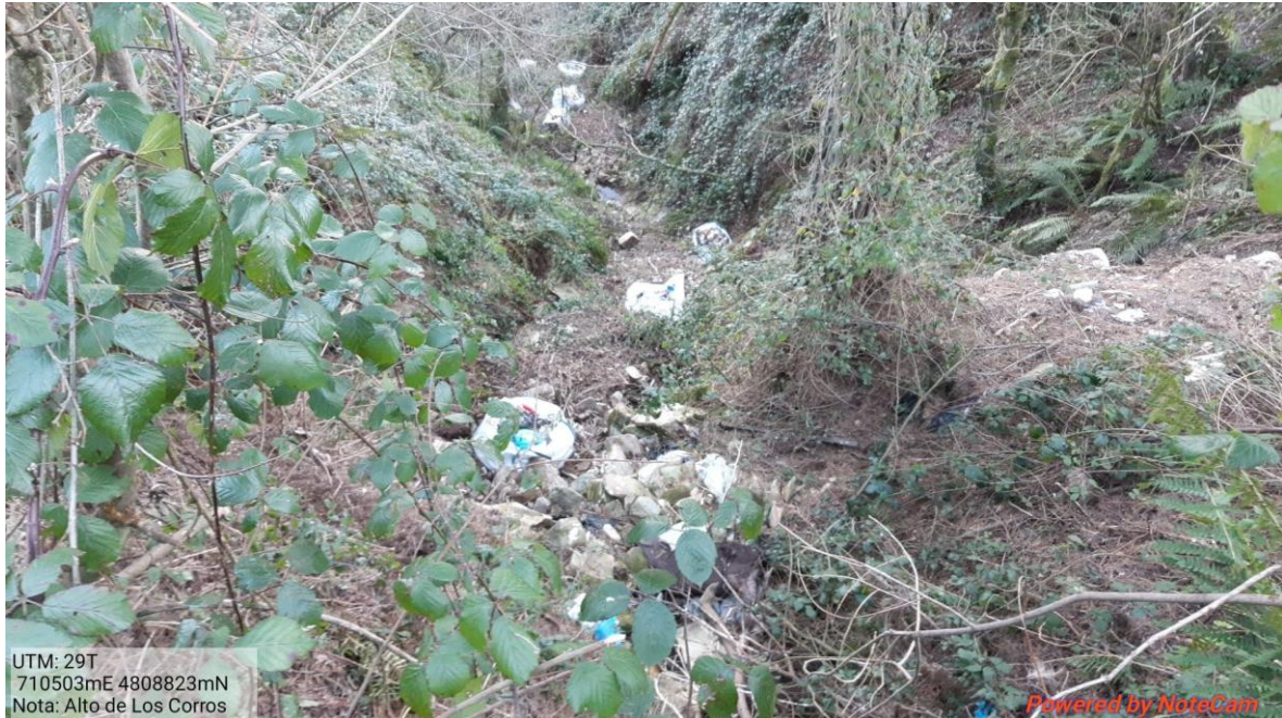
Antes de la actuación en el arroyo de Castro en Los Corros