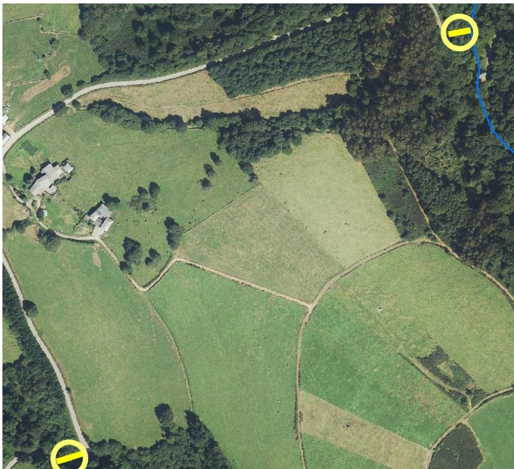
Localización de la actuación en el arroyo Selveras en Ayones