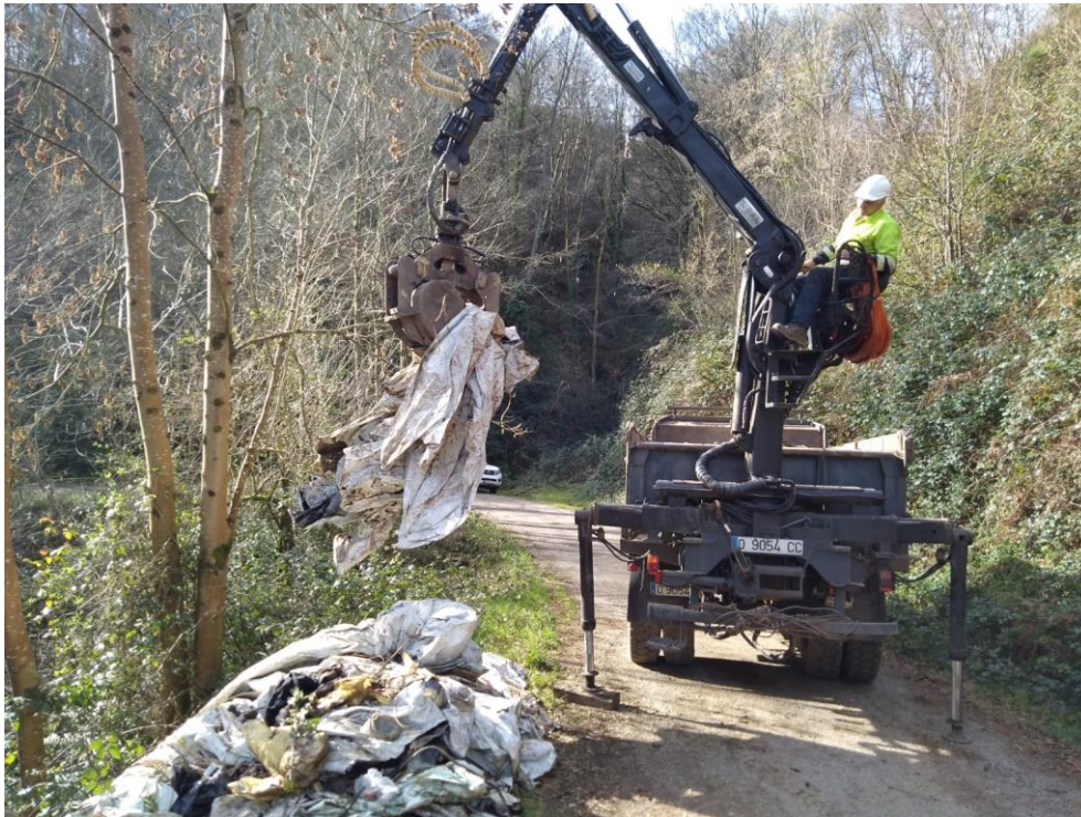
Carroceta retirando restos antrópicos