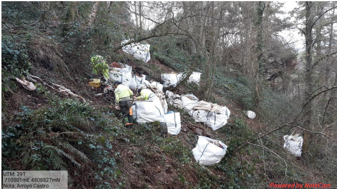
Operarios retirando restos antrópicos