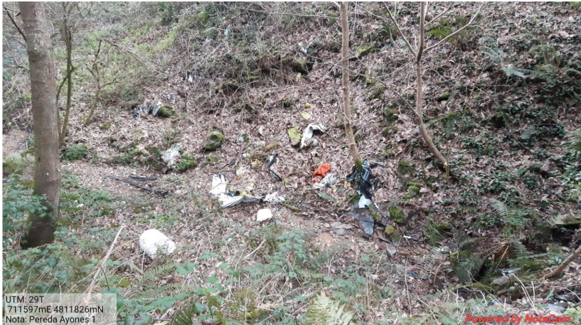
Antes de la actuación en el arroyo Selveras en Ayones