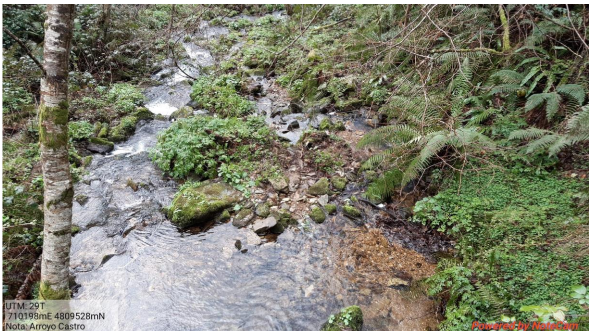
Después de la actuación en el arroyo de Castro en Los Corros