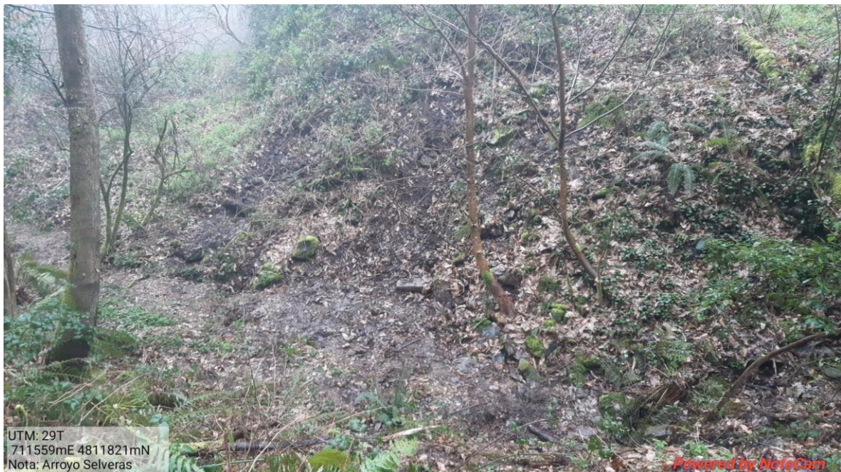
Después de la actuación en el arroyo Selveras en Ayones