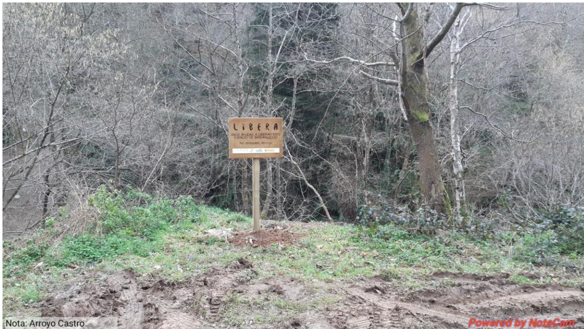
Cartel instalado para la concienciación sobre el arrojo de basura