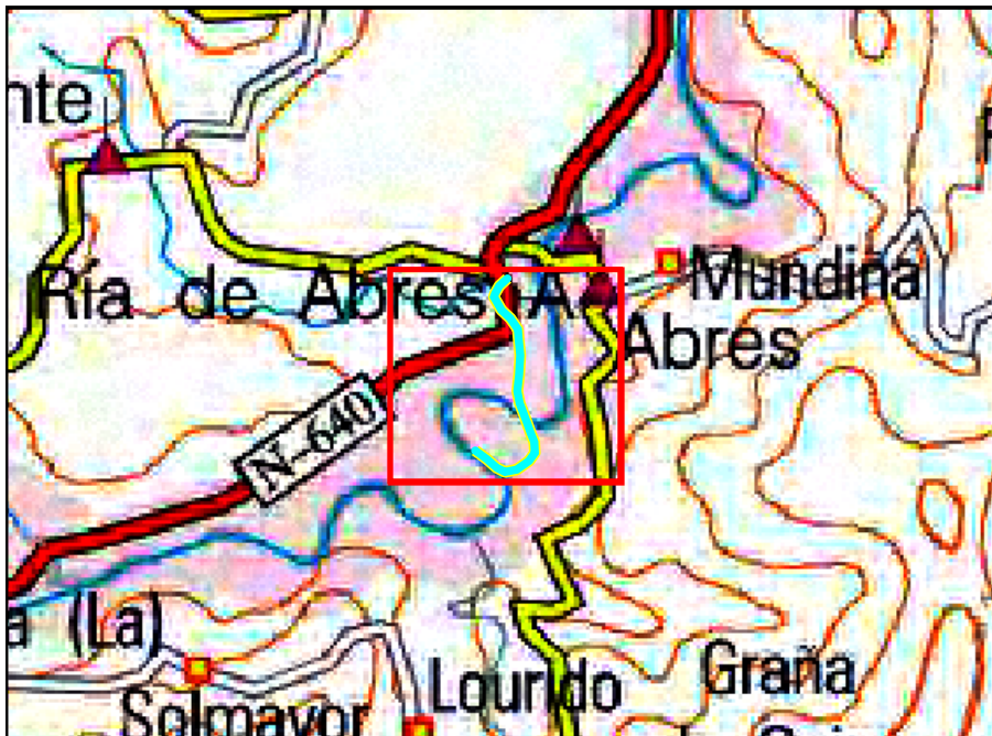
Localización de la actuación en el río Eo en Abres