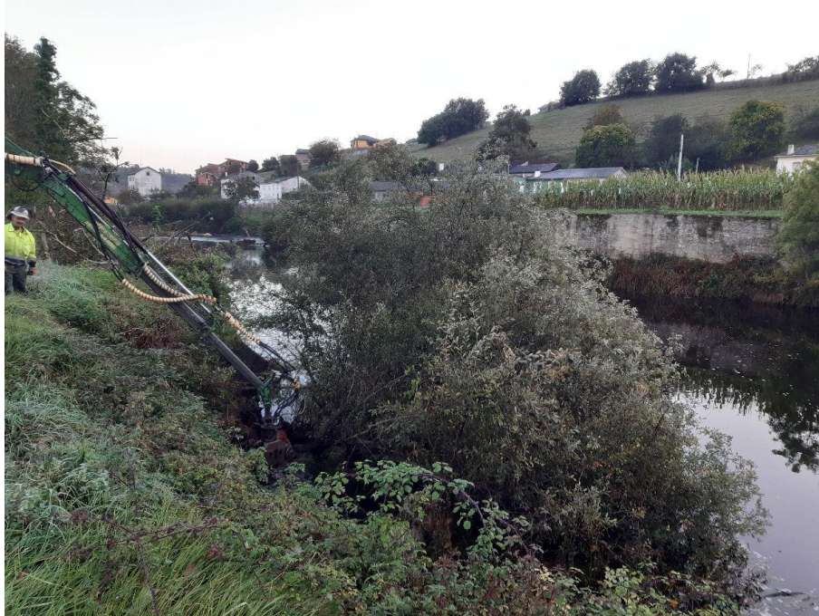
Antes de la actuación en el río Eo en Abres