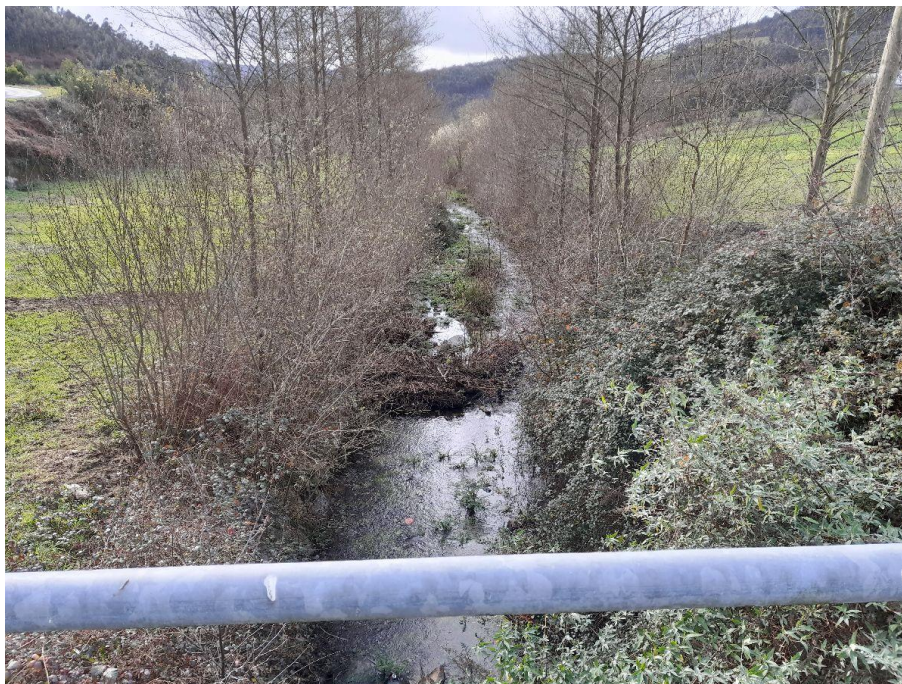
Antes de la actuación en el rego Vidal en Trabadela