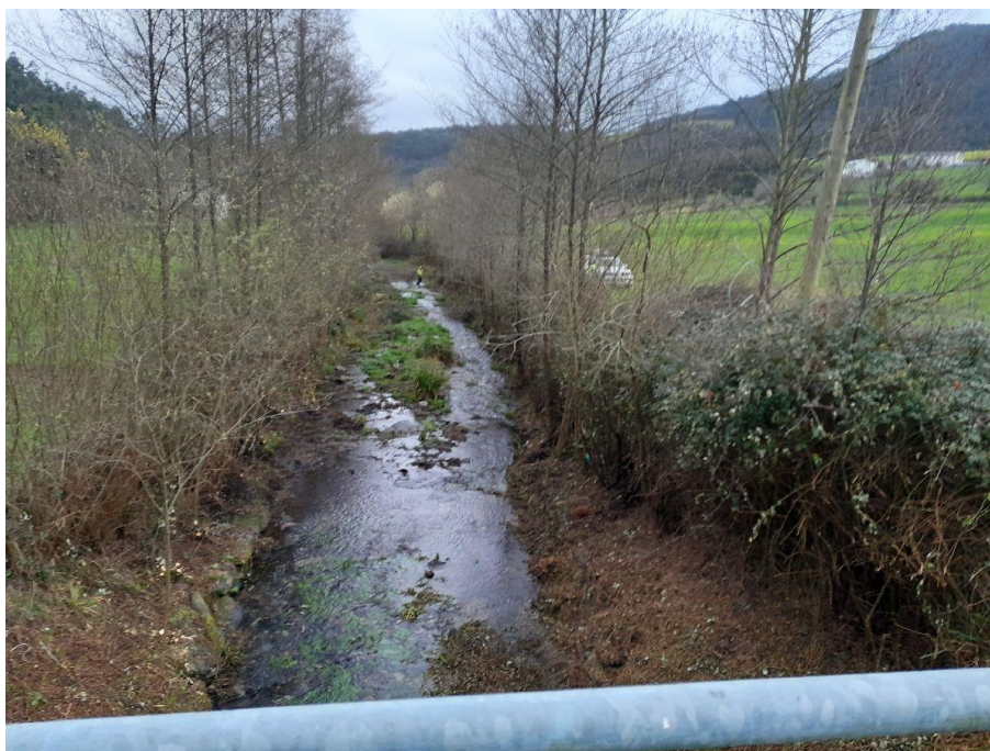
Después de la actuación en el rego Vidal en Trabadela