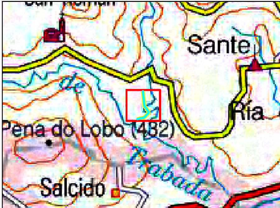
Localización de la actuación en el rego de Vidal en Trabadela