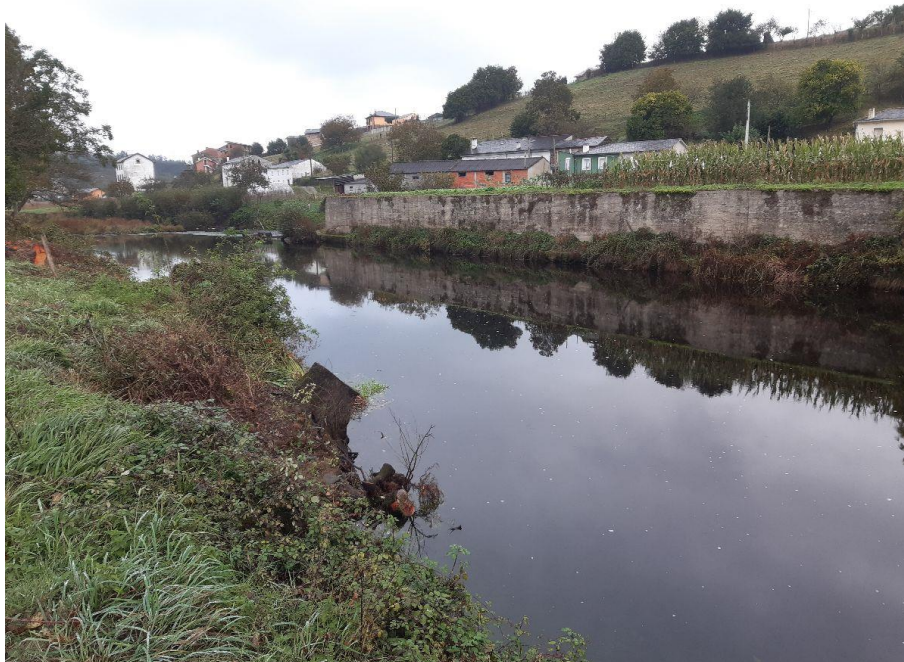
Después de la actuación en el río Eo en Abres