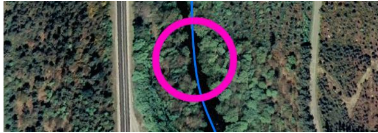
Localización de la actuación en el río Eo en Salmean (2)