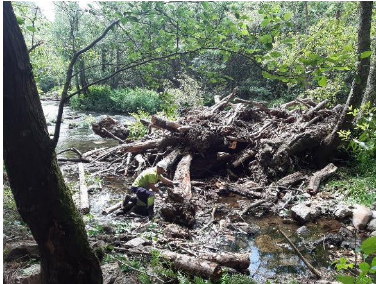
Antes de la retirada de restos vegetales en río Eo en Salmenán (2)