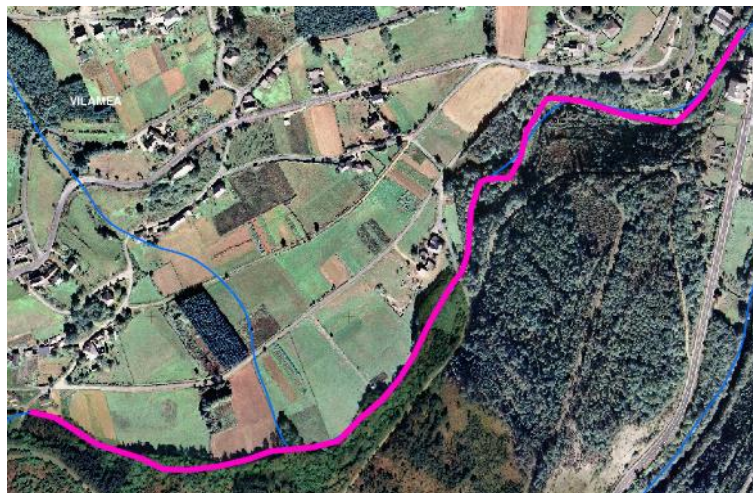
Localización de la actuación en el río Riotorto en Vilameá