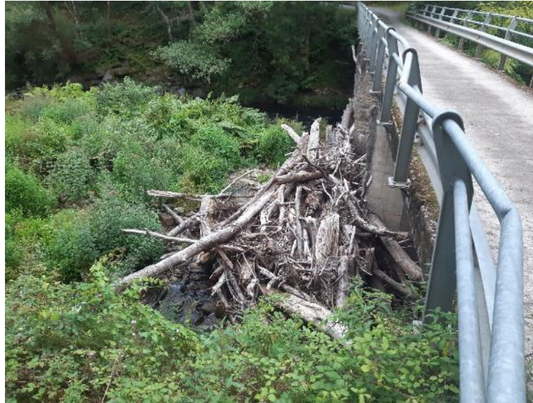
Antes de la retirada de restos vegetales en el río Eo en el Fondón