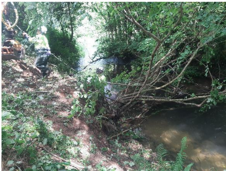
Operario retirando restos vegetales del cauce