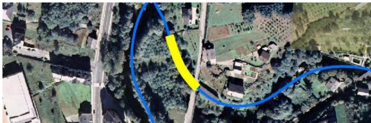
Localización de la actuación en el río Turia en A Pontenova