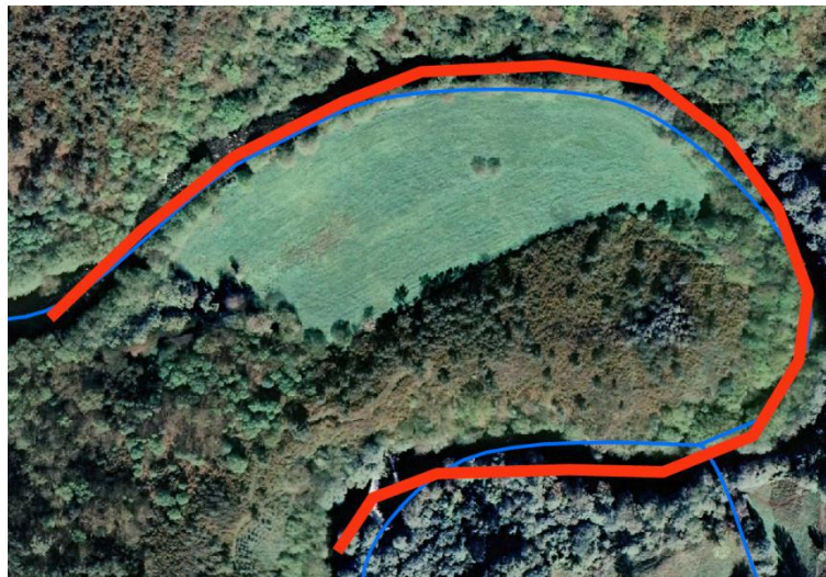
Localización de la actuación en el río Eo en Xinzo