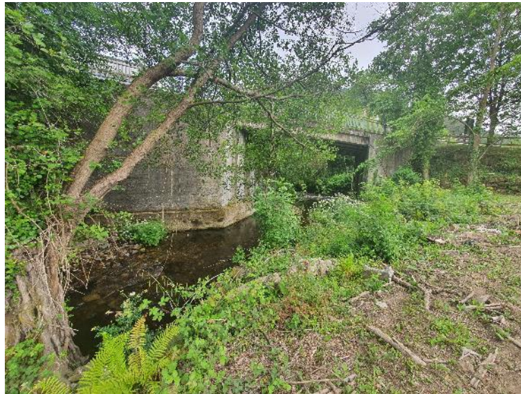
Antes de la actuación de restauración de márgenes en el río Turia en A Pontenova