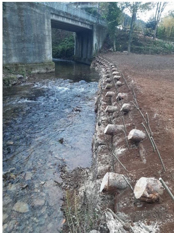
Después de la actuación de restauración de márgenes en el río Turia en A Pontenova