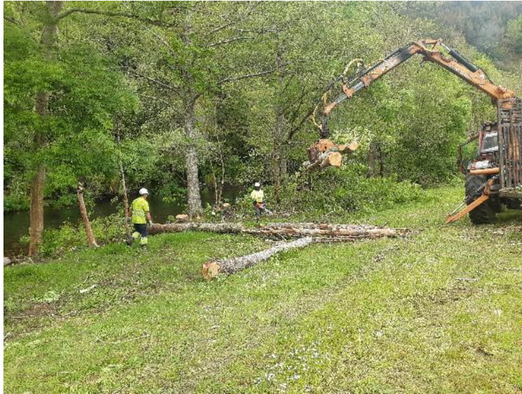
Autocargador retirando restos vegetales