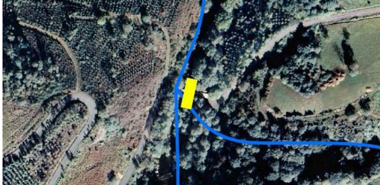
Localización de la actuación en el río Eo en O Fondón