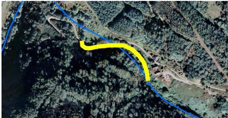
Localización de la actuación en el río Das Reigadas en O Machuco