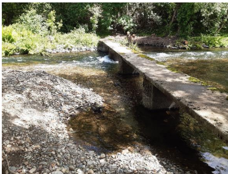
Después de la retirada de restos vegetales en río Eo en Salmenán (1)