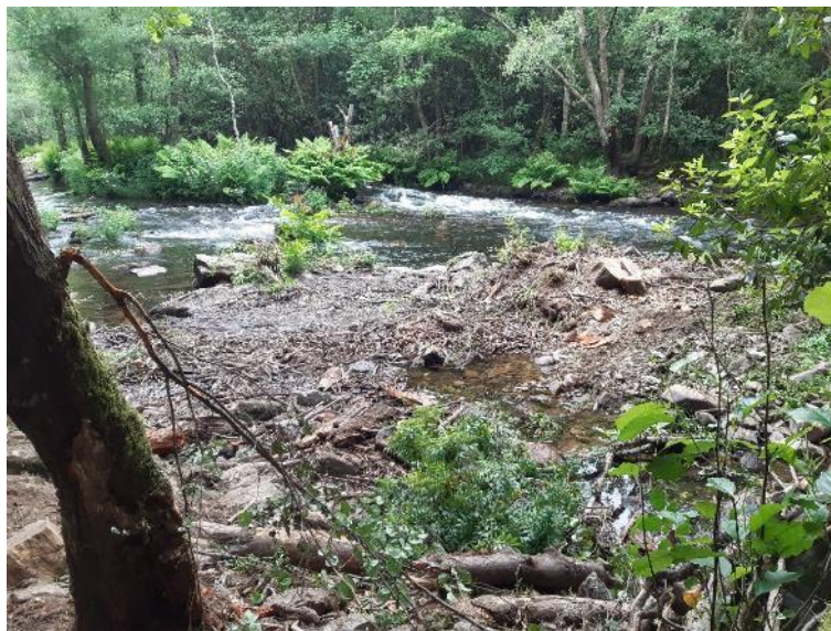
Después de la retirada de restos vegetales en río Eo en Salmenán (2)