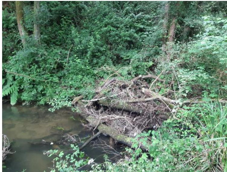
Antes de la retirada de restos vegetales en el río Riotorto en Vilameá