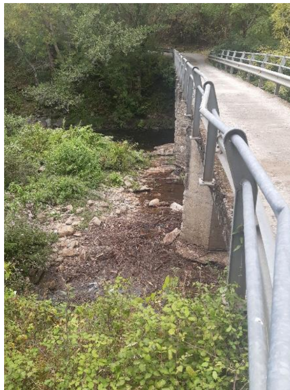
Después de la retirada de restos vegetales en el río Eo en el Fondón