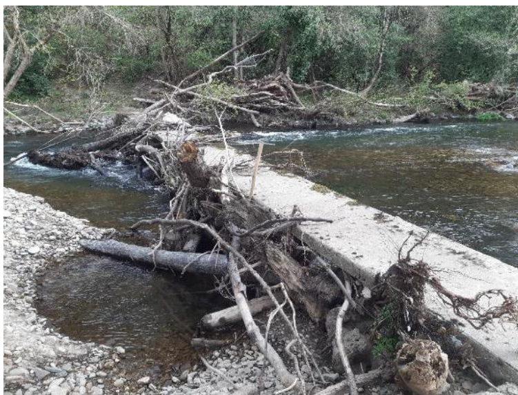
Antes de la retirada de restos vegetales en río Eo en Salmenán (1)