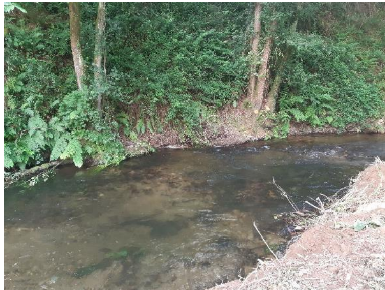
Después de la retirada de restos vegetales en el río Riotorto en Vilameá