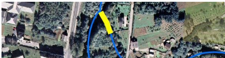
Localización de la actuación en el río Turia en o Boulloso