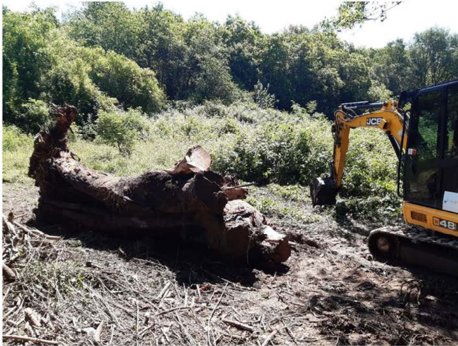
Mini-retro retirando restos vegetales del río