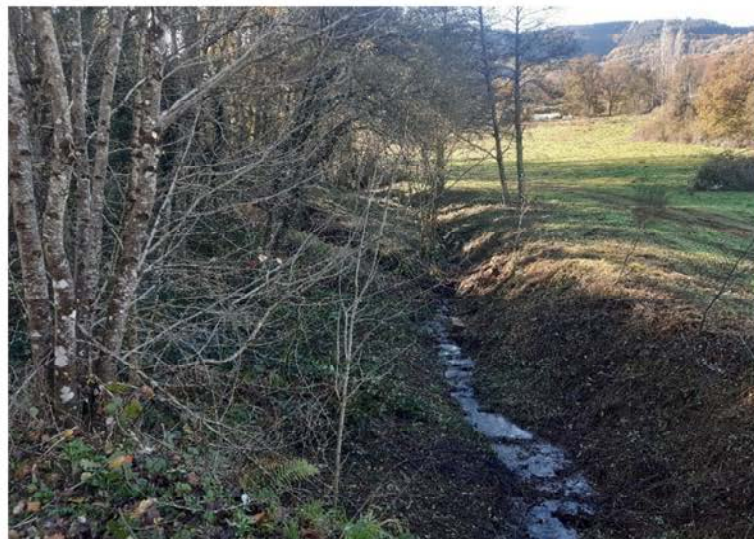
Después de la actuación en el rego Do Vao en Becerreá