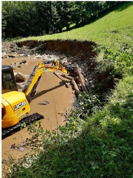
Después de la actuación en el río Cervantes en A Golada