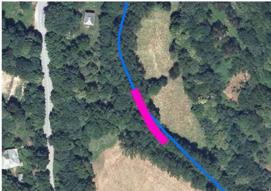
Localización de la actuación en el río Navia en Cela