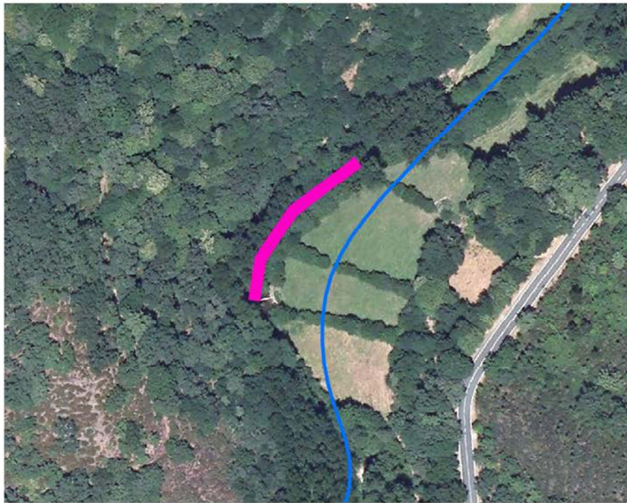
Localización de la actuación en el río Cervantes en A Golada