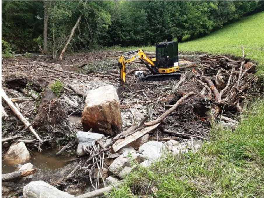
Antes de la actuación en el río Cervantes en A Golada