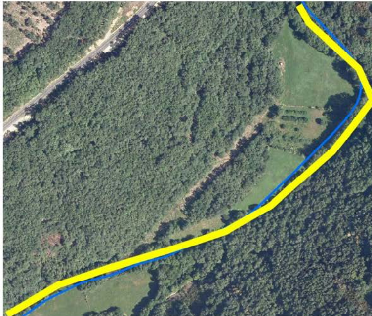
Localización de la actuación en el río Navia en Vilachá