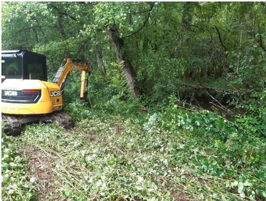
Mini-retro retirando restos vegetales del río