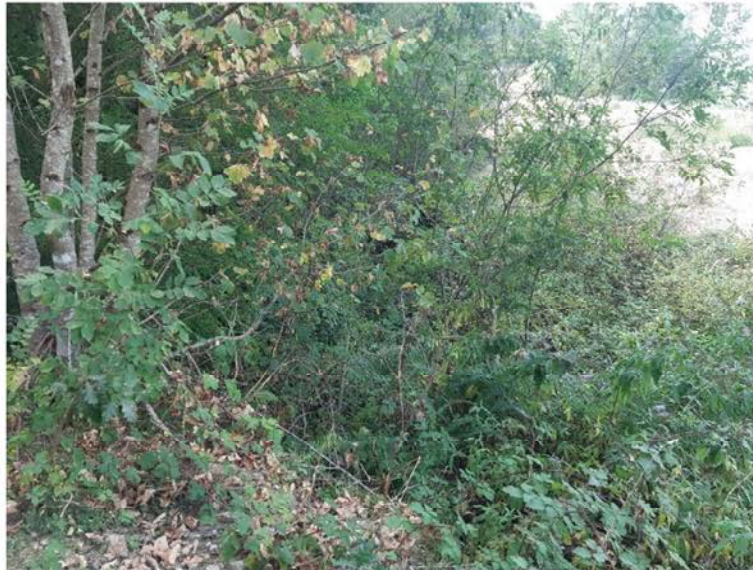
Antes de la actuación en el rego Do Vao en Becerreá