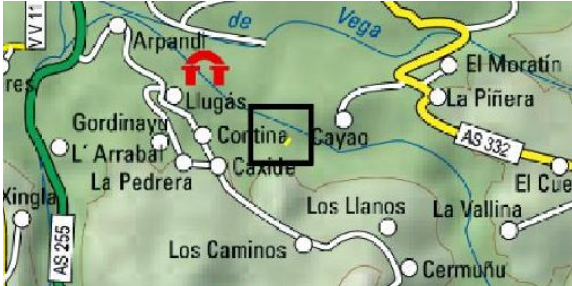
Localización de la actuación en el río Coro en el azud de Rebaste