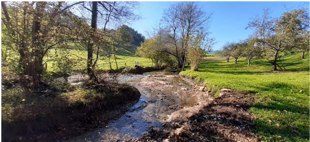
Después de la retirada del azud en el río Valdediós en la Lechería de Grases