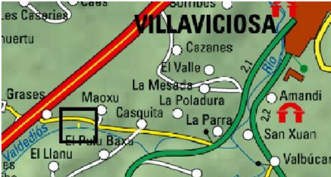
Localización de la actuación en el río Valdediós en el azud de la lechería Grases