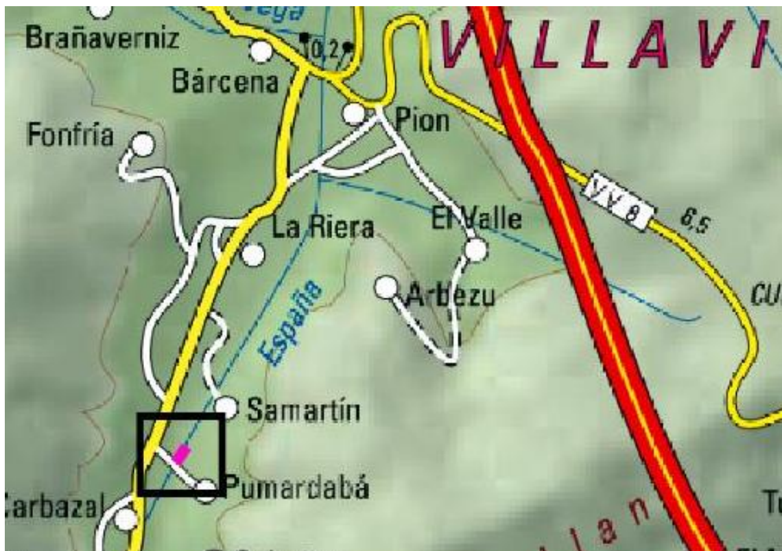
Localización de la actuación en el río España en Candanal