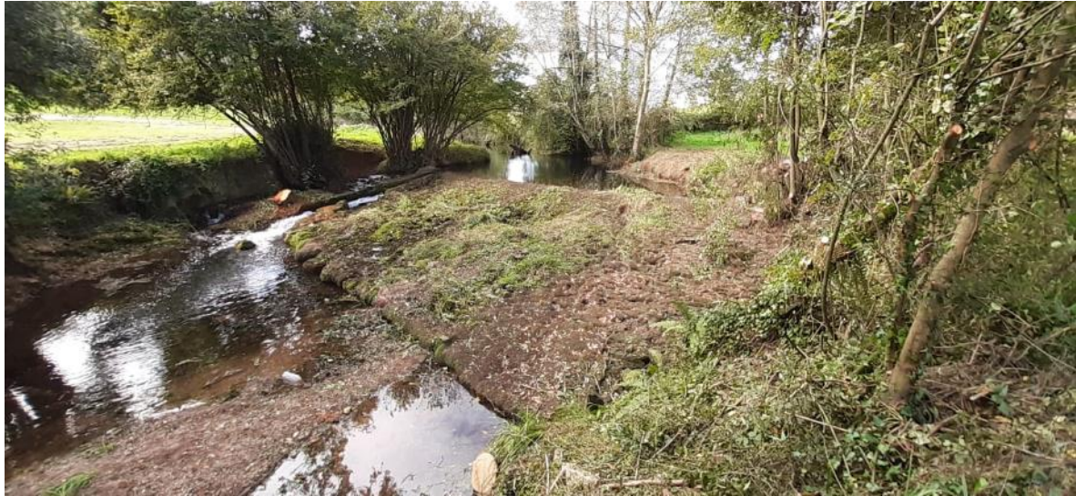
Antes de la retirada del azud en el río Valdediós en Grases