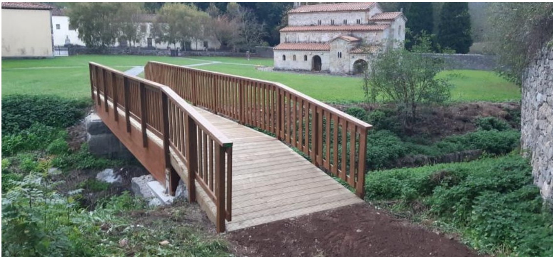
Después de la reposición de puente peatonal