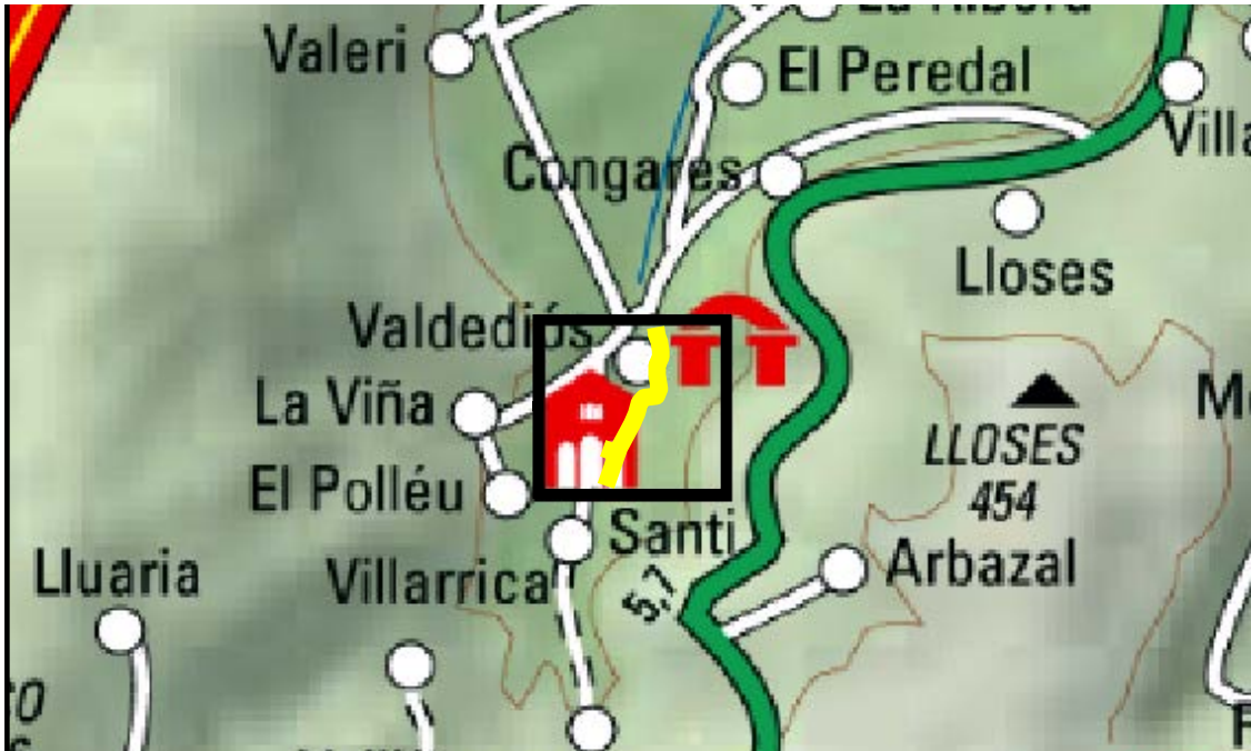
Localización de la actuación en el río Valdediós en el Monasterio de Valdediós