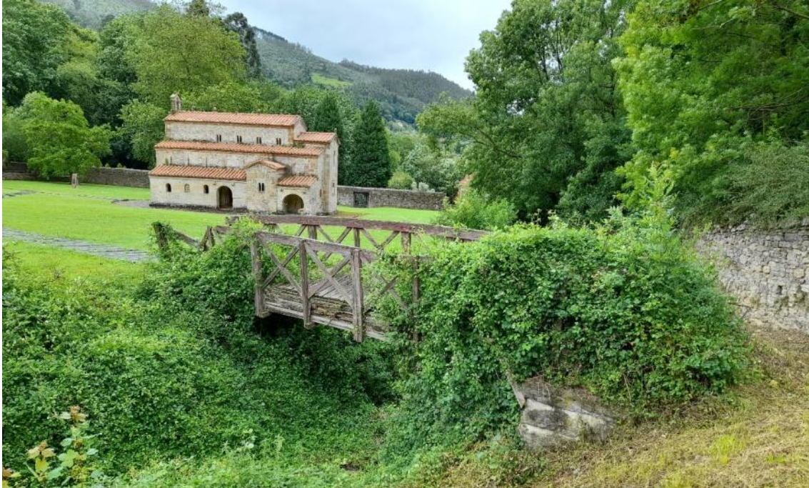
Antes de la retirada de puente peatonal en mal estado