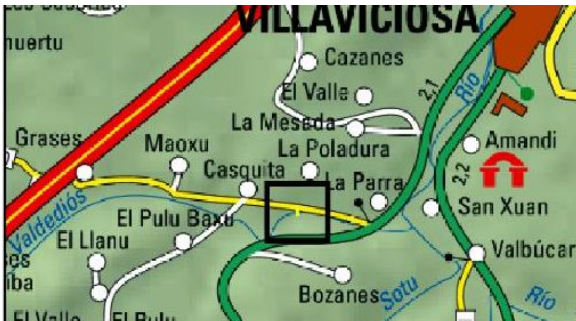
Localización de la actuación en el río Valdediós en el azud de Grases