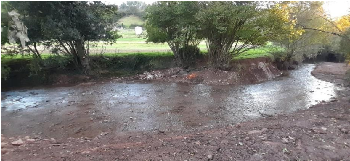
Después de la retirada del azud en el río Valdediós en Grases