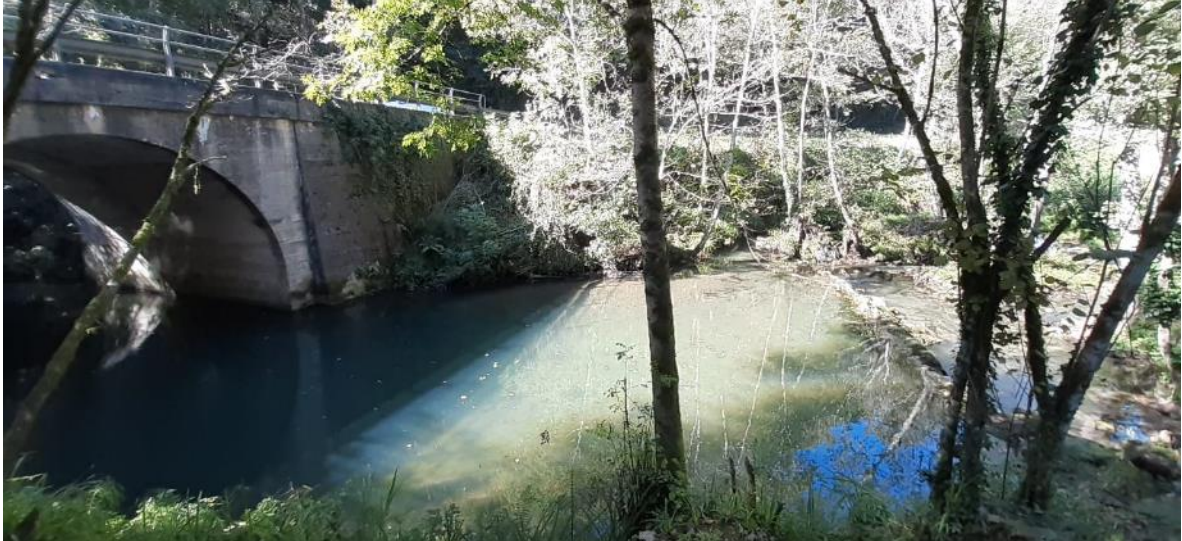
Antes de la demolición parcial del azud en el río España en Arroes