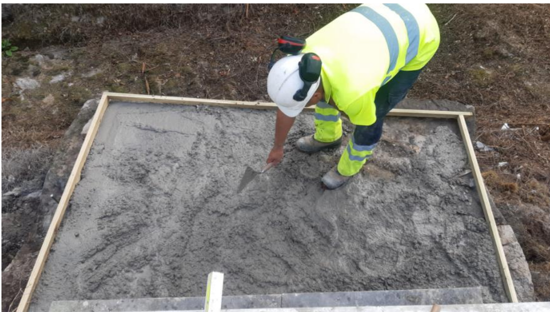
Operario trabajando en el hormigonado del asiento del puente