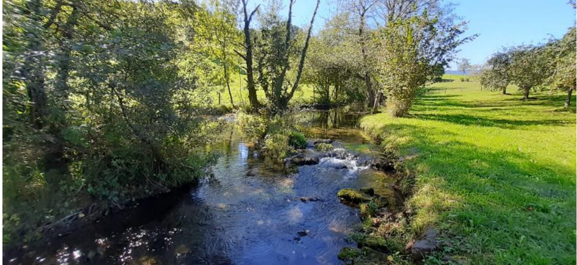
Antes de la retirada del azud en el río Valdediós en la Lechería de Grases