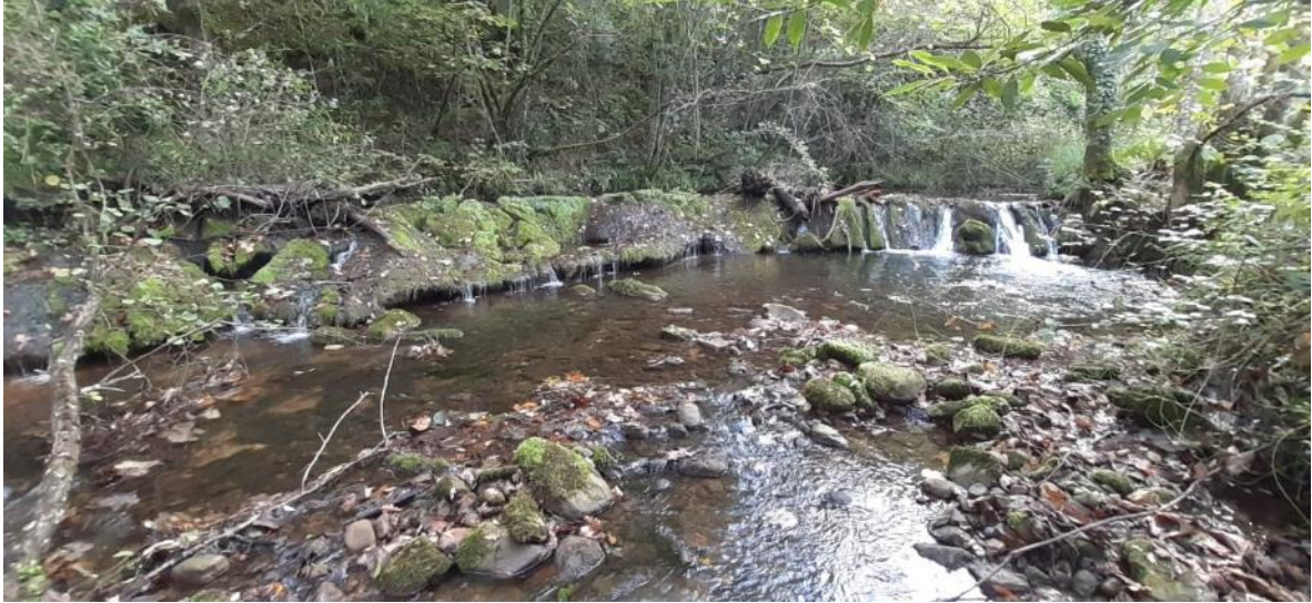
Antes de la retirada del azud en río Coro en Rebaste