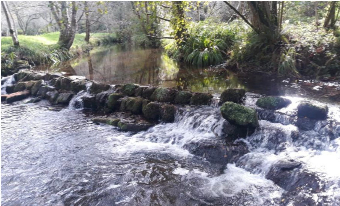
Antes de la retirada del azud en río Sebrayo en Sebrayo