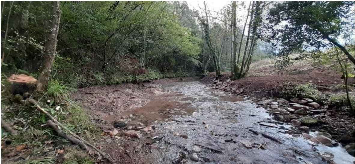
Después de la retirada del azud en río Coro en Rebaste