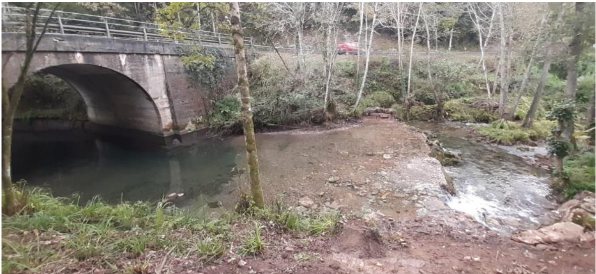
Después de la demolición parcial del azud en el río España en Arroes