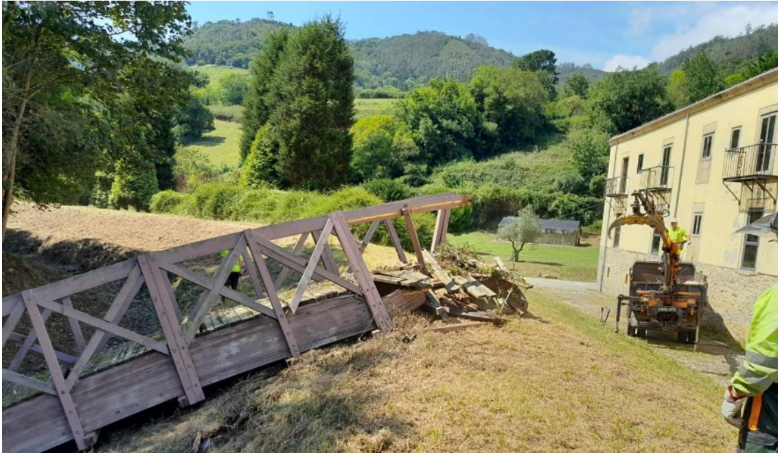
Carroceta retirando el antiguo puente en mal estado