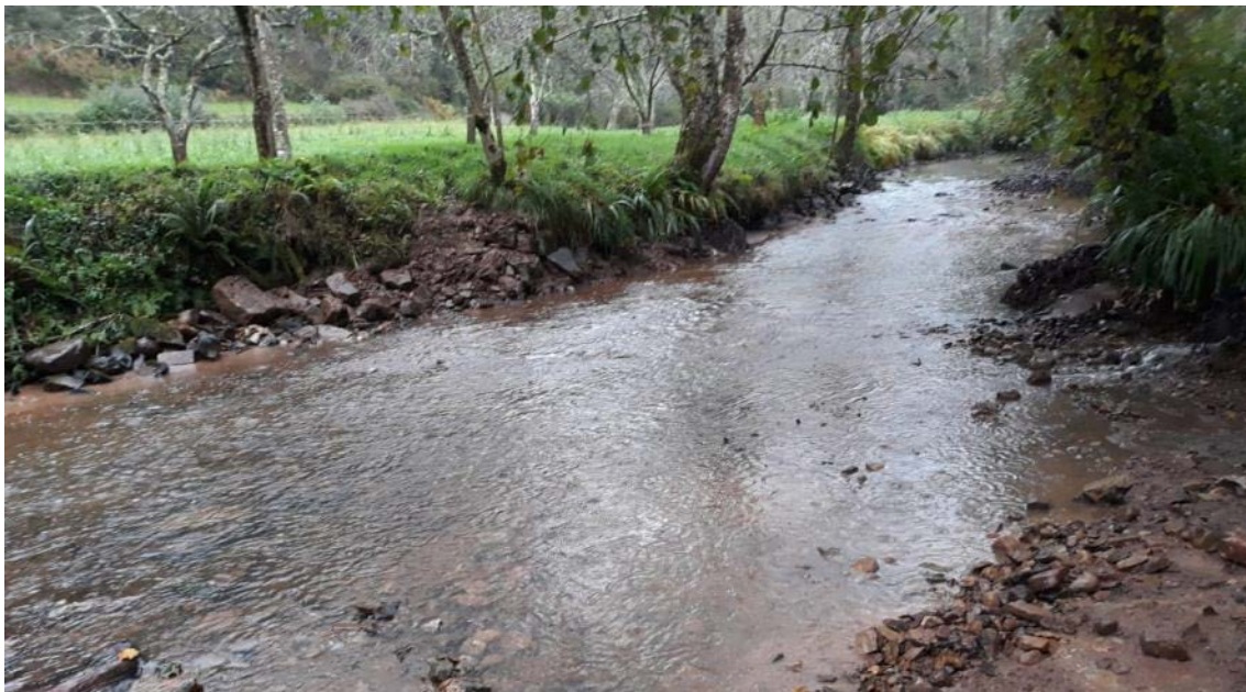
Después de la retirada del azud en río Sebrayo en Sebrayo