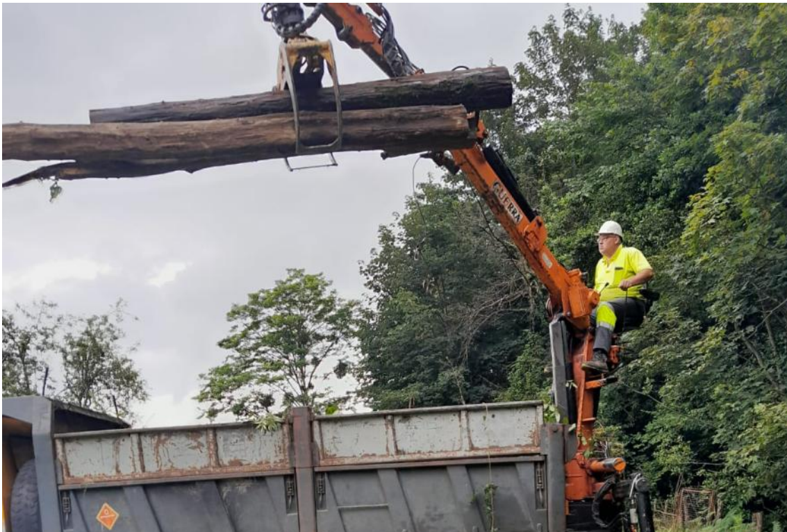
Carroceta retirando restos vegetales