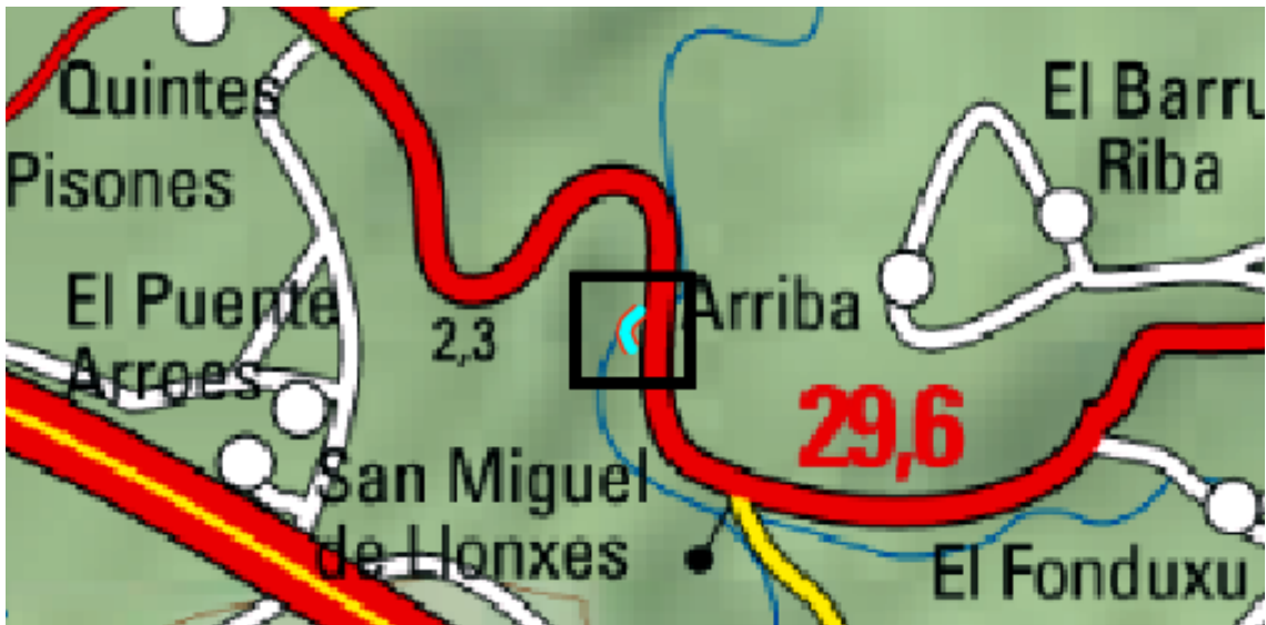
Localización de la actuación en el río España en el Puente