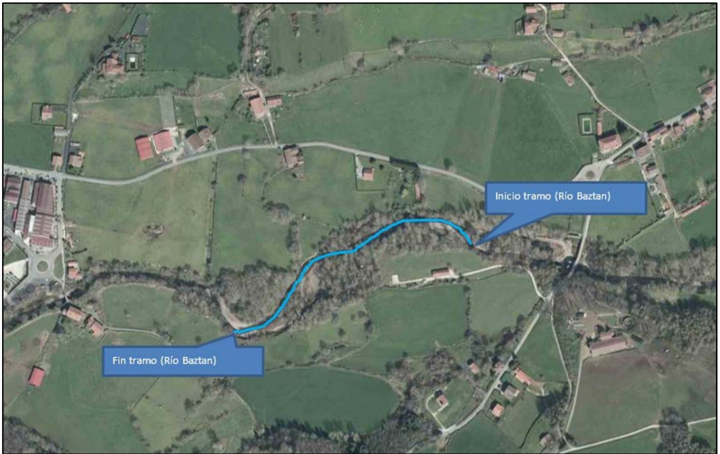
Localización de la actuación, paraje Ordoki-Bozate