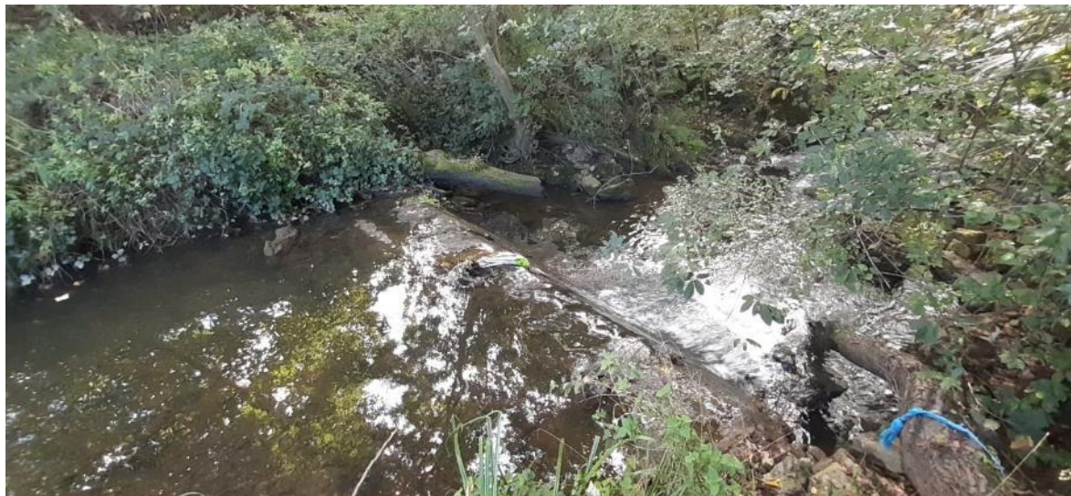
Antes de la retirada del azud en río Miravete en Quintanal