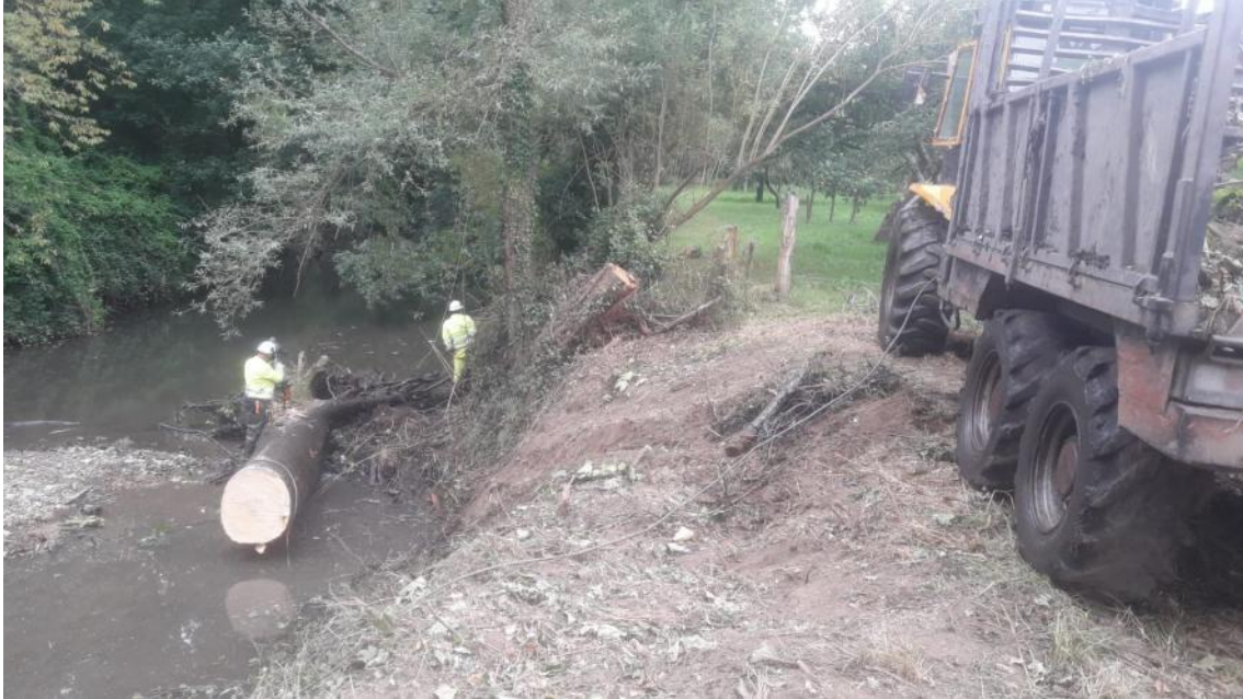
Operarios y autocargador retirando árbol del cauce