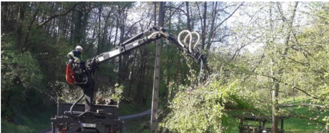
Carroceta retirando restos vegetales