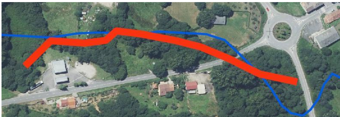
Localización de la actuación en el arroyo Bendición en Bendición