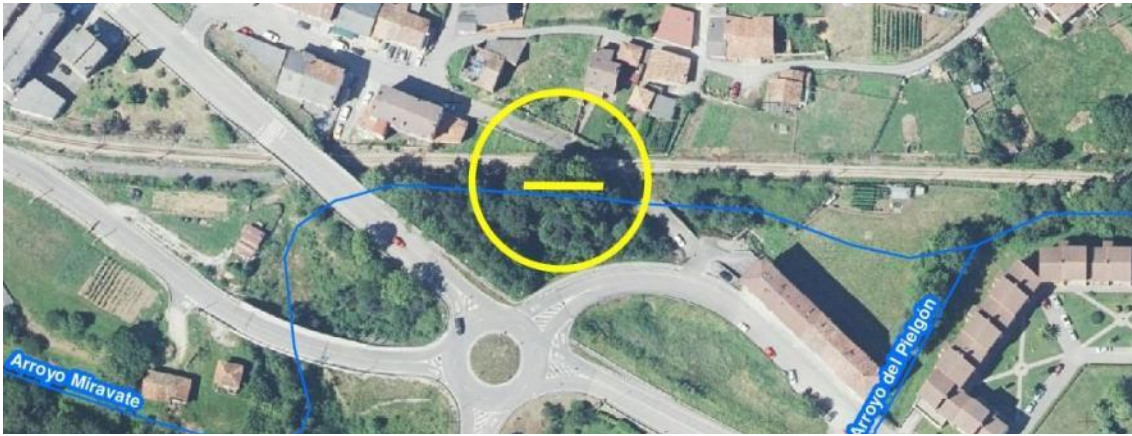
Localización de la actuación en el río Miravate en el azud de Quintanal