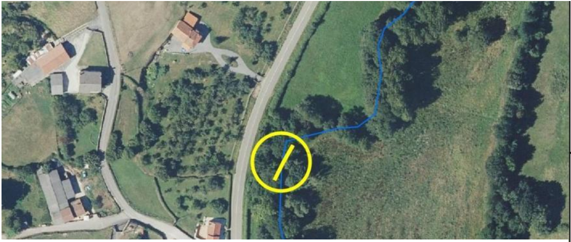
Localización de la actuación en el río Nora en el azud de Secadiella