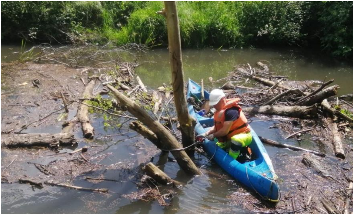
Operario retirando restos vegetales desde canoa