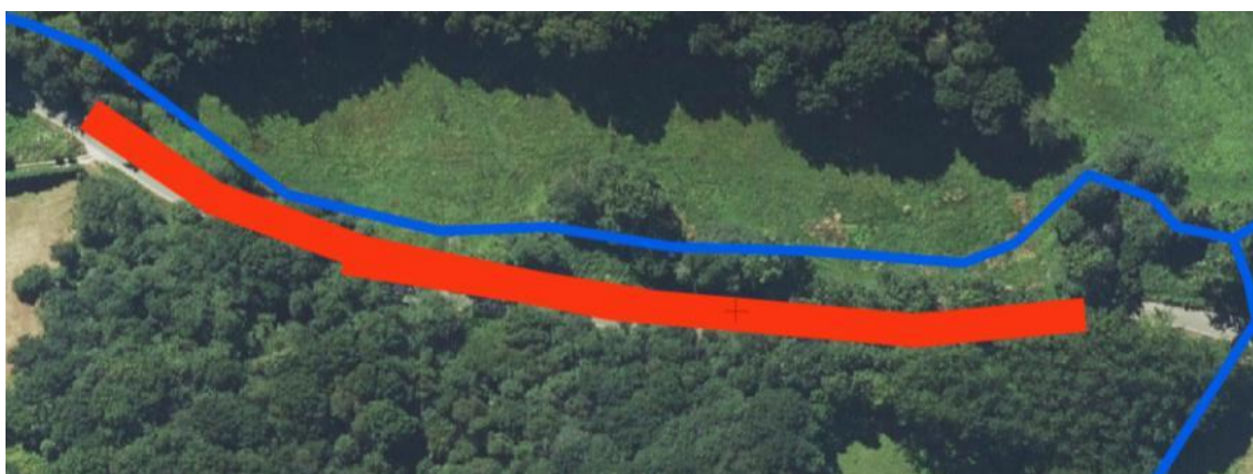
Localización de la actuación en el arroyo Toral en Traspando