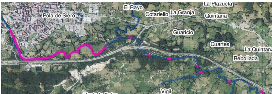
Localización de la actuación en el río Nora en Bergueres