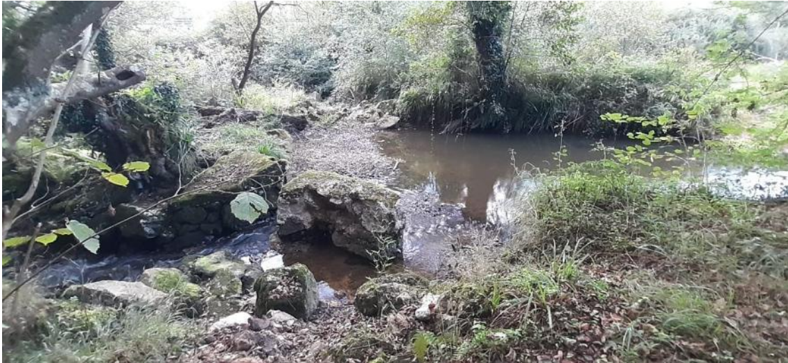
Antes de la retirada del azud en río Nora en Secadiello