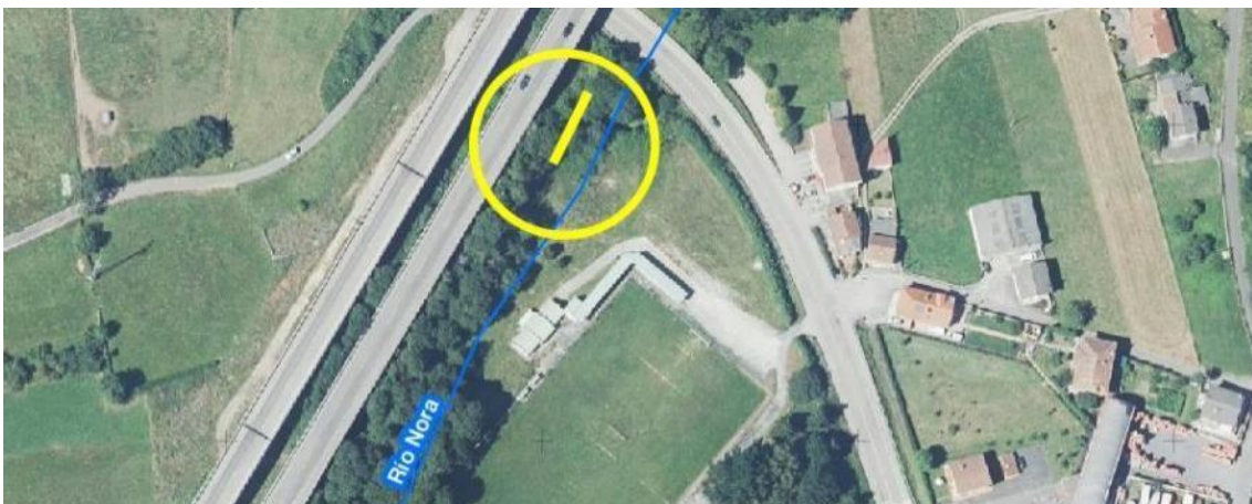
Localización de la actuación en el río Nora en Lieres