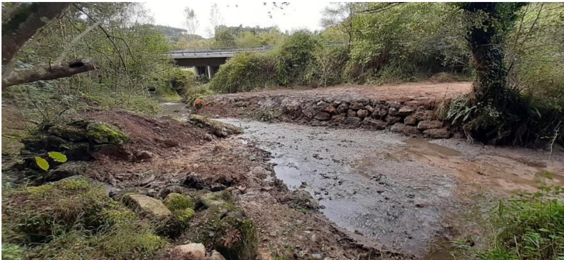
Después de la retirada del azud en río Nora en Secadiello