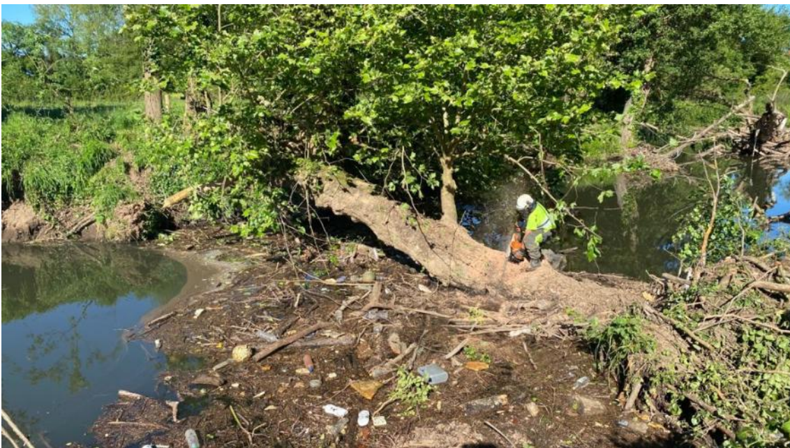
Operario cortando árbol caído sobre el cauce