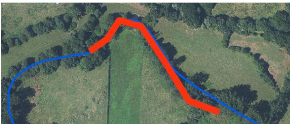
Localización de la actuación en el río Nora en Carvayal