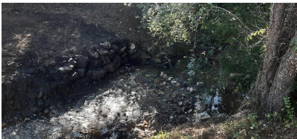
Después de la retirada del azud en río Miravete en Quintanal