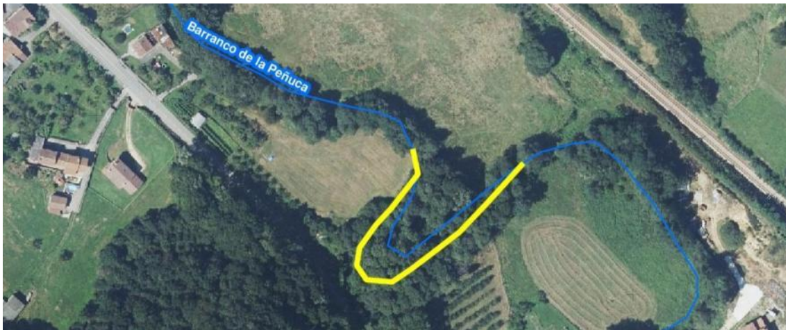
Localización de la actuación en el arroyo la Peñuca en Bendición