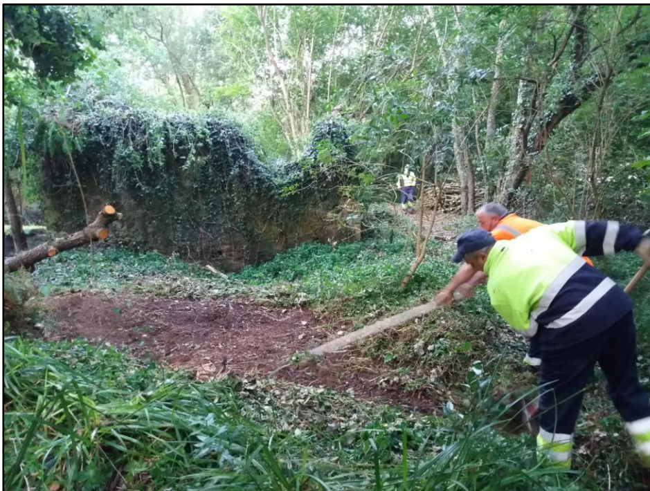
Retirada inicial de flora invasora en el ámbito de la actuación ( Tradescantia fluminensis )