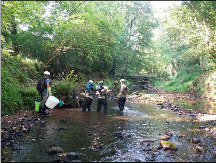
Pesca eléctrica previa a la entrada de la maquinaria