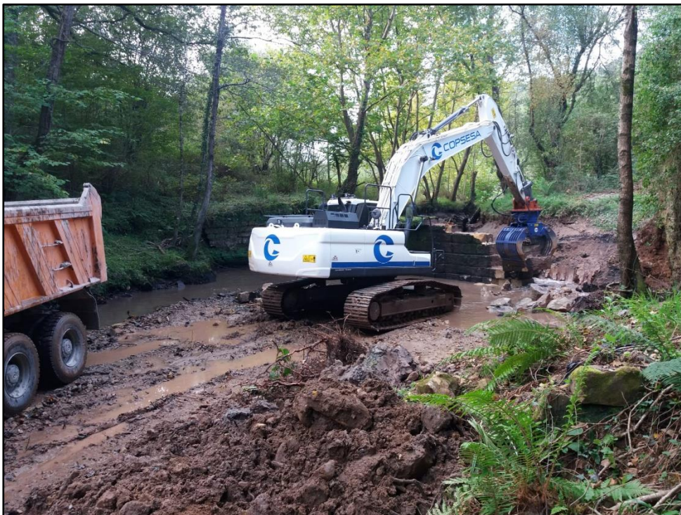
Extracción del azud