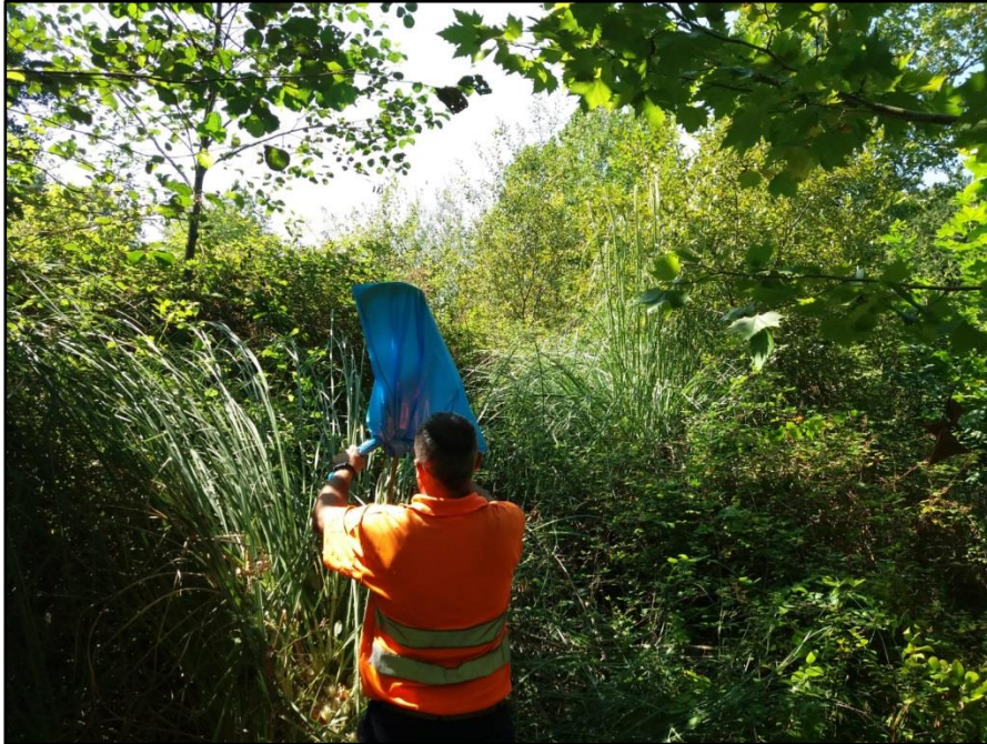
Retirada inicial de flora invasora en el ámbito de la actuación ( Cortaderia selloana )