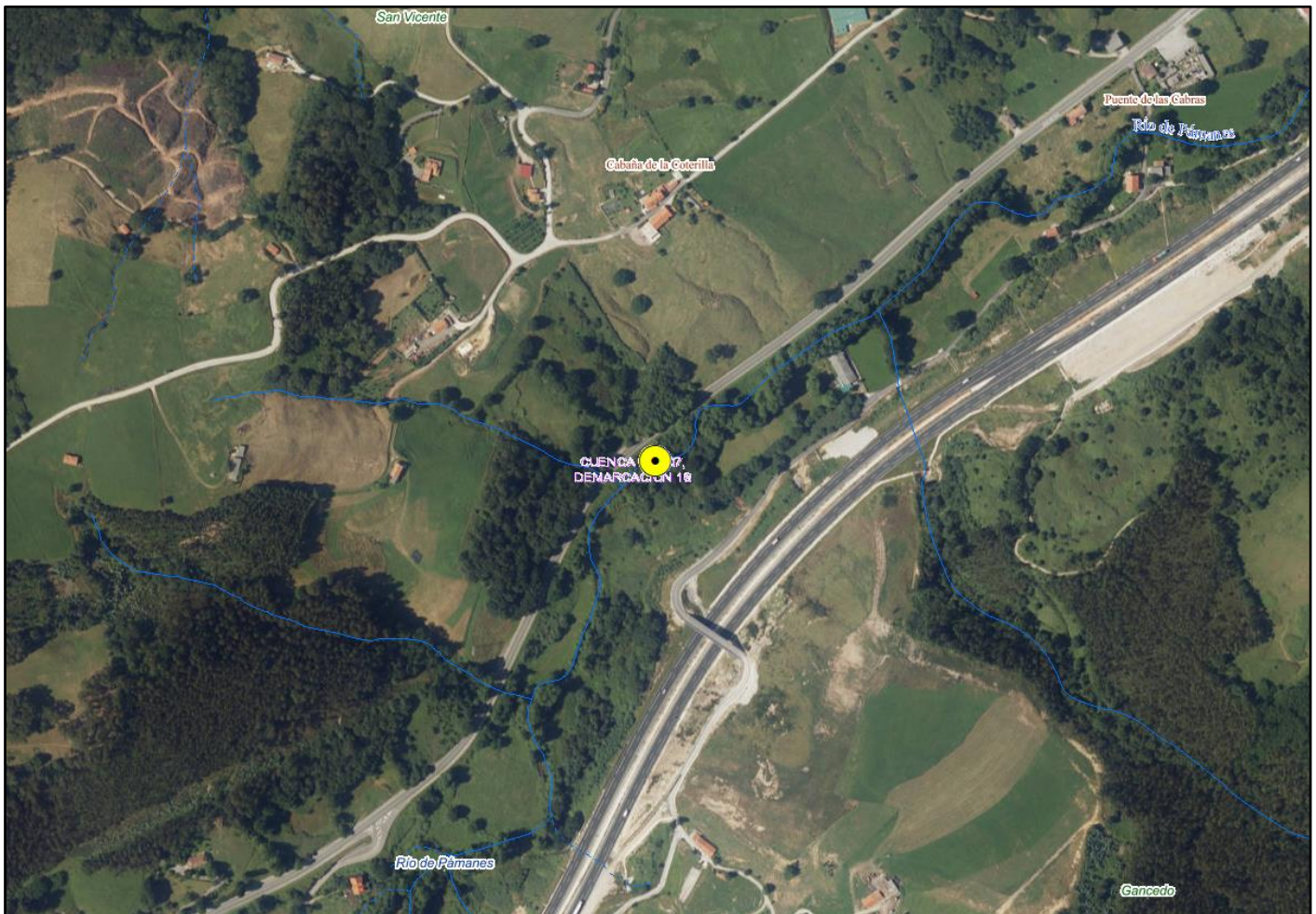
Localización de la actuación

Estas actuaciones se realizan a través de la empresa pública Tragsa dentro del Programa de mantenimiento y conservación de cauces que está ejecutando la Confederación Hidrográfica del Cantábrico en la comunidad autónoma de Cantabria, fuera de las zonas urbanas en las que estas labores son competencia de los ayuntamientos. En el año 2020 la inversión realizada en trabajos de conservación y mantenimiento de cauces en Cantabria fue de 2,7 millones de euros, repartida en 72 actuaciones en 42 municipios.